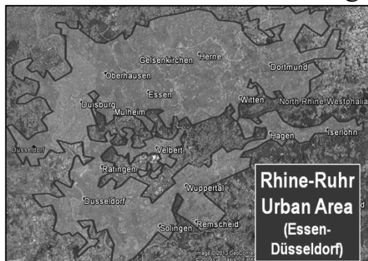
ت ۳. راین روور: منطقه شهری اسن- دوسلدولف.

۴. تعاملات و ارتباطات عملکردی و مکمل بودن بین شهری در منطقه (بیش از تعامل با سایر شهرهای خارج منطقه)