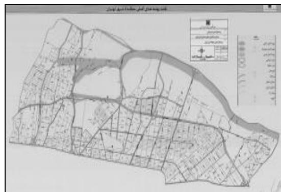
ت ۲. نقشه پهنه‌بندی گسل‌های منطقه ۴ شهر تهران.

تابستانی متمولین بوده و روستاهای سوهانک، ازگل، اراج، گلستان، مبارک‌آباد و اطراف باغ هروری از چنین ساخت و بافتی برخوردار بوده است. کانون‌های سکونتی اولیه در این منطقه، در محدوده‌های نارمک شمالی و تهران پارس در دهه ۴۵-۳۵ شکل گرفت و به تدریج توسعه یافت و طی سال‌های ۱۳۳۰ تا ۱۳۵۰ بافت‌های مدرن در نارمک و تهران پارس و به موازات آن کارگاه‌های صنعتی و کارخانه‌های واقع در شرق منطقه به شکل گسترده پهنه صنعتی به وجود آمد. از سال ۵۶ به بعد محدوده ورودی شرقی تهران در منطقه ۴ محل استقرار جمعیت مهاجر از دیگر شهرها و روستاهای کشور قرار گرفت و به تدریج بافت‌های روستایی و حاشیه‌ای محله‌های خاک سفید، شمیران نو، کاظم‌آباد در این منطقه شکل گرفت (وزارت راه و شهرسازی، ۱۳۹۷). منطقه ۴ تهران به جهت نزدیکی به گسل‌های مؤثر در آسیب‌پذیری شهر تهران از جمله گسل مشاء، گسل شمال تهران و همچنین تاسی گسل‌هایی در داخل و پیرامون منطقه از جمله گسل شیان، کوثر، ده نارمک، پارچین، تلو پایین، بروز خطر زمین‌لرزه را در این منطقه تشدید می‌نماید (تصویر شماره ۲).