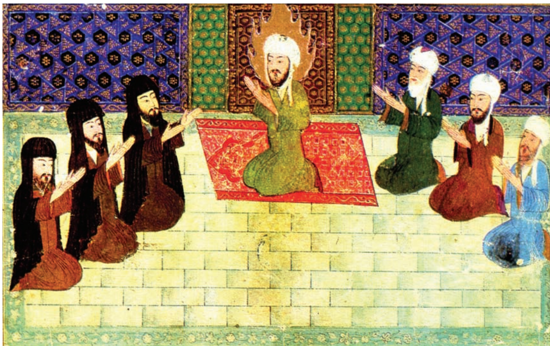
تصویر ۸- نیایش، معراج نامه میر حیدر، کتابخانه ملی پاریس

محمد، نمونه تیموری (وسایر آثار در مرحله پیشین مکتب هرات) فضای غیرواقعی و انتزاعی تری را به نمایش می‌گذارد و با این که اغلب نگاره های این دوره «از نظر ترکیب بندی و کاربست رنگ های باشکوه در حد عالی قرار دارد ولی بیننده نمی تواند از نظر مادی و عاطفی با آن ها ارتباط برقرار کند» (آژند، ۱۳۸۷، ۱۳۱). این دوری از واقعیت بعدها از ویژگی های نگارگری ایرانی محسوب شده و در عناصر انسانی و حیوانی به کار رفت. «نا واقعیت تصویر اسب در رنگ آبی آن است، اما نا واقعیت تصویر انسان در کوچک بودن و بی مهارتی و بی نرمشی عروسک وار آن است که به جهان قصه مربوط می شود» (اسحاق پور، ۱۳۷۹، ۳۲). این عامل از عدم توجه و پرداخت زیاد به چهره ها نیز مشهود است زیرا «جلال و وزن بیش تر دادن به چهره های انسانی تأکیدی بر رابطه علی، حضور و مساله ایجاد شباهت می بود» (همان، ۳۳) که ویژگی غیر واقعی و انتزاعی بودن را از آثار می گرفت.