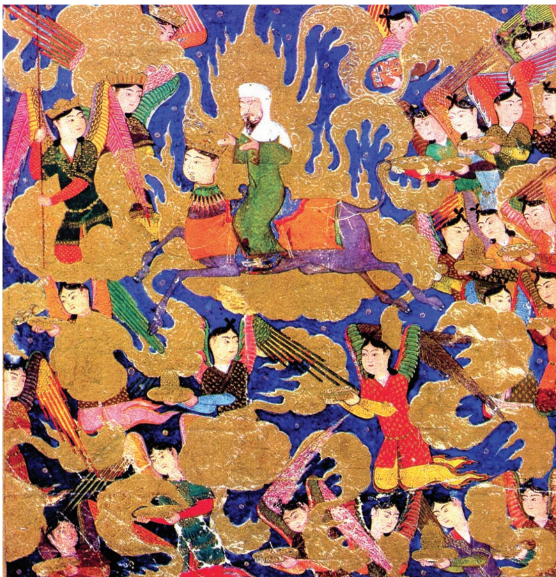
تصویر ۲- در راه اورشلیم، معراج نامه میرحیدر، سده ۹ هجری قمری

از فرشتگان مقرب الهی) به سوی اورشلیم حرکت می کند. (تصویر ۲)