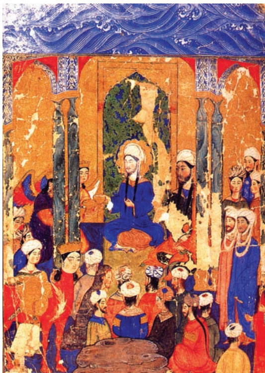
تصویر ۶- اهدا پیاله ها به حضرت محمد(ص)، معراج نامه احمد موسی، موزه توپقایی سرای، استانبول

پس می توان گفت یکی از ویژگی های ترکیب بندی در نگاره های ایلخانی، ایجاد فضاهای باز با چینش آدم های بسیار و تحت نظام نامتقارن است. این عامل «با قرار دادن یک اندام در انتهای سمت راست یا چپ قسمت جلو که گاهی پشت به بیننده و گاه نیز به طرف جلو می آید، عملی شود» (گری، ۱۳۸۵، ۳۴) پیکره های حاشیه تصویر با قاب اثر طوری قطع می شود که نگاه آن ها رو به داخل باشد. این ویژگی می تواند نشان از فضا سازی غیر عینی و مغایر با جهان واقعیت و نوعی گریز از محدودیت های قاب بندی تلقی شود. به نظر کنبی، این «اندام چسبیده به لبه قاب، بیش از هر تاثیر خارجی دیگری، ساختار نگاره های سنتی ایران را در ذهن زنده می کند» (کنبی، ۱۳۷۸، ۳۴) (تصویر ۶ و ۷) یکی دیگر از نشانه های نادیده انگاشتن محدودیت های قاب بندی و دستیابی به فضایی نوین در این دوره، خارج کردن بخشی از عناصر تصویر از چارچوب قاب است که «نشانه قدرت کامل و آزادی قاعده مند بینش در ارتباط با قراردادهای شبیه سازی است که تصویر همراه با متن کتاب، با آن سروکاری ندارد» (اسحاق پور، ۱۳۷۹، ۱۴) این ویژگی در اغلب آثار دوره ایلخانی به چشم می خورد. اما در نگاره های معراج نامه میر حیدر با جرات