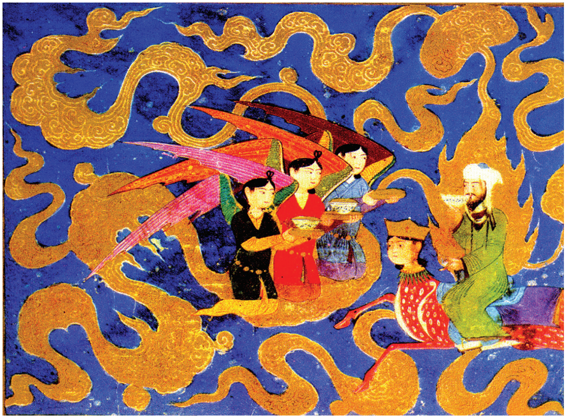
تصویر ۷- سه پیاله از نور، معراج نامه میرحیدر، کتابخانه ملی پاریس، ماخذ: سگای، ۱۳۸۵، ۱۰۰

بینی کرده بود. (Sims, 2002, 147) (تصویر ۱۱) پیکر پیامبر(ص) در سمت چپ با ابرهای طلایی رنگی احاطه شده و دو نفری که در مقابل ایشان نشسته اند، با توجه به شکل عمامه شان همچون اعراب به نظر می رسند. اغلب ویژگی های ساختاری در ترکیب بندی تصویر ۶، همچون چینش پیکره ها، وجود دو پیکره چسبیده به قاب، ایجاد عمق نمایی با تکرار صورت هایی که به جوانب گوناگون نظاره گرند و... در این جا هم مراعات شده اند. اما برخلاف دو تصویر قبلی، در این جا بخشی از آسمان آبی، هم مرز با افقی بلند به نمایش درآمده که با تک بوته های کوچک و بزرگ پوشیده شده است. این «افق های بلند، زمینه گل و گیاهی افشانده و پراکنده، و اشکال کوچک تر تصاویر، ویژگی های جدیدی است که بعدها سبک جلایری را ممتاز ساخت». (بلر، ۱۳۸۵، ۴۲) و با کوچ اجباری هنرمندان دربار جلایری از تبریز به هرات (توسط بایسنقر میرزا)، این ویژگی ها در مکتب هرات نیز تداوم یافت و در آثار این دوره حالت پرده ای را به خود گرفت که عناصر انسانی و نباتی در جلوی آن به تصویر در می آیند.