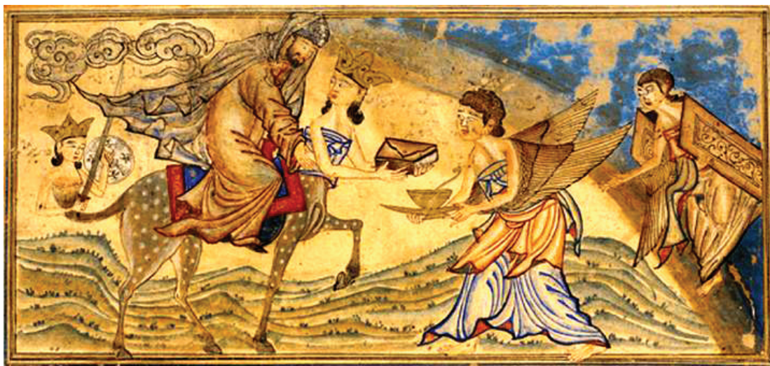
تصویر ۴- معراج پیامبر، جامع التواریخ، تبریز ۷۱۴ هجری قمری، کتابخانه دانشگاه ادینبورگ

لذا بهره مندی از خطوط کناره (نمابه عنوان مثال) در جامه ها می تواند به خوبی فقدان سایه پردازی را جبران نماید. «چنین به نظر می رسد که هنرمند نگارگر به همین خرسند بود که اثری تزیینی و زیبا که اشکال آن به یکدیگر مرتبط باشند بیافریند و آن را با جامه ای دلربا و سرپوشی چشم نواز بیاراید... و مهارت خود را در طرحی این جامه ها نمایان سازد» (همان، ۸۵)