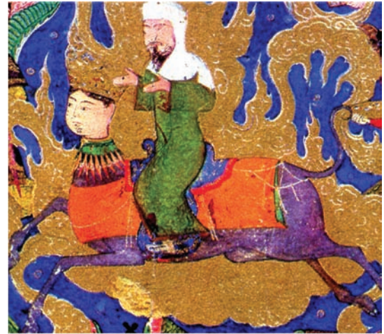
تصویر ۵الف- مقایسه ویژگی حرکت در معراج نامه میرحیدر

در صحنه غایب است مگر این که پیکره بزرگی را که در کنار پیامبر (ص) نشسته، جبرائیل بدانیم اما جبرئیل که فرشته مقرب الهی است در تمام صحنه های معراج همواره تاج بر سر دارد و بر خلاف این صحنه، هیچ وقت عمامه نداشته است. (Sims, 2002, 148) از این نظر نگاره فوق جزء نمونه های بسیار نادر خواهد بود. حتی براق که در سمت چپ پیش زمینه به در مسجد بسته شده و گویی از پای راستش نقشی همچون زبانه آتش سر می کشد، با آن بدن قرمز روشن، صورت رنگ پریده و گوش های سبز بزرگش غیرطبیعی و به نظر غریبه می آید. البته در نگارگری ایرانی، جانور «اگر سبز، آبی یا زرد باشد مانعی ندارد، اما انسان آبی یا سبز، بی درنگ همچون هیولا یا موجودی فوق طبیعی تلقی می شود». (اسحاق پور، ۱۳۷۹، ۴۵)