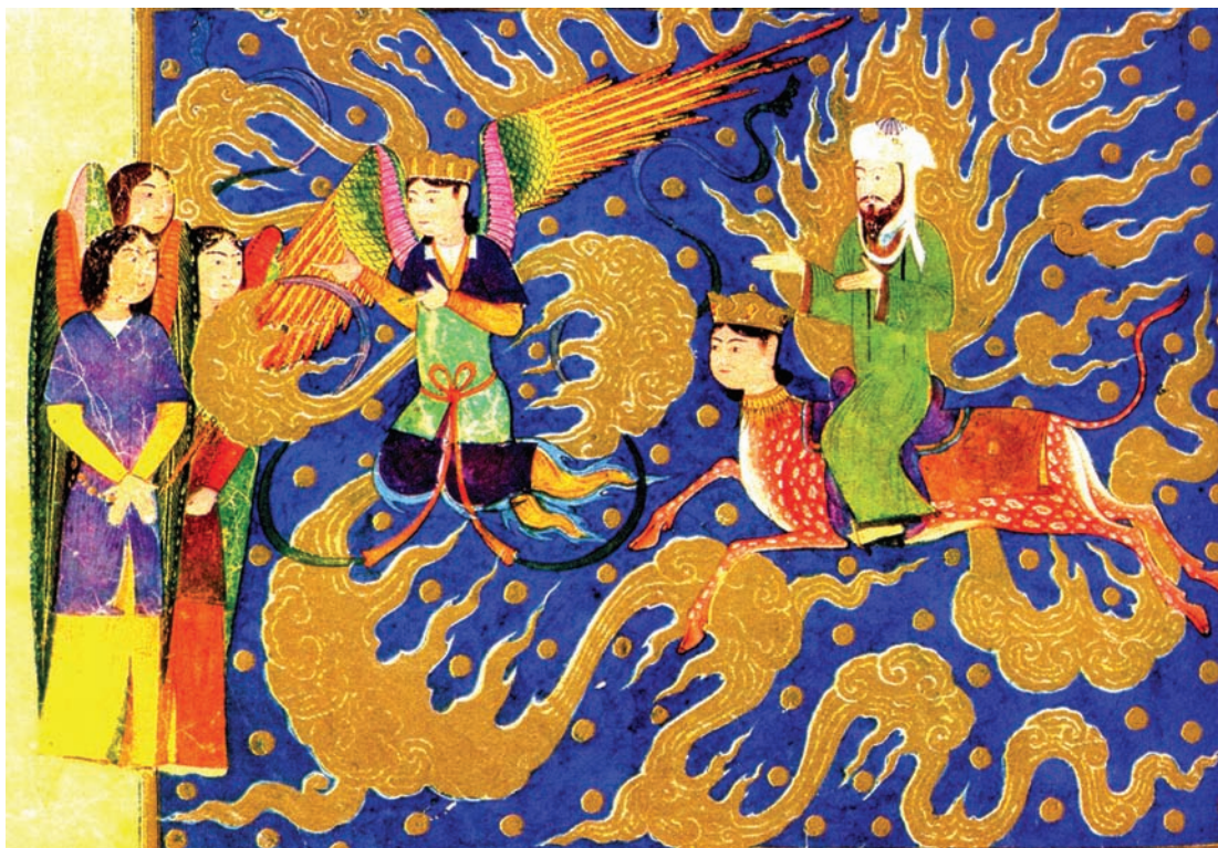
تصویر ۱۰- ورود به آسمان ششم، معراج نامه میرحیدر، نمایش خروج عناصر