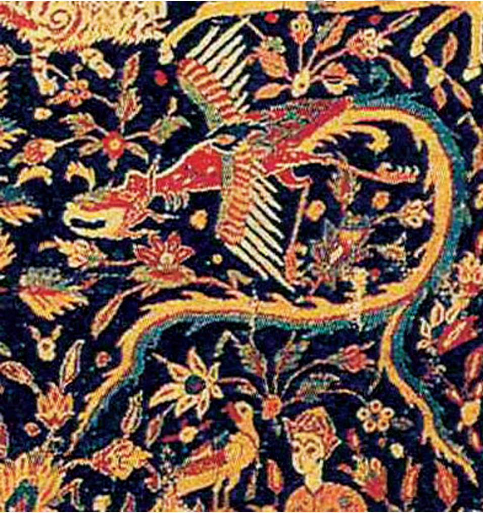
نقشمایه سیمرغ در فرش صفویه