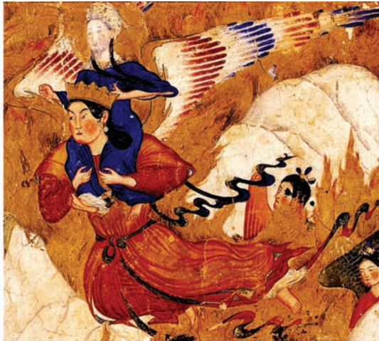
تصویر ۵ب- مقایسه ویژگی حرکت در معراج نامه احمد موسی