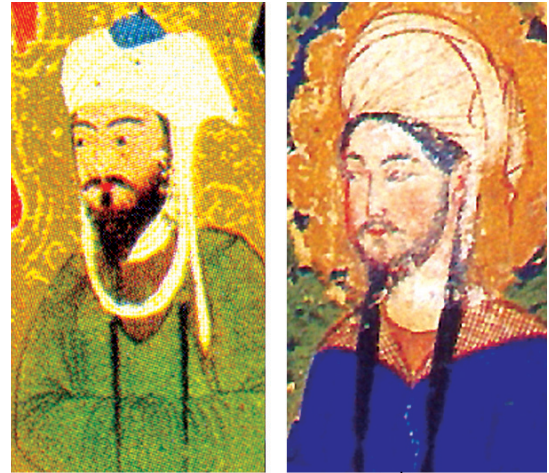
تصویر ۳- الف، مشابهت چهره نگاری پیامبر (ص) در معراج نامه احمد موسی تصویر ۳- ب، مشابهت چهره نگاری پیامبر (ص) در معراج نامه میرحیدر

دشمن بزرگ چنگیز خان، سوار بر اسب خاکستری به آسمان رفته است». (همان، ۲۰) با این‌که در نقاشی‌های معراج، پیامبر (ص) همواره سوار بر براق به آسمان‌ها عروج می‌کند اما تفاسیر مذهبی مسلمانان، «صعود پیامبر (ص) را از پله‌های نردبانی نورانی که از معبدی در اورشلیم به بهشت برپاشده، نشان می‌دهد». (همان) در تصاویر معراج نامه احمد موسی، پیامبر با هاله‌ای دایره‌ای به دور سر، از اشخاص دیگر متمایز گشته که نمونه‌های اولیه آن در آثار مانویان به کار می‌رفت و در دوره سلجوقی نیز به دور سر اغلب افراد دیده می‌شود. این هاله دایره‌ای «نشانه عظمت و قدرت بوده و نه تنها در نقاشی‌های آغازین اسلامی بلکه در تصاویر سفالینه‌ها، نقوش برن‌ها و شیشه‌ها و حتی بر روی پارچه‌ها بر اقتدار فرد تاکید داشتند» (Kuhnel, 1924, 7)