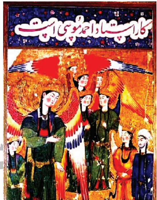
تصویر ۹- نمایش استقرار پیکره ها در قاب اثر، معراج نامه احمد موسی، ماخذ: سگای، ۱۳۸۵، ۶۹

یکی دیگر از نشانه های تاثیرات غیر ایرانی در تصاویر دوزخیان دیده می شود که ظاهراً «از هنر آسیای مرکزی و چین نشأت گرفته و در تصویر سازی سنتی اسلامی نمونه های آن بسیار نادر است» (Sims, 2002, 150) این گونه توصیفات تکان دهنده «در نسخ خطی خاور دور، بسیار دیده می شود که مشهورترین آن ها نسخه های متنوع سوترا، ده پادشاه به زبان های ژاپنی و چینی است که بر اوراق طوماری تذهیب شده، موجود می باشد» (سگای، ۱۳۸۵، ۲۱) بلر ضمن تایید غیر ایرانی بودن ریشه های این نوع توصیف معتقد است «هنرمند برای آفرینش این تمثال های تکان دهنده