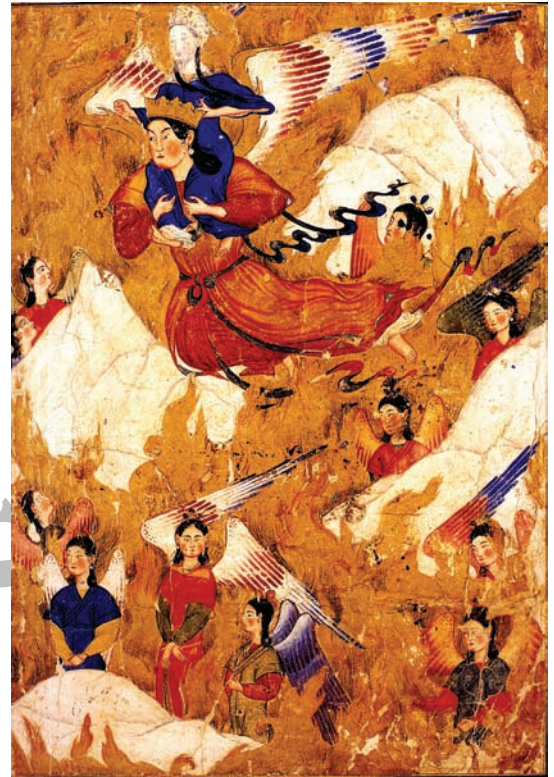
تصویر ۱- الف، حمل پیامبر (ص) بر روی شانه‌های جبرئیل، معراج نامه احمد موسی سده ۸ هجری قمری. موزه توپقاپی سرای، استانبول

عجیب الخلقه ای سوار شد (که... ظاهری شبیه به قاطر یا اسب، چهره ای زنانه و پاهایی شبیه به شتر، افساری از جنس مروارید، زینتی از زمرد و رکابی فیروزه ای داشت). (سگای، ۱۳۸۵، ۳۵) اما در این نگاره اثری از حیوان عجیب الخلقه نیست و فرشته ای بزرگ با بال‌های رنگین و تاجی بر سر پیامبر (ص) را حمل می‌کند، تجسمی بی نظیر که در هیچ یک از صحنه‌های معراج در دوره‌های مختلف دیده نمی‌شود. بینیون معتقد است «وجود این فرشته‌های بالدار یادآور عناصر قدیمی تر ایرانی در دوره ساسانی است». (بینیون، ۱۳۸۳، ۱۰۶) کمر بند سرخ و سبز جبرئیل و رشته‌های بلند و سیاه موهای او به صورت موج در حرکت بوده و سرعت پرواز را نشان می‌دهد که در نمونه‌های ساسانی در نقش برجسته شاپور در نقش رستم نیز دیده می‌شود. در تصویر ۱- الف، آسمان و زمین اطراف پیکره‌ها مملو از شعله‌های طلایی است و از میان آن‌ها کوه‌های مخروطی شکل سفید رنگی سر بر آورده اند که هیچ شباهتی به کوه‌های مغولی برگرفته از چین ندارند. فرشته‌های کوچک تری نیز به جای پرواز در کنار جبرئیل و حضرت محمد (ص)، در کنار قله کوه‌ها ایستاده و با احترام پرواز آن‌ها را نظاره می‌کنند.