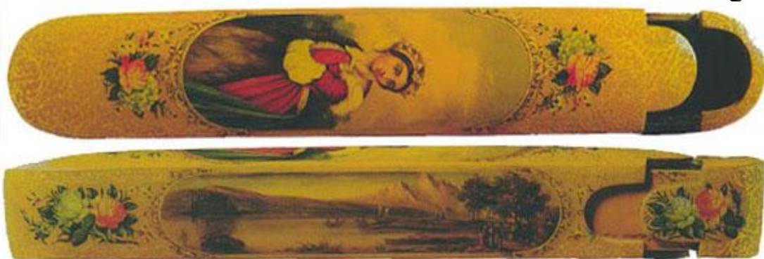
تصویری 17-نمپی روی کناری قلمدان، احتمالاً کار لطف الله لاجم زوی بدوررقم، شریراز، اواخر سده 13 هـ/ 19م، مجموع وکتخلیلی، لنین، کارهای لاک، 392 1. قلمدانهای که صرفاً منظره کارشماست، مانند قلمدان های شماره 15، 16، 17، 18 و 24.

در صورت بقلمدان سازی قلمدان نگاری در دوران قاجار نگاهویژه لی شد و طرفداران بی شماری پیدا کردند و مندان برجسته ای بوده اند که به طور اختصای فقط قلمدان نگاری می کردند بیوقی هنرمندان نیز به نوعی ساختن و پرداختن قلمدان مشا رکت می کردند به طوری که بعضی از هنرمندان کاوگیا کارخانه قلمدان سازی داشتند. در دوران قاجار نیز منندان دهنوی فویه منظرپردانی دارای جنبه حاجتطلبی بود که عبارتند از: