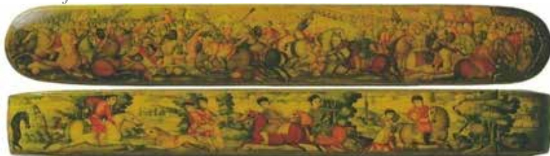
تصویر 26-نظری روی کناری قل‌منا، احت‌مالاکم‌یرزا باباویزدرقم، ایران، اوایل سده 13 هـ/19م، مجموع‌طی‌لی، لندن، کاره‌ای لکی، 247