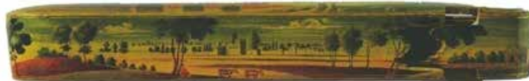
تصویر 24-ن‌م‌لی رویو کن‌ای قلم‌دل، کار محمود خ‌ل‌مل‌کن‌ل‌ع‌راء، بارق‌م‌ب‌ه‌ن‌د‌در‌گ‌اه محمود» احتمالات‌ه‌ران، 1300 هـ/1882م، مجموعه کتبخانی، لندن، کارهای لاک‌ی، 347