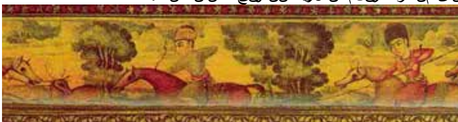
بخشی از تصویر 27-نگ قسمت‌چین‌ه‌نوع طراحی و رنگ‌لمی‌زیدرخ‌توان‌ترکیب بنی من‌ظره درقل‌مدان 26 صن‌دوق‌چکسان است.