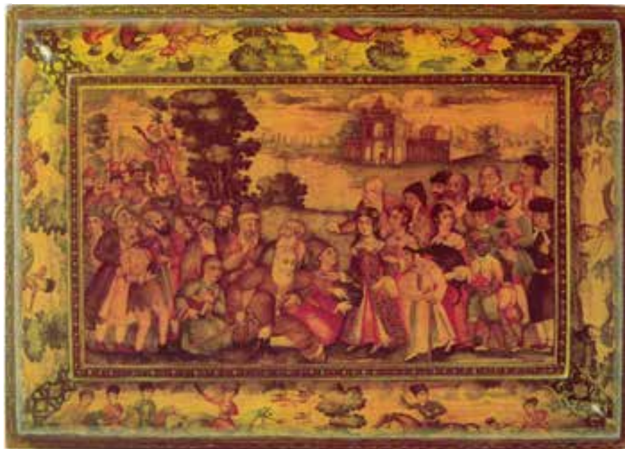
تصویری 27-نمای روی دوصندوقچه میون رقم، ایران، 184 تا 1194 هـ/ 170 تا 1180 م، مجموع نگارگری، لندن، کارهای لاک، 94