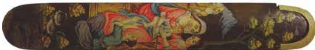
تصویر 25-ن‌م‌ای روی قلم‌دان، احکمال‌ان‌ج‌ف‌ع‌لی‌و‌ب‌ن‌د‌رق‌م، ایران، ن‌ی‌م‌ه‌ دوم‌س‌ده 13 هـ/19م، مجموعه کتبخانی، لندن کارهای لاک‌ی، 218

ن‌م‌ون‌ه‌بارز‌لی‌ن‌م‌وض‌وع‌ب‌راق‌ط‌ب‌ی‌ق، قلم‌دان‌ید‌ر‌ او‌ای‌ل‌س‌ده 13 هـ/19م، احتمالات‌ان‌ش‌ر م‌یرز‌اب‌اب‌ت‌ک‌س‌و‌ی‌ر 26 ص‌ن‌د‌وق‌چ‌ه‌ ای‌ب‌ون‌رق‌م‌ درس‌ال