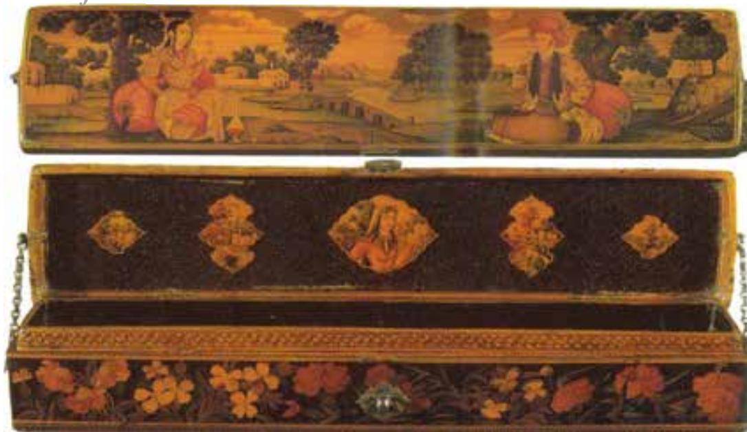
تصویری قلمدان، کار مینوعالی ابن محمد زمان، اصفهان، سنه 1112 هـ/ 1700 م، موزه آرمیتاژین پترزبورگ، جلد دو قلمدانهای ایرانین گارگری، جلد دوم، 94