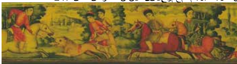
بخشی از تصویر 26-نگ قسمت‌چین‌ه‌نوع طراحی و رنگ‌لمی‌زیدرخ‌توان‌ترکیب بنی من‌ظره درقل‌مدان 26 صن‌دوق‌چکسان است.