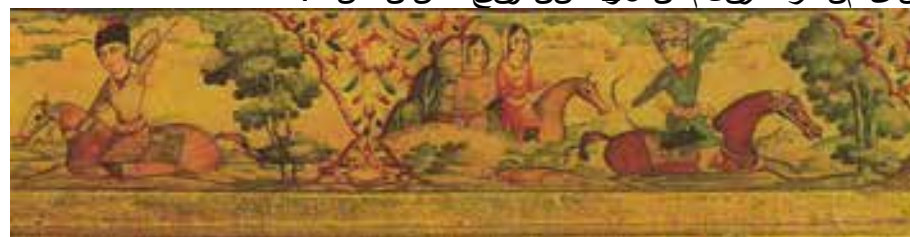
بخشی از تصویر 28-نگ قسمت‌چین‌ه‌نوع طراحی و رنگ‌لمی‌زیدرخ‌توان‌ترکیب بنی من‌ظره درقل‌مدان 26 صن‌دوق‌چکسان است.