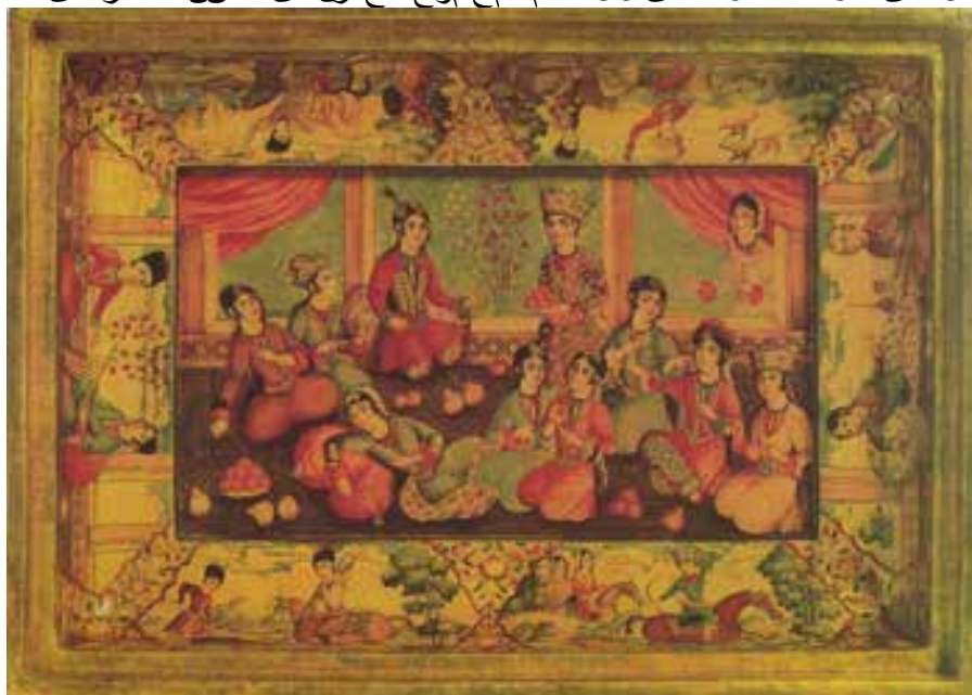
تصویری 28-نمای داخل دوصندوقچه میون رقم، ایران، 184 تا 1194 هـ/ 170 تا 1180 م، مجموع نگارگری، لندن، کارهای لاک، 95. و روش محدودی شوی که حتی دیگر خود منظره ها هم و پس از آن به طبیعت تاریک باروک با کلبه هوی و یو ای یک بزای پس زمین ه متسلط رن گق موه ای کو لو است فاده از رن گسوز در درختان در منظرین دوره حایز اهمیت است. یکنمون هق ای بی ننه درب دار کها احتمالا در سال 1314 هـ/ 1896 م در مش ه دس اجت مشیت مصوی ر 29 رقم یکمین اقل ال حاج میرزا محم بلق ر هب نقاش شیلی استل قدس «ر لر بر دارق ابی اپی چک های طوماری بس بک و ک کو بر وجه لخل ی درب تسی شده، ظاهر تمامین قاشی کاملا اروپای است.» همان، 346 (واضحه است ایگونه منظره بودازی بس بک رکو کو در آن دور مورد توجه بلوست. البته منظره تا حی سعی داشت توی ژگی هلی شخصیت و بومی