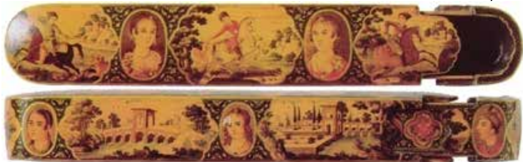
تصویری 12- روی مپوهلوی قلمان، ارکم ی رزا بابلبا رقم «وقع کتبرین مینا بابا» ایران سنه 1209 هـ/1794 م، مجموع طپی، لن، کاره ای لکی، 93