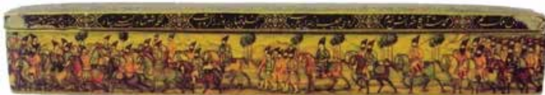
تصویر 23-وجه جان بی‌قلم‌ان، کار محمد مسلم‌اعلی‌الاص‌ف‌ف‌ا، سن 1266 هـ/1849م، مجموعه کتبخانی، لندن، کارهای لاک‌ی، 244