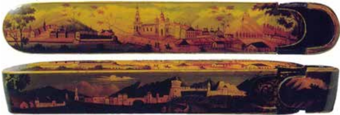
تصویری 16-نمپی رویو کناری قلمدان، کار مصفا شیریازی، با رقم یوقه کتبرین مصطفی «»، سال 1307 هـ/ 1889م، شریراز، مجموع وکتخلیلی، لنین، کارهای لاک، 394

در صورت بقلمدان سازی قلمدان نگاری در دوران قاجار نگاهویژه لی شد و طرفداران بی شماری پیدا کردند و مندان برجسته ای بوده اند که به طور اختصای فقط قلمدان نگاری می کردند بیوقی هنرمندان نیز به نوعی ساختن و پرداختن قلمدان مشا رکت می کردند به طوری که بعضی از هنرمندان کاوگیا کارخانه قلمدان سازی داشتند. در دوران قاجار نیز منندان دهنوی فویه منظرپردانی دارای جنبه حاجتطلبی بود که عبارتند از: