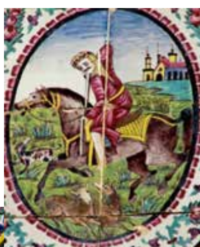
تصویر ۴۴ - مردی بالباس عربی، در حال شکار با پس زمینه منظره ساختمانی، حلالی پشت