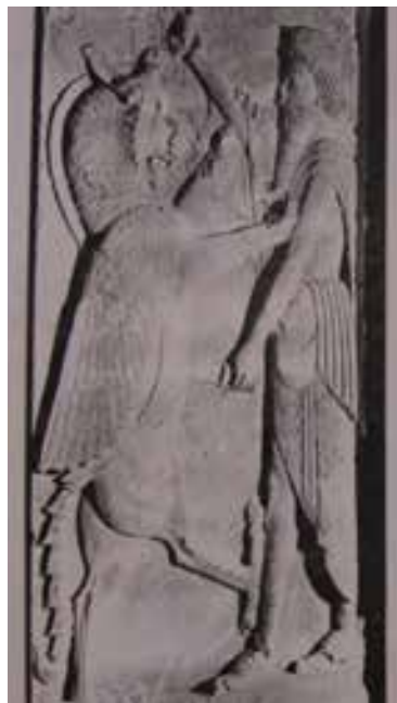
تصویر ۴ - نقش برجسته تخت جمشید، دوره هخامنش