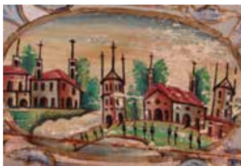
تصویر ۴۲ - تالار اصلی باغ ارم، نقاشی روی چوب