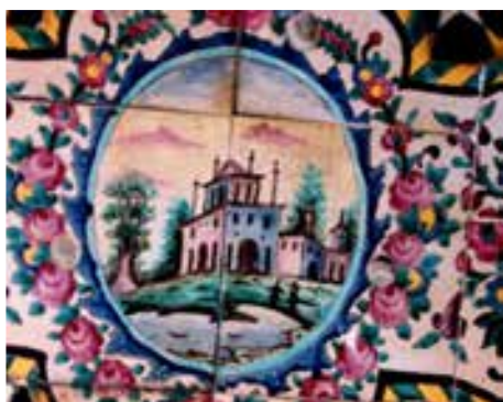
تصویر ۴۱ - مناظر ساختمانی در دوردست، کاشی هفت رنگ. استراحتگاه تابستانه باغ ارم

میدان به شیوه واقعی از ویژگی های متاثر از هنر نقاشی اروپایی است. در بعضی از نقاشی ها هنرمند گویی سعی در انتقال پیامی مشخص، در زمانی معین داشته است. (تصویر ۴۵) در تصویر ۴۶، دو زن که احتمالاً از زنان درباری هستند، مشغول تفرج در باغ و چیدن میوه می‌باشند. این اثر در حیاط پشت امارت اصلی باغ ارم قرار دارد و به روش کاشی هفت رنگ نقاشی شده است. تصویر دیگری که دورنمای یک روستا را هنگام غروب به نمایش گذاشته (تصویر ۴۴) نگاهی کاملاً واقع بینانه و طبیعت‌گرایانه دارد و در نوع خود بی نظیر است.