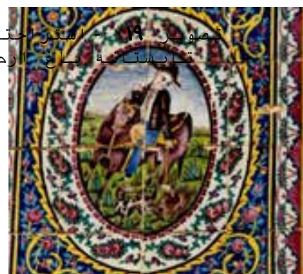
تصویر ۱۸ - شکار چیان در حال انکار بخشی از سویز باغ ارم هلالی است عمارت اصلی، روبه سمت غرب