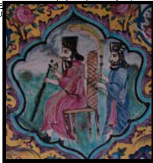
تصویر ۹- نقاشی دیواری، کاشی هفت رنگ باغ ارم شیراز، برگرفته از نقش برجسته های تخت جمشید