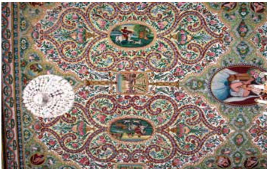
تصویر ۳۵ - سقف تالار اصلی باغ ارم، نقاشی رنگ و روغن روی چوب

نقوش اسلیمی گاه در یک سقف نقش مایه ای شبیه به نقش فرش را القا می‌کند که تمام متن کار را پوشانده و چنانچه نقوش دیگری در آن سطح وجود داشته باشد به تبعیت از نقوش اسلیمی است که در داخل سطح قرار گرفته اند. (تصویر ۳۵) گاه نقوش اسلیمی با حرکت و پیچش خود در امتداد کناره‌ها و حاشیه‌های یک نقش تشکیل قاب‌های بسیار زیبایی می‌دهد که نقش گیاهی و انسانی و حیوانی را در خود نگاه داشته است. (تصویر ۳۶) نقوش اسلیمی گاه با حرکت و گردش متقارن خود گلدانی را به وجود آورده که این گلدان با نقوش گیاهی طبیعی و یا تزیینی پر شده است. (تصویر ۳۷)