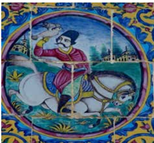
تصویر ۱۵- شاهزاده ای با باز شکاری، کاشی هفت رنگ، باغ ارم

شکارچیان اغلب با سلاح های گرم (تفنگ) و با لباس های محلّی (فارس) در حالت های متنوع مشغول شکار هستند. لباس های غیر ایرانی (هندی، عربی) بر تن شکارچیان دیده می شود که حاکی از روابط سیاسی و فرهنگی بین دیگر کشورها در دوران قاجار است که این تصاویر علاوه بر این که گویای تاثیر پذیری از نقاشان غربی است. (تصویر ۲۱) همچنین مهمان دوستی مردم فارس را نیز نشان می دهد.