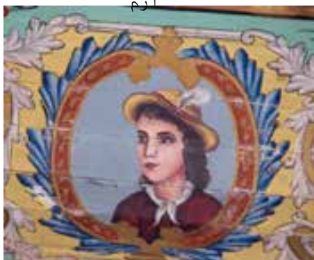
تصویر ۳۱ - تالار اصلی باغ ارم، نقاشی رنگ و روغن روی چوب