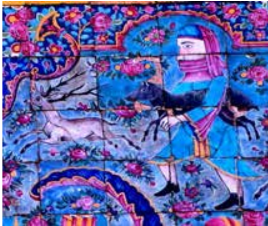
تصویر ۷- صحنه هایی از نقاشی دیواری در باغ ارم، برگرفته از نقش برجسته هخامنشی با توجه به نوع پوشش آن‌ها. هلالی پشت عمارت اصلی باغ ارم