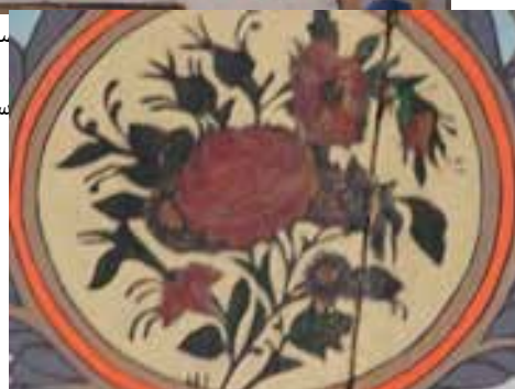
تصویر ۳۴ - نقاشی رنگ و روغن روی چوب اتاق های امارت باغ ارم