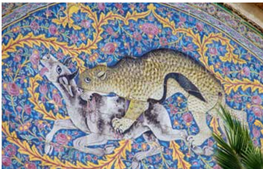
تصویر ۲ - باغ ارم، نقاشی روی کاشی

تصویر ۲، صحنه گرفت و گیر (جدال بین خیر و شر) را نشان می‌دهد. این تصویر که بر سنتوری عمارت باغ ارم و به صورت قرینه در دو طرف پیشانی عمارت قرار گرفته صحنه جدال بین ببر و گاو را به تصویر کشیده و نقوش زمینه نیز به گونه ای بیانگر این جدال و برتری یکی بر دیگری است. تسلط و برتری نقوش اسلیمی درشت بارنگ زرد و سبز بر زمینه نقوش گیاهی و گل های ظریف و ریز زمینه غلبه ببر را تداعی می کند. نقاشی دیگری که به شیوه کاشی هفت رنگ، برهلالی پشت عمارت اصلی تصویر شده نبرد انسانی (سرباز، یا پادشاه هخامنشی) نماد خیر با حیوان ترکیبی، نماد شر (اهریمن) را نشان می‌دهد. (تصویر ۳ این تصویر نیز برگرفته از نقوش برجسته هخامنشی است و تعلق خاطر نقاش به اساطیر و وفاداری او را به تصویر ماخذ را به خوبی نشان می‌دهد. (تصویر ۴) در این نقش برجسته تصویر انسانی را می بینیم که با حیوان ترکیبی با تنه شیر و دم عقرب بال و پای عقاب و سر گاو در حال نبرد است.