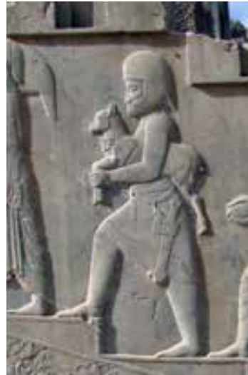
تصویر ۸ - نقش برجسته هخامنشی