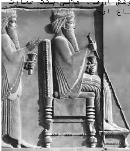
تصویر ۱۱- نقش برجسته هخامنشی از یک پادشاه، نقش برجسته هخامنشی