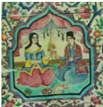
تصویر ۲۹ - دو دلداه با لباس قاجاری در اتاق با پرده های قرمز رنگ، استراحتگاه تابستانه، باغ ارم