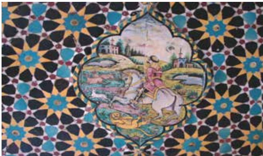
تصویر ۳۸- سقف امارت باغ ارم شیراز، نقش هندسی (گره چینی) و تلفیق آن با کاشی هفت رنگ ج- نقوش حیوانی و پرندگان

قالب مستطیل شکل دارد که روی آن‌ها نقوش گیاهی اسلیمی و موضوع‌های داستانی مشاهده می‌شود. (تصویر ۳۸) این نقاشی‌ها ترکیبی از نقاشی‌های روی کاشی هفت رنگ و گره چینی است که در عین زیبایی، تلفیق هنرمندانه دو روش نقاشی دیواری را نشان می‌دهند.