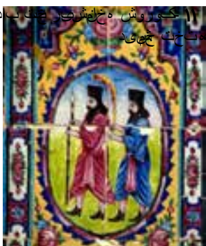
تصویر ۱۲- هلالی پشت عمارت اصلی باغ ارم