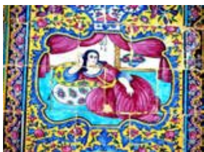
تصویر ۲۷ - دختر لمبیده، کاشی هفت رنگ،

تصاویر دو دلداده در کنار یکدیگر نیز در این مجموعه قرار دارد. پس زمینه این اثر فضای داخلی اتاقی با پنجره باز رو به بیرون است که از گوشه های بالا قاب، پرده ها به کنار زده شده اند. (تصویر ۲۹) نقاش با این ترفند، سعی در واقع نمایی و زیبایی اثر داشته است. غلبه رنگ قرمز در موضوعات نقاشی‌ها خودنمایی می‌کند. در این جا نیز تاثیر نقاشی غربی بر نقاشی های این باغ به چشم می‌خورد. این تاثیرات، هم از نظر شیوه اجرایی، کاربرد رنگ، سایه-پردازی ها و هم انتخاب موضوع (دختران فرنگی) و تقلید از نقاشی های اروپایی است. هنرمند گاه به منظور آسان نمودن کار تزیین به نصب اصل اعلان های نقاشی شده اروپایی بر زمینه کار و یکسان سازی آن اقدام نموده است. (تصاویر ۳۱، ۳۱)