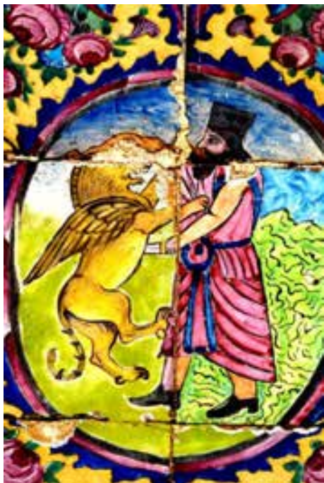
تصویر ۳ - نبرد خیر و شر، نقاشی دیواری، باغ ارم شیراز، هلالی اصلی پشت عمارت