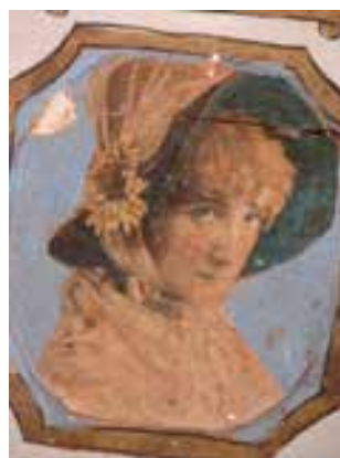
تصویر ۳۱ - تالار اصلی باغ ارم، اعلان (اروپایی) نصب شده بر روی زمینه نقاشی شده بر روی سقف چوبی