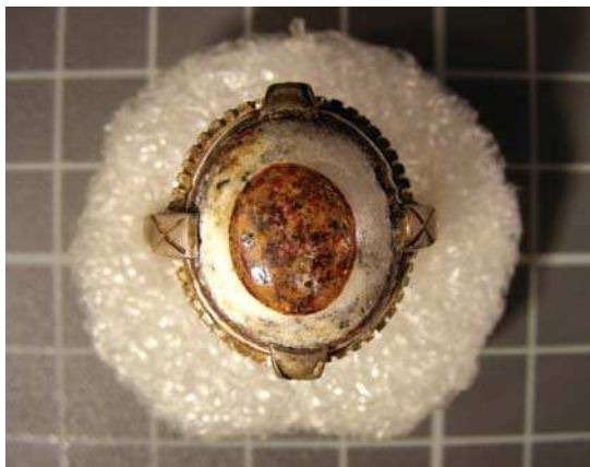
تصویر ۱. انگشتر با نگین باباقوری، دوره قاجار، مجموعه خصوصی دکتر محفوظی

انگشترهای نگین دار از مهمترین انواع انگشتری هستند. این انگشترها علاوه بر جنبه های تزیینی کارکردهای مختلف دیگری نیز دارند. شناخت کارکرد انگشترهای نگین دار از طریق مطالعه نوشته های روی آن ها میسر می شود. نقوش حک شده روی انگشترهای ایران در دوران باستان شامل تصاویر مختلفی از جمله نقوش انسانی و حیوانی بوده است، نقوشی که با ظهور دین مبین اسلام و تحریم تصویر به نوشته های حاوی عبارت ها و جملات دعایی تغییر پیدا کرد. در دوره های تاریخی بعد از اسلام، یکی از مهمترین و معتبرترین نمونه های استفاده از انگشترهای دارای نوشته مربوط به دوران قاجار است.