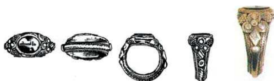
تصویر ۱۴. مهر انگشتی، ایران، ابتدای قرن ۱۳ هجری، نقره و سنگ عقیق سیاه، بر روی مهر سنگ کتیبه ای به سبک قدما مشتمل بر «علی الله» حک شده و مانند خود انگشتی مربوط به قرن ۱۳ هجری است. ارتفاع: ۲۹، پهنا: ۲۸، پهنای پایه نگین: ۱۵ م.م، ماخذ: همان ۱۶۹