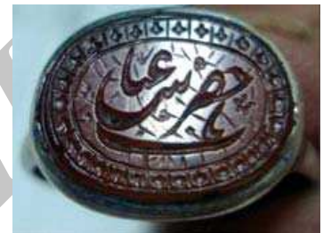
تصویر ۲۴. ذکر «یا حضرت عباس» بر نگین انگشتر، مجموعه خصوصی ویسی

ذکر دیگر قسمتی از دعای جوشن کبیر است با متن «یا مَنْ هُوَ مِنْ رَجَاءِ كَرِيمٍ» (تصویر ۱۷). دعای جوشن کبیر مخصوص شیعیان است که در شب‌های مخصوصی از جمله شب‌های پرفضیلت قدر خواندن آن سفارش شده است. خواص بی شماری برای این دعا ذکر کرده‌اند از جمله