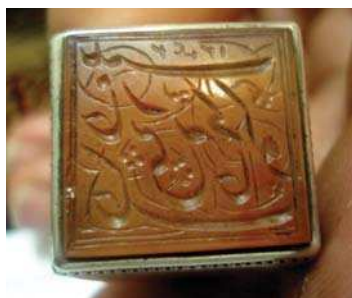
تصویر ۳۳. عبارت «خانم کوچک خانه نبی زینب» بر روی نگین انگشتر، مجموعه خصوصی ویسی