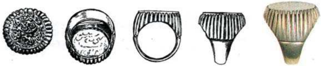
تصویر ۱۰. مهر انگشتری، ایران، ۱۳۲۲ هجری، نقره و عقیق سفید، مهر دایره شکل آن به سبک مهرهای تیموری است و حامل حکاکی «الهی به حق حسین شهید رضا مرتضی را مکن نا امید» ارتفاع: ۲۷، پهنا: ۲۴، پهنا پایه نگین: ۲۴ م.م. ماخذ: Wenzel, 1993: 17