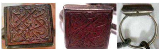
تصویر ۲. مهر انگشتری، قاجار، جنس: نقره و سنگ عقیق، در یک طرف نگین دان علامتی وجود دارد که نشان دهنده جهت استفاده صحیح از مهر انگشتری است. مهر آن به شکل مربع است که با خط ثلث بر آن عبارت «یا حسین ابن علی (ع)» حک شده است. مجموعه کاخ گلستان

دیگر آثار مورد بررسی توسط مشاهدات عینی نویسنده از مجموعه داران شخصی جمع آوری شده است.