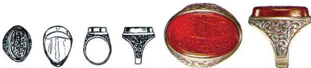
تصویر ۱۲. مهر انگشتی، ایران، قرن ۱۳ هجری، نقره و عقیق گلگون، مهر سنگ بیضی شکل مربوط به سال ۱۰۹۷ هجری است که کتیبه روی آن «روشن چشم به یوسف شود یعقوب ۱۰۹۷» می باشد. ارتفاع: ۲۸، پهنا: ۲۳، پهنای پایه نگین: ۲۷ م.م، ماخذ: همان ۱۷