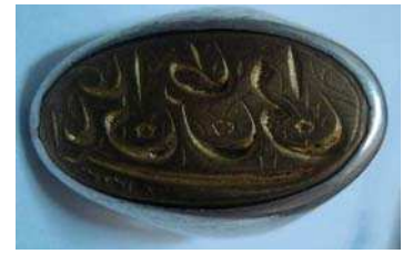
تصویر ۲۳. ذکر «یا علی بن ابی طالب» ۱(۲)۲۳ بر نگین انگشتر، مجموعه خصوصی ویسی