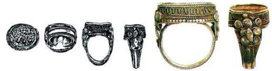
تصویر ۱۵. مهر انگشتر، ایران، ۱۲۴۹ هجری، نقره و سنگ عقیق گلگون، مهر بیضی شکل انگشتر روی یک سینی از ورقه نقره قرار دارد. بر روی سنگ عبارت «عبداله الراجی محمد باقر الحسینی ۱۲۴۹» یعنی بنده امیدوار... حک شده است. ارتفاع: ۲۹/۵، پهنا: ۲۷/۵، پهنای پایه نگین: ۱۸/۵، م، ماخذ: همان، ۱۶۹