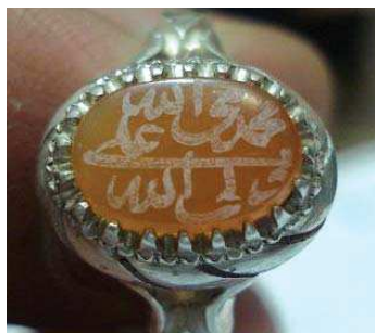
تصویر ۲۰. ذکر «محمد نبی الله علی ولی الله» بر روی نگین انگشتر، مجموعه خصوصی ویسی