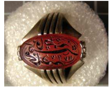
تصویر ۳۴. عبارت «کنیز فاطمه مخلصه ۱۱۷۹» بر روی نگین انگشتر، مجموعه خصوصی ویسی