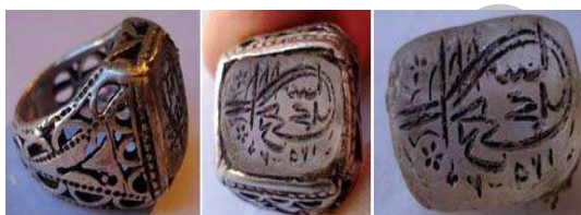
تصویر ۱۳. مهر انگشتی، ۱۲۹۲ هجری، جنس: نقره و عقیق سفید، انگشتی ریخته گری و مشبک کاری شده است. بر روی مهر عبارت «الراجی شاه محمد» به خط طغرا حکاکی شده است، مجموعه خصوصی

کشور ایران گذاشت. اصناف گسترده تر شد و به این علت نیاز به مهر و مهر انگشتی افزایش یافت. اقبال جامعه اعم از اشراف، اعیان، ملاکین و روحانیان گرفته تا تجار، آهنگر و بزاز و... به علت تحولات در سیستم اداری و اجتماعی و کارکرد کثیر مهر انگشتی برای فعالیت های اجتماعی و سیاسی و... صاحب مهر شدند. حتی بعضی از افراد به علت موقعیت و فعالیت های مختلف اجتماعی چندین مهر داشتند. بدین ترتیب، مهر یکی از ضروریات هر فردی به شمار می رفت. پولاک در این باره می نویسد: «مهر همه جا به جای امضا که مرسوم نیست به کار می رود و آن را با استفاده از نوعی جوهر به زیر اسناد می زنند و بدین طریق به اسناد قوت قانونی می بخشند. هرگاه مهر کسی مفقود شود وی اعلام می کند که از این پس از مهر دیگری استفاده خواهد کرد» (پولاک، ۱۳۶۸: ۳۱۹-۲۰).