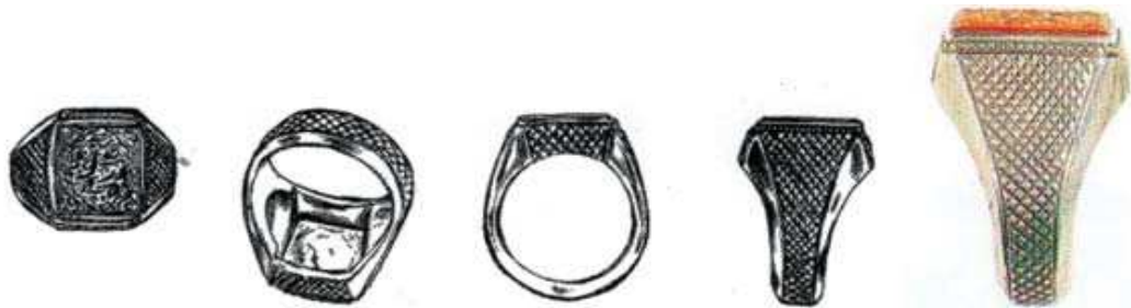
تصویر ۱۱. مهر انگشتری، ایران، ۱۲۶۴ ق، نقره، و سنگ عقیق، روی سنگ عبارت «خانه زاد ائمه نصرالله ۱۲۶۴» در مرکز و «نصر من الله و فتح قریب» در گوشه ها آمده است.

از حضرت امام موسی سؤال کردند به چه علت حضرت امیرالمؤمنین انگشتر در دست راست می‌کردند؟ فرمود: زیرا که آن حضرت پیشوای اصحاب یمین است که در قیامت نامه‌هایشان را به دست راست می‌دهند و حضرت رسول (ص) انگشتر را در دست راست می‌کردند و این علامتی است برای شیعیان ما که با این علامت ایشان را می‌شناسند. از حضرت صادق (ع) منقول است که حضرت رسول (ص) نهی فرمود از انگشتر کردن در انگشت شهادت و انگشت میان. از امام صادق (ع) نقل شده که انگشتر را به بند پایین انگشت برسانید (مجلسی، بی تا: ۱۵-۱۴)