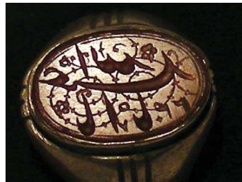
تصویر ۲۶. ذکر «یا ابا عبدالله ۲۴۷» بر نگین انگشتر، مجموعه خصوصی ویسی