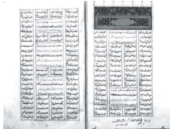
تصویر ۵. مجموعه نورالدین عبدالرحمن بن احمد جامی، کتابخانه آیت‌الله مرعشی نجفی، کد دستیابی: ۱۲۵۷۶

تا در رنگ بماند و سپس آن را در سایه خشک کن. اگر اول