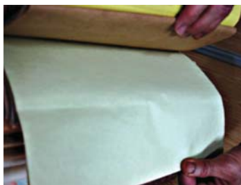
تصویر ۳. کاغذ رنگ‌شده با آب زعفران به شیوه سنتی. نمایشگاه بین‌المللی کتاب، غرفه آستان قدس رضوی، اردیبهشت ۱۳۸۸، مأخذ: همان.

کایت، ۱۳۷۳: ۶۶-۶۵). همچنین بسیاری از هنرمندان معاصر (از جمله رامین مرآتی و استاد ملکیان) به پیروی از هنرمندان پیشین از رنگ‌های طبیعی در خلق آثار هنری از جمله تذهیب و جلدسازی استفاده می‌کنند که از جمله این مواد زعفران است. به اعتقاد ایشان یکی از دلایل استفاده از زعفران این است که رنگ روحی محسوب می‌شود و پس از استعمال آن می‌توان سایر رنگ‌های استفاده‌شده در لایه‌های زیرین را مشاهده کرد.