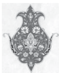
تصویر ۹. تذهیب، رامین مرآتی، ۱۳۹۰. مأخذ: همان

تصویر ۸. الف، ب و ج. تذهیب، رامین مرآتی، ۱۳۸۹. مأخذ: همان