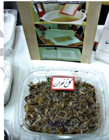
تصویر ۲. گل‌های خشک شده زعفران که پس از عصاره‌گیری برای رنگ کردن کاغذ استفاده می‌شوند. نمایشگاه بین‌المللی کتاب، غرفه آستان قدس رضوی، اردیبهشت ۱۳۸۸.

شناخت ترکیبات استفاده شده بهره برد. اما گام نخست در این مسیر مطالعه و بررسی کتابخانه‌ای است.