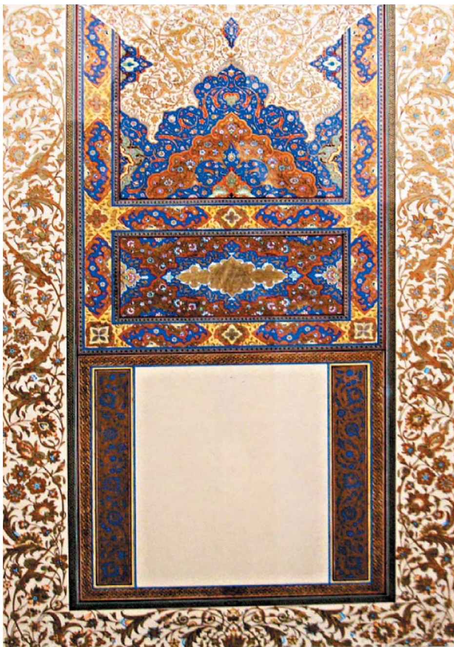
تذهیب، رامین مرآتی، ۱۳۸۹.