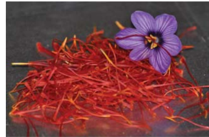
تصویر ۱. گل‌های زعفران مزروعی ( Crocus sativus L.); گل کامل و کلاله‌های جدا شده، مأخذ: www.cabanesatruffes.fr/nos-tarifs

در مواردی می‌توان با استفاده از بعضی ترکیبات رنگ شبیه طلا را ایجاد کرد. در این موارد (که تاکنون در کارهای واقعی قرون وسطی مشاهده نشده است)، مخلوطی از زرده تخم مرغ و جیوه تهیه می‌شود که به‌شدت زرد رنگ است. از تکان دادن جیوه در زرده تخم مرغ نوعی رنگ متالیک نقره‌ای رنگ ایجاد می‌شود که می‌توان آن را با کمی آب مخلوط کرد و برای نوشتن مورد استفاده قرار داد. در این مورد اگر زعفران یا صفره یا عصاره گیاه مامیران ۱ با آن مخلوط شود، رنگ طلایی حاصل می‌شود.