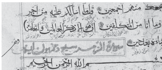
تصویر ۴. نام سوره و گل‌های فواصل آیات به زعفران، قرآن، کتابخانه آستان قدس رضوی. سده هفتم، کد دستیابی: ۱۲۸۸. همچنین در نسخه‌های خطی متعددی مشاهده شده است که از زعفران در صفحه‌آرایی از جمله جدول‌کشی‌ها و کتیبه‌ها استفاده شده است (تصویر ۵).

در یکی از کتاب‌های مانوی با نام توبه‌نامه (خواستوانیفت) مکشوف در خوچو، جدول‌کشی‌هایی به رنگ قرمز پررنگ یا قرمز مایل به زرد دیده می‌شود. همچنین برای رفع یکنواختی سطرهای مشکی‌رنگ با آوردن چند سطر به رنگ سرخ ارغوانی آن را زیباتر کرده‌اند (کلیم