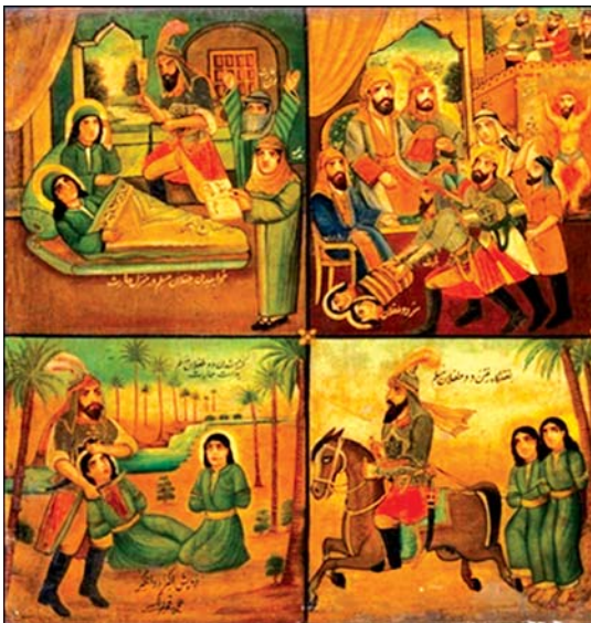
تصویر ۵. بخشی از تصویر ۳، اثر قوللر آقاسی

چرخه‌ای از داستان‌گویی به همراه نقال می‌شود. این همان چیزی است که قوللر آقاسی را وادار می‌کند در «غلط‌سازی» هنگام کشیدن تابلوهایش اصرار بورزد و با سماجت از طبیعت‌سازی پرهیز کند. به نظر می‌رسد این موضوع باعث باورپذیری بیشتر در مخاطب می‌گردد و امر قدسی را در فاصله معینی با مخاطب و متن قرار می‌دهد، همان اعتقادی که در باور دینی برای حفظ جایگاه امر مقدس و دینی وجود دارد. در هنر اسلامی هیچ‌گاه موجودیت اشیا را به اعتبار خودشان طرح نمی‌کنند و هرگز نمایشگر عالم مجرد صرف هم نیست. اساسا هنرهای دینی در یک امر مشترک هستند و آن جنبه سمبلیک آنهاست، زیرا در همه آنها جهان سایه حقیقتی متعالی از آن است. از اینجا در هنرها هرگز قید به طبیعت که در مرتبه سایه است وجود ندارد (مددیور، ۱۳۸۴: ۱۰). این امر باعث ایجاد ادراکی شهودی در مخاطب و به همان نسبت در دید هنرمند می‌شود و در نتیجه منجر به کشف حقیقت می‌گردد. اهمیت دادن به کل فضا نیز از دیگر خصوصیات این نوع نقاشی است.