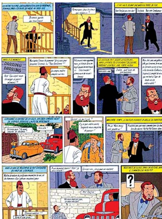
تصویر ۷. بخشی از مجموعه تن‌تن و میلو. داستان مصور سیگارهای فرعون.

در تصویر ۴ با گونه دیگری از همین نوع تقسیم‌بندی روبه‌رو هستیم. در نوع تقسیم‌بندی نقاش حرکت حلزونی را در روایت داستانش انتخاب کرده است. اما در همین تصویر نیز می‌بینیم که توالی داستانی و هم‌زمانی چند رویداد مختلف در یک زمان به وجود آمده است. صحنه اصلی و وسط این پرده اوج داستان و بخشی از میانه داستان است که با توجه به شماره‌گذاری تصاویر به خوبی نمایانگر جابه‌جایی آن است. در همان تصویر حرکت مسلم بن عقیل را در دو سوی قاب داریم که حرکت و میدان داری او را القا می‌کند. در این صحنه نیز هم‌زمانی حرکت و حضور یک شخصیت در چند جهت شباهت نزدیکی را با آثار پیوسته این شاخه از هنر ایجاد می‌کند. در تصویر ۶ نیز روال به همین شکل است. این اثر نیز که از آثار محمد مدبر است تصویر نهایی و اوج داستان را در وسط قاب و روی تصاویر دیگر قرار داده است.