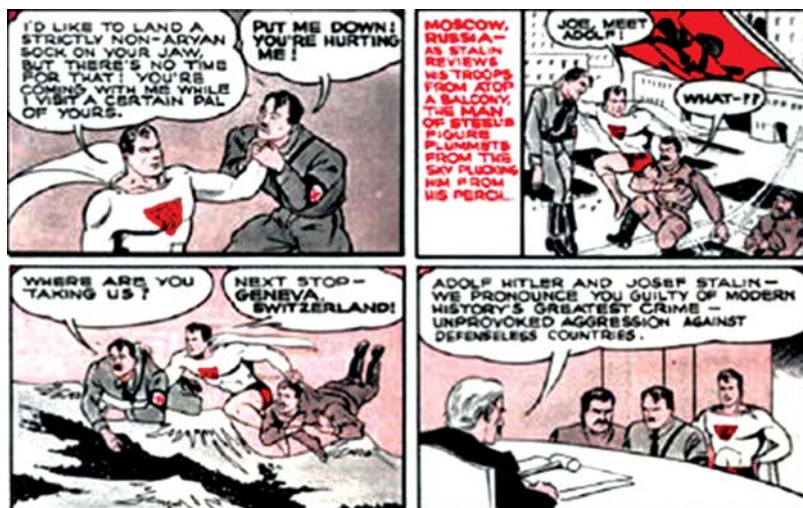
تصویر ۸، بخشی از اولین قسمت‌های سوپرمن. در این تصویر سوپرمن هیتلر را دستگیر کرده است