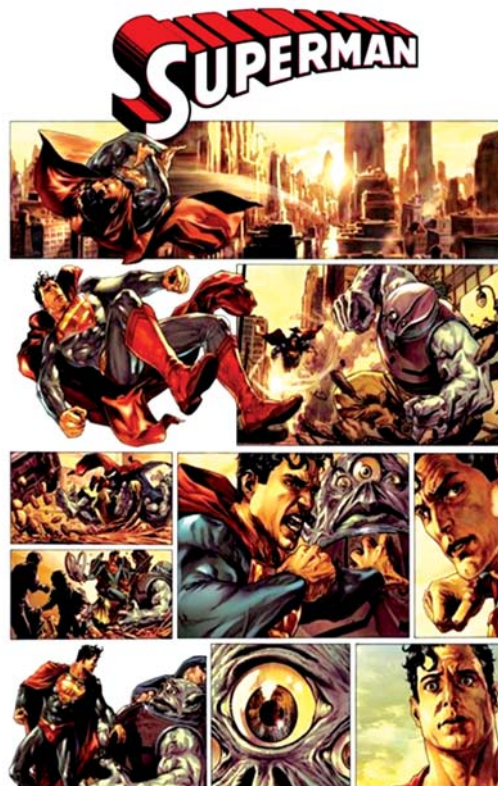
تصویر ۱۰. بخشی از داستان مصور سوپرمن، ترکیب و شکستن کادر برای القا هیجان و تحرک بیشتر در قاب، مأخذ: www.fantasy-illustration.com

از مرزهای باریک اختلاف در هر دو حوزه نقاشی خیالی‌نگاری و داستان‌های تصویری دنباله‌دار درمی‌یابیم که نقاشان خیالی‌نگار همواره ذهن و آگاهی بیننده نسبت به موضوع و ماجرای روایی را مدنظر داشته‌اند. به بیان دیگر، همواره نقش مخاطب در کامل نمودن روایت کلیدی بوده است. از سوی دیگر، این امر باعث حفظ فاصله خیالی‌نگار