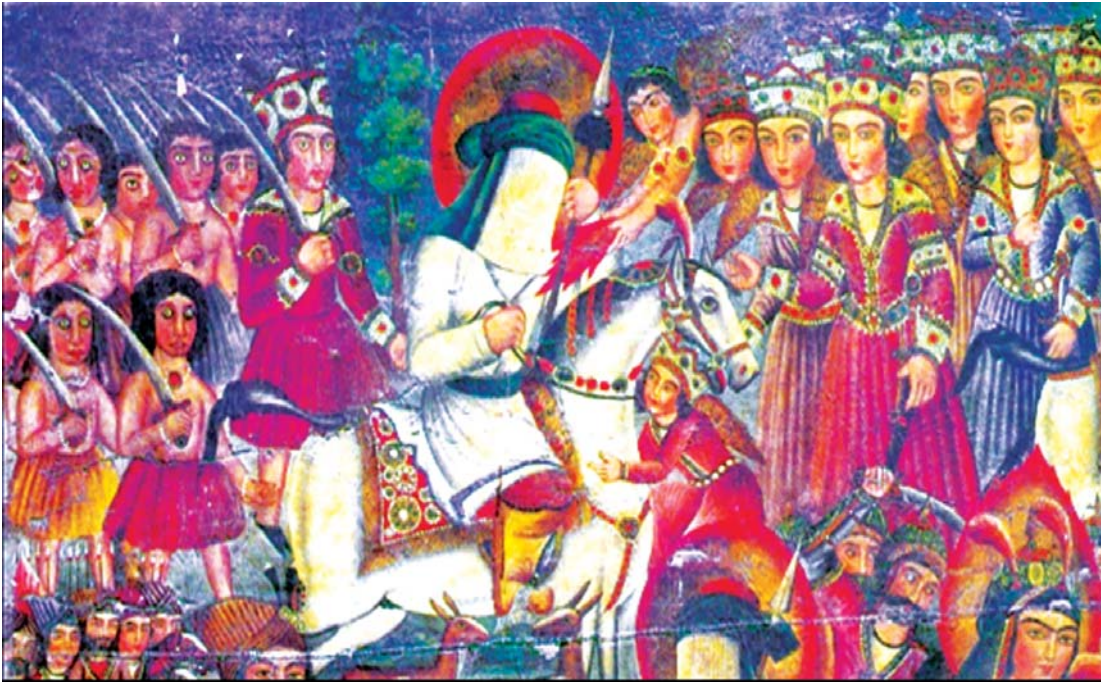
تصویر ۲. پرده درویشی، وقایع کربلا، بخشی از اثر ۱۲۸ در ۱۹۸ سانتی‌متر. ۱۲۸۸. موزه رضا عباسی.

قزوینی، ۱۳۸۹: ۶۳). اما در زیباشناسی غربی مراحل نگرشی و جهان بینی هنری متفاوت است. اساس زیبایی تطبیق با واقعیت‌های ملموس است و چون هنرمند از قلمرو واقعیت‌ها فرا رود، به استحاله شکل‌های طبیعی و واقعی می‌پردازد تا جایی که اشکالی بیافریند که از مظاهر طبیعت گرفته شده است (آیت‌اللهی، ۱۳۸۴: ۳۰).