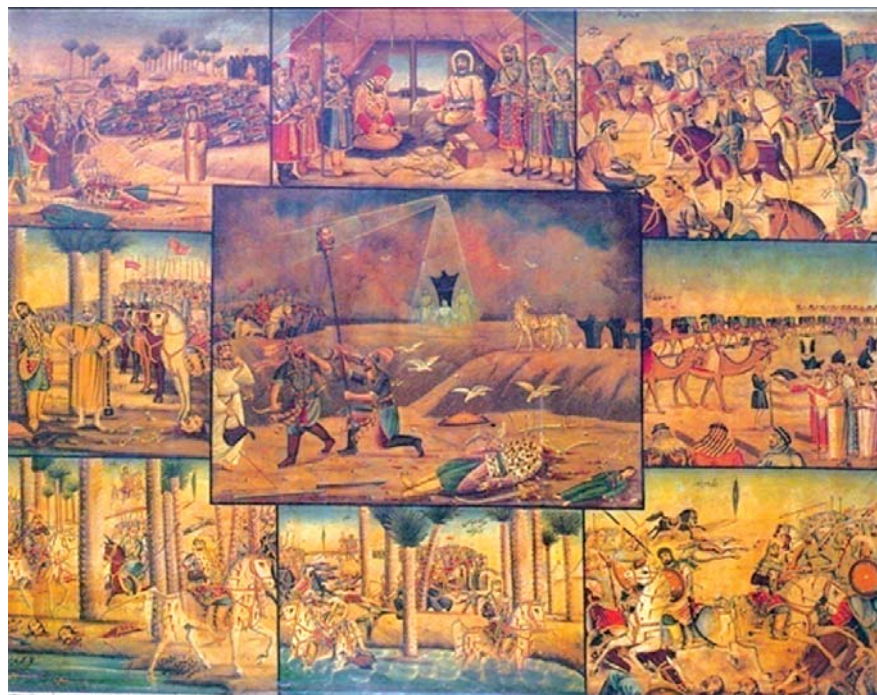
تصویر ۶. مصیبت کربلا. گودال قتلگاه. اثر محمد مدبر. ۱۹۸۰ در ۲۱۵ سانتی متر. رنگ روغن. موزه رضا عباسی، ماخذ: همان

در تصاویر ۱ و ۲ مضامین هر دو نقاشی مذهبی است. ساختار به هم پیوسته هر دو اثر و قرارگیری پیکره‌ها هیچ‌گونه جدایی تصویری را نمایان نمی‌کنند. تمام عناصر در یک پرده واحد و یکجا به نمایش درآمده‌اند. بالا و پایین تصویر از سوی نقاش به عنوان معیار چیدمان عناصر مطرح نیست و همه چیز در یک پیکره واحد تصویری عرضه می‌شوند. نقاش بر اساس نیاز خود و با توجه به اهمیت هر پیکره آنها را در جایی از تصویر نقش کرده است. تصاویر اصلی عموماً دارای یک مرکزیت دیداری قرار دارند که با جهت‌دهی حرکت پیکره‌ها یا نگاهشان در تصویر به بیننده القا می‌شود. از سویی، این حرکت با تزئین لباس‌ها و هاله‌های نورانی ائمه معصومین و بزرگ کشیدن پیکره‌ها تشدید می‌شود. بیننده عام با دیدن این تصاویر به آسانی قادر است تا با دانستن اصل داستان روایت مورد نظر را پی‌جویی کند. نقل نیز هنگام نقل به آسانی و به سرعت جای هر روایت و صحنه و افراد نقش اول داستان خود را پیدا می‌کند.