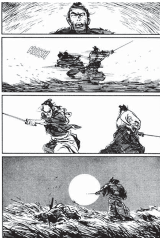
تصویر ۹. بخشی از مانگای گرگ تنها و بچه‌شیر، مأخذ: www.squido.com

مصور دنباله‌دار وجود دارد، در حالی که پیوستگی کلی در تمامی صحنه‌های خیالی‌نگاری با ترکیب و ادغام برخی رویدادها در قالب صحنه‌ای هم‌زمان و دوری از واقع‌نمایی رویدادی به‌جهت دوری از طبیعت‌سازی از الگوهای مورد استفاده در نقش‌اندازی نقاشی خیالی‌نگاری است. شکستن قاب در داستان‌های مصور همچون نقاشی‌هایی است که در دسته اول (بدون قاب و مرز بندی) قرار دارند با این تفاوت که در داستان‌های مصور دنباله‌دار این کار عموماً برای جلب توجه یا بالا بردن هیجان داستان انجام می‌پذیرد (تصویر ۱۰)، اما در نقاشی خیالی‌نگاری این امر به جهت حذف پرسپکتیو و استفاده از تمامی قاب و خالی نماندن فضای تصویر انجام می‌گرفته است. این شیوه‌ای است که هنرمندان مسلمان برای ترکیب عناصر آثار خود برای عدم تمرکز در یک نقطه استفاده کرده‌اند (تصویر ۱۱).