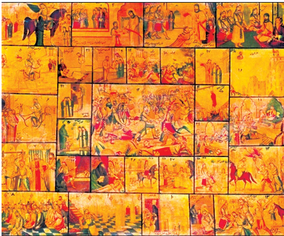
تصویر ۳. داستان مسلم بن عقیل و فرزندانش. حسین قوللر آقاسی. رنگ روغن. ۱۰۶ در ۲۱۵ سانتی متر، ماخذ: موزه امام علی (ع)

جذب نیروهای مستعد هنری و اقبال و توجه مردم به بیان تصویری مضامین حماسی و مذهبی که همواره مورد علاقه مردم بوده، دانسته شده است (همان: ۹۷).