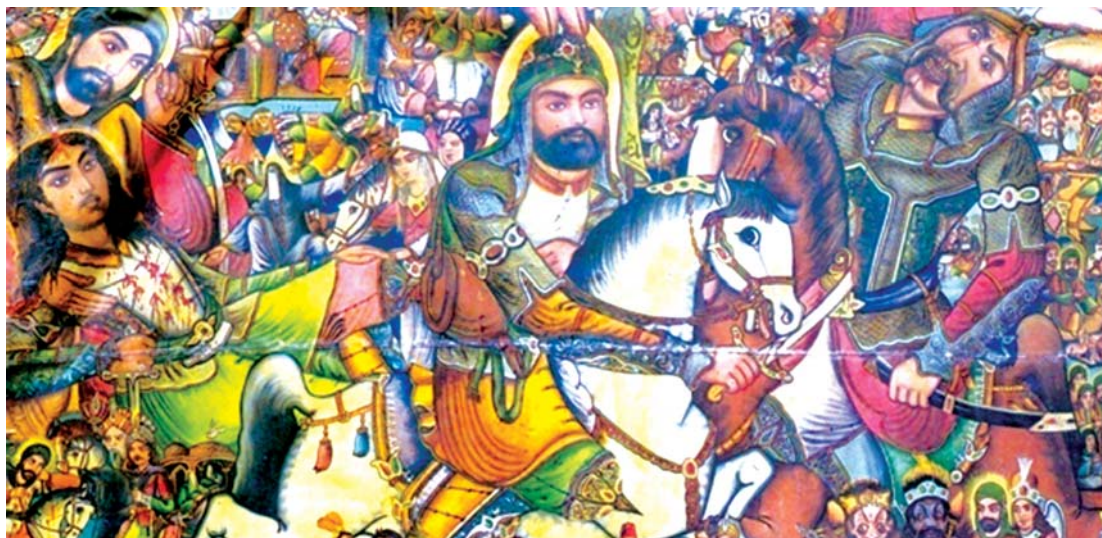
تصویر ۱۱. واقعه کربلا. اثر حسین همدانی. ۱۸۰×۲۳۶ سانتی‌متر. رنگ و روغن روی بوم. ۱۳۳۸. موزه رضا عباسی.

خیالی‌نگاری با موضوع جنگ خیبر (تصویر ۱) فضای تعریف‌شده متفاوت از فضای کوفه در داستان «عزیمت مسلم بن عقیل به کوفه» می‌گردد، اما در فضای به‌کاررفته