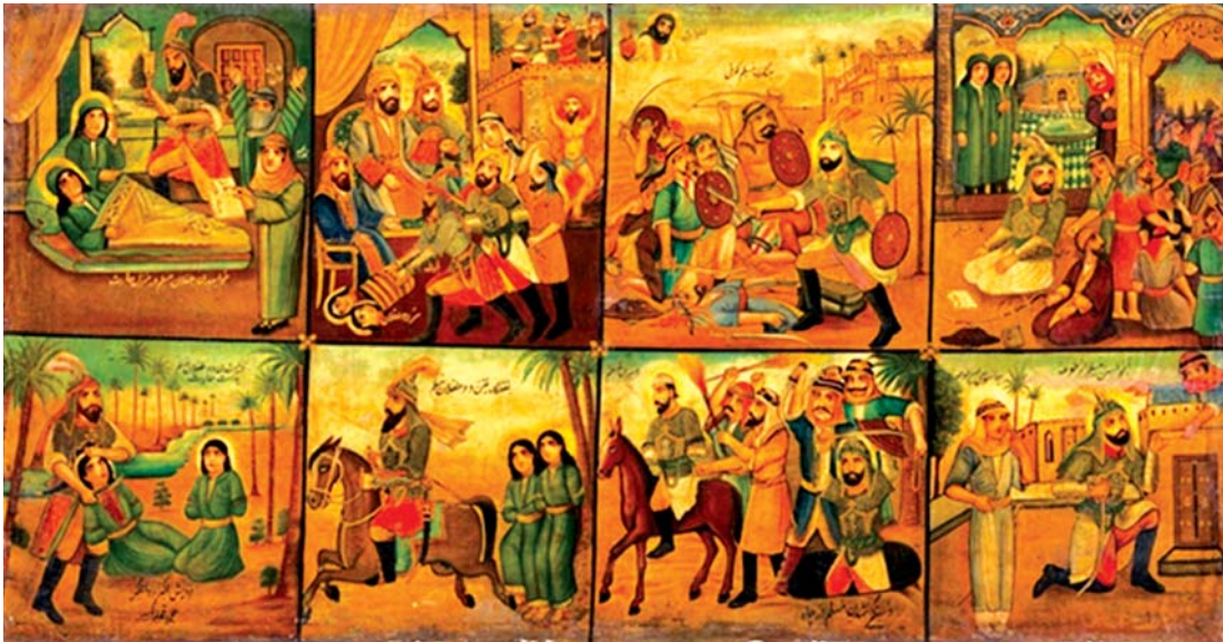
تصویر ۴. روایت عزیمت مسلم بن عقیل به کوفه، محمد مدبر، ۲۵۳ تا ۲۰۴ سانتی‌متر. رنگ و روغن، ماخذ: موزه رضا عباسی