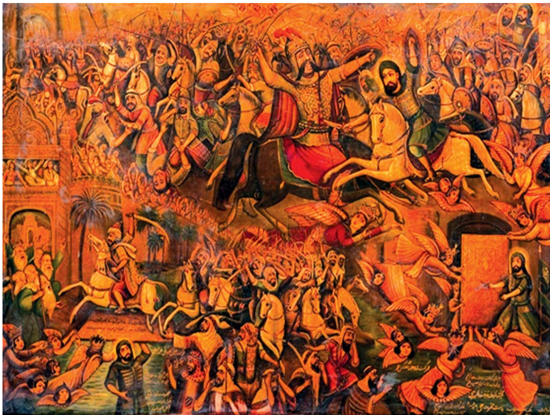
تصویر ۱. جنگ خیبر. اثر عباس بلوکی فر. رنگ روغن. ۱۳۵ در ۲۰۰ سانتی متر.