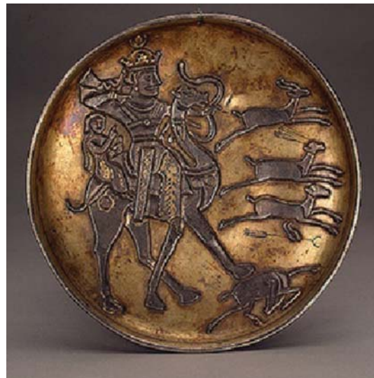
تصویر ۹. بشقاب سیمین با نقش بهرام گور (۲۳۸-۴۲۰ م) در حال شکار آهو - موزه هرمیٹاژ - قطر: ۲۲ سانتی متر.

حتی جدال میان دو حیوان. در ایران دوره هخامنشی، نقش شاه این بود که بر نیروهای مخرب که در قلمرو سلطنت وی به فعالیت می‌پردازند غلبه کند. در تالار اصلی کاخ داریوش در تخت جمشید، شاه در حال مبارزه با یک حیوان افسانه‌ای است که مظهر چیرگی شاه بر پلیدی‌هاست (کخ، ۱۳۸۰: ۱۵۵). اما در دوره پارتی، موضوع شکار دوباره در میان خدایان باب می‌شود. نمونه بارز این صحنه‌ها در نقاشی‌های شهر دورا اورپوس دیده می‌شود که ایزد مهر در چهره جوانی سوار بر اسب در حال جدال با شیر یا گاو است (کالج، ۲۵۳۷: ۲۰۵). دقت در موضوع شکار شیر توسط مهر، یادآور نقش شکار شیر توسط الهه ایلامی است. مضمون شناخته‌شده این صحنه نمایانگر شکست دشمنان دنیوی و معنوی در قالب حیوانات است.