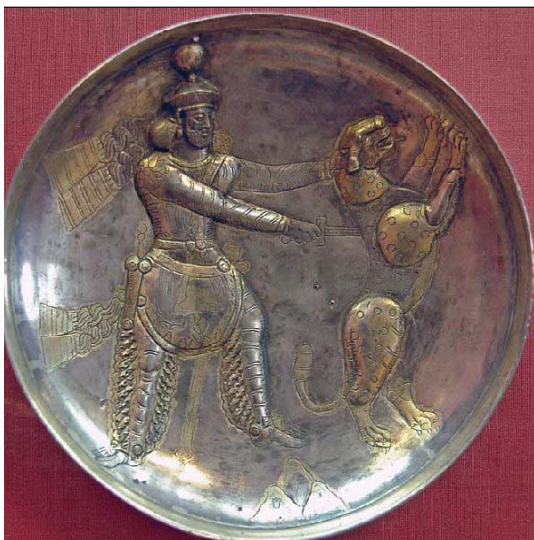
تصویر ۱۰. بشقاب سیمین زرانود شده با با نقش شاپور سوم مأخذ: ۲۸۸-۳۸۳ م) در حال کشتن پلنگ. موزه هرمیٹاژ. قطر: ۲۱.۷ سانتی متر.