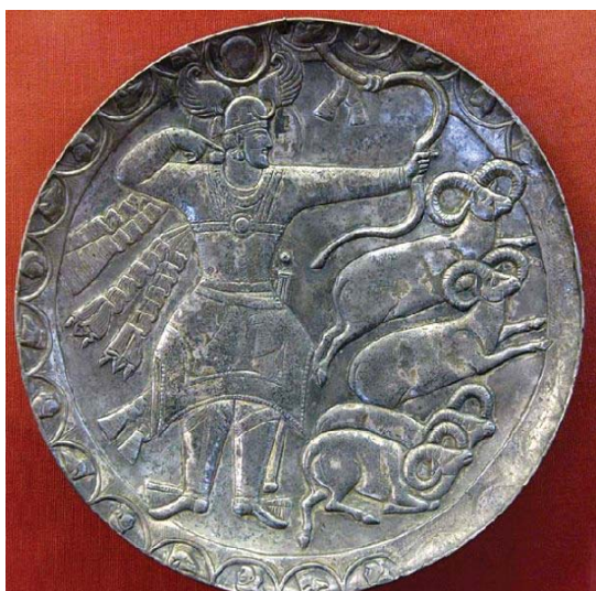
تصویر ۴: بشقاب سیمین زراندود شده با نقش پیروز شاه (۴۵۷ تا ۴۸۳ میلادی) در حال شکار قوچ - موزه هرمیتاژ، قطر: ۲۴,۶ سانتی متر