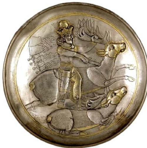
تصویر ۷. بشقاب سیمین زرانود شده با نقش شاپور دوم (۳۷۹-۳۱۰ م) در حال شکار گوزن- موزه بریتانیا - قطر: ۱۸ سانتی متر.

معشوقه‌اش نشان داده است. یکی از آهوان کشته در زیر پای شتر مشاهده می‌شود.