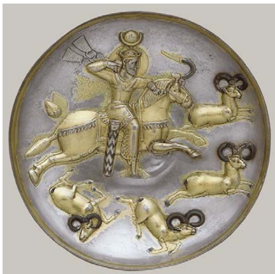
تصویر ۳: بشقاب سیمین زراندود شده با نقش خسرو اول (۵۷۹-۵۳۱ م) در حال شکار قوچ - موزه متروپلیتن، قطر: ۲۲ سانتی متر.