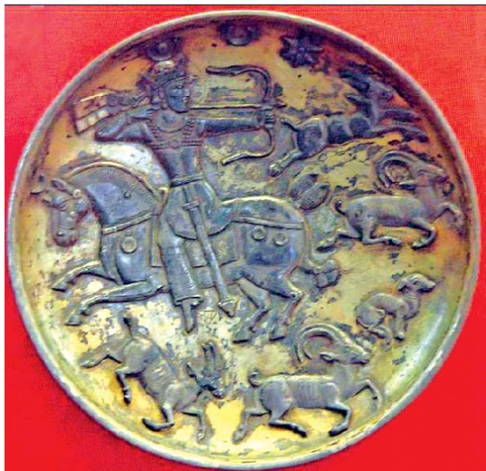
تصویر ۸. بشقاب سیمین خسرو اول ( ۵۷۸-۵۳۱ م ) در حال شکار بُز- موزه هرمتاژ - قطر ۲۰ سانتی متر.