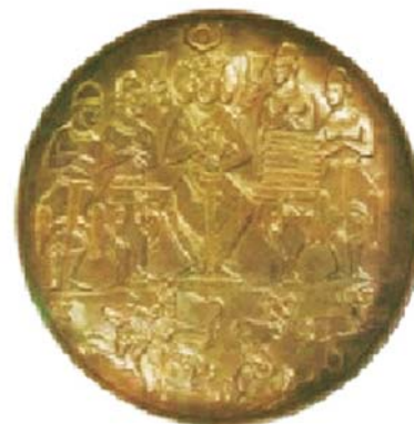
تصویر ۵. بشقاب سیمین خسرو اول مأخذ: ۵۵۹-۵۳۱ م) بر تخت نشسته و در حال شکار قوچ- موزه هرمیتاژ: قطر ۲۶ سانتی متر. مأخذ: هرمان ۱۳۸۷:.

در بشقاب خسرو اول (تصویر ۸) شاه در حالی که به سمت چپ صحنه حرکت می‌کند و اسب خود را به آن سو می‌تازد به عقب برگشته در پشت سر اسب شاه در بالا بُزها در حال فرار به سمت راست هستند که شاه با کمان خود بر پشت هریک از آن‌ها تیری را نشانه رفته است. در زیر پای اسب شاه، دو بُز کوهی دیگر که آن‌ها نیز تیری بر پشت دارند در حال فرار و هم جهت با بقیه گله در حال حرکت‌اند که نشانه ضعف و ازپافتادگی در آن‌ها مشهود است (موسوی، ۱۳۷۳: ۳۱۴-۳۱۵). در این ظرف صحنه شکار فراخ‌تر شده است تا دو گونه مختلف از حیوانات و نیز یک سگ شکاری را در خود جای دهد (هارپر، ۱۳۷۹: ۱۲۰). نقش سگ در صحنه‌های شکار برای نخستین بار است که در این بشقاب دیده می‌شود. در دوره عیلامی نیز