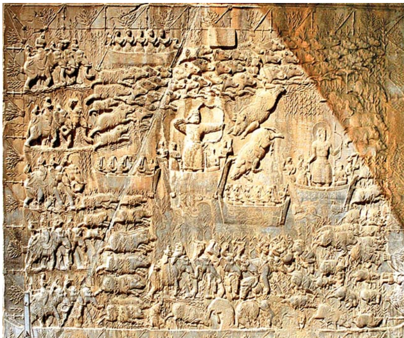
تصویر ۱۴: نقش برجسته شکار گران. طاق بستان.

برای پهلوان (شاه) نقش مکمل، یاریگر و تأمین‌کننده بخشی از قوای مادی، روحانی و پیروزی بخش طبیعت را ایفا می‌کرد.