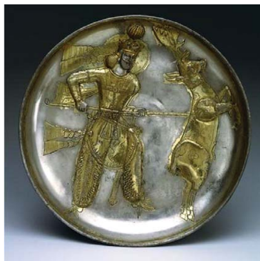
تصویر ۶. بشقاب سیمین زرانود یزدگرد اول در حال شکار گوزن- موزه متروپلیتن- قطر: ۲۳،۳ سانتی متر.

چون پرسیدند که آن چیست که به دنبال وی روان است گفتند فره کیانی باشد» (هدایت، ۱۳۱۸: فصل ۴- بند ۱۰ و ۲۴). از این رو، یکی از جلوه‌های فره ایزدی قوچ است و از سویی قوچ یکی از صورت‌های ایزد بهرام است (بهرام یشت، کرده ۸، بند ۲۳). بنابراین، قوچ هم نشان فره و هم نشان قدرت شاهی است.