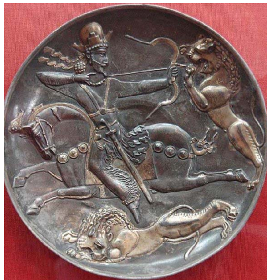
تصویر ۲: بشقاب سیمین زرانود شده با نقش شاپور دوم (۳۷۹-۲۱۰ م) در حال شکار شیر. موزه هرمیتاژ - قطر: ۲۲.۹ سانتی متر.

نقش شکار شیر در نقش برجسته سر مشهد اندکی با صحنه‌های شکار شیر در بشقاب‌های فلزی متفاوت است. این نقش، بهرام دوم را نشان می‌دهد که همسر و پسرش را در مقابل حمله دو شیر حمایت می‌کند (واندنبرگ ۱۳۴۰: ۵۲). وی شیر اولی را کشته و خود را برای حمله به شیر