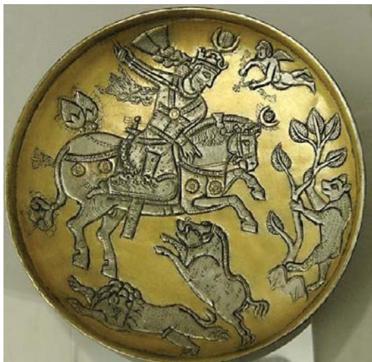
تصویر ۱۱. بشقاب سیمین زرانود شده با نقش بهرام گور در حال شکار. قفقاز - موزه لیون - قطر: ۱۹ سانتی متر - مأخذ: pope 1977, Vol VII, pl 229 A

مشهور خود را با کمان به نمایش بگذارد و آزاده را با خود به شکار برد و یکی از خواسته‌های آزاده را اجرا کند: زدن شاخ‌های غزال، به طوری که او به ماده تبدیل شود و دیگری نشانند دو تیر بر سر ماده غزال، به طوری که به شکل شاخ درآید (فردوسی ۱۳۸۷، ج ۴: بیت ۳-۳۳۹۸۲ و ۳۳۹۸۷).