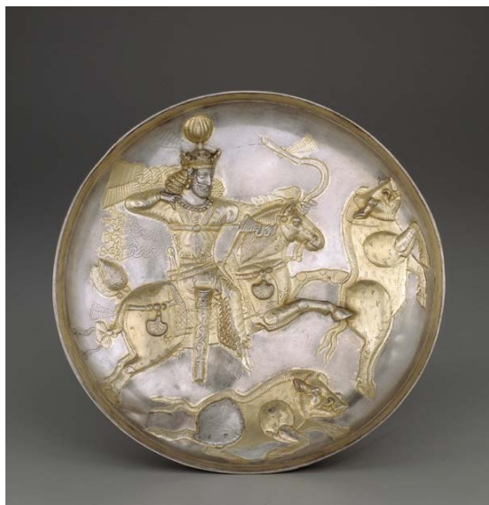
تصویر ۱: بشقاب سیمین شاپور دوم (۳۷۹-۳۱۰ م) در حال شکار گراز- گالری فریر واشنگتن - قطر ۲۱ سانتی متر.