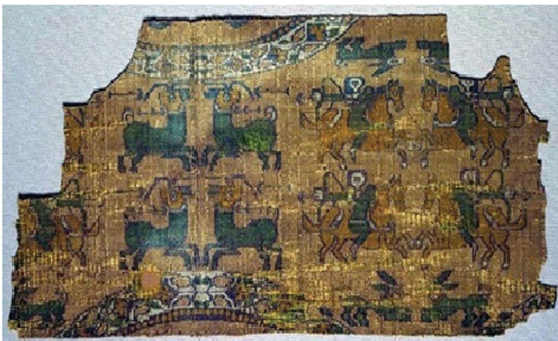
تصویر ۱۲. پارچه با نقش شکار بُز - سغد - موزه کلوند.

بازتاب این هنرنمایی‌های بهرام گور در شکار در هنر نیز جلوه‌گر شده است و اینجاست که باستان‌شناسی در تأیید تاریخ برمی‌آید. در پنج بشقاب فلزی، نقش بهرام در حال شکار جانوران دیده می‌شود. در دو مورد از بشقاب‌های سیمین و یک مورد در گچبری بهرام گور در حال شکار آهوان است. در این صحنه‌های شکار، بهرام گور همراه با معشوقه‌اش، آزاده دیده می‌شود. این صحنه‌ها یادآور این داستان است که چنگ‌نواز محبوب و زیبای وی، آزاده، او را به ریشخند گرفت، آن‌گاه بهرام تصمیم گرفت که پهلوانی