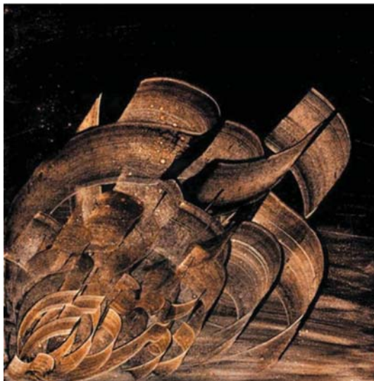
تصویر ۵. بدون عنوان، عین‌الدین صادق زاده، قیر و رنگ ماشین روی بوم، ۱۴۰×۱۴۰ cm