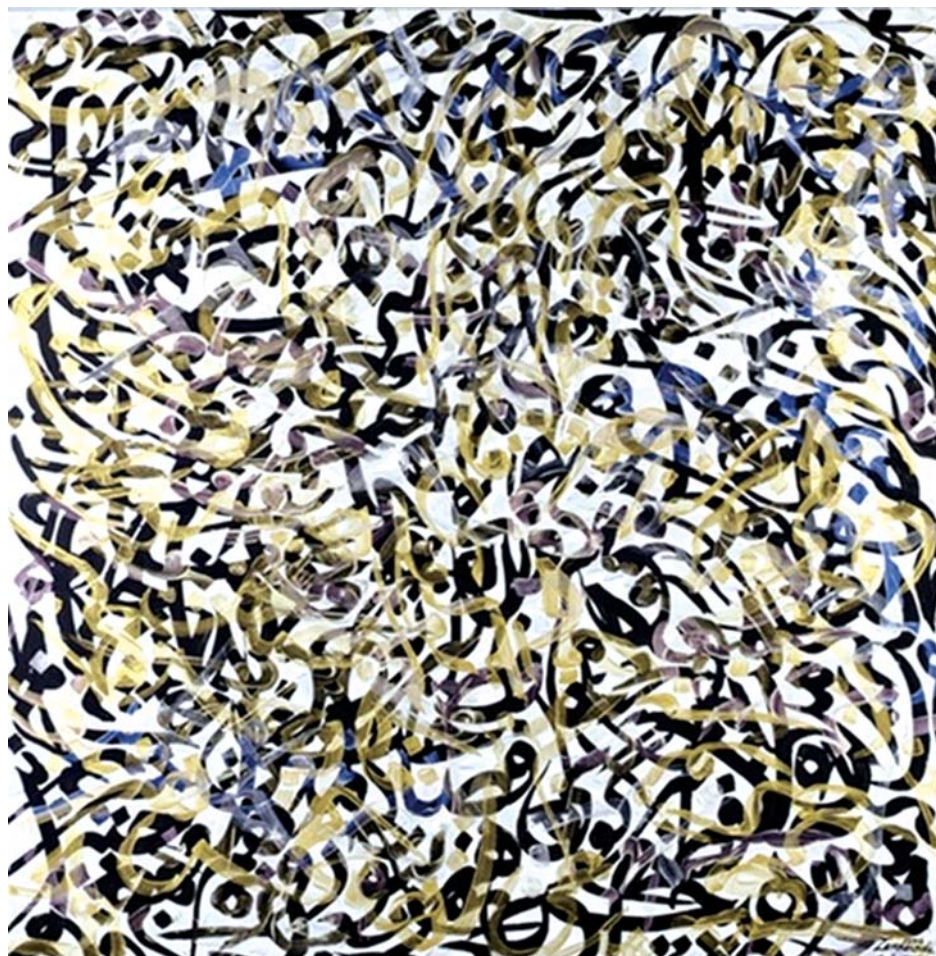
تصویر ۱. «مروراید بنفش» حسین زنده‌رودی، تکنیک iridescent acrylic روی بوم، 152x150cm، مأخذ: www.artnet.com

سنت و مدرنیته به‌عنوان دو دیدگاه ناهمساز در نقاشیخط پرداخته است و به این نتیجه رسیده است که اگرچه مبانی هنرهای تجسمی در نقاشیخط نوگرا در صورت بر مبانی خوشنویسی غلبه داشته اما در محتوای آثار اندیشه ایرانی و اشراقی عمیقاً حاکم بوده است. شادی مظاهری نیز در پایان‌نامه خود با عنوان «بازتاب سنت در آثار نقاشان معاصر ایران» داستان دگرذیسی نگارگری ایرانی به نقاشی نوگرا را مورد بررسی قرار داده و به این نتیجه رسیده است که جرقه‌های این تحول از عصر صفوی شروع شد و به دوری از نقاشی سنتی ایرانی انجامید و آن‌گاه که خلأ هویت احساس شد هنرمندان در جست‌وجوی ریشه و اصالت خود به تلاش برای کسب هویتی اصیل پرداختند.