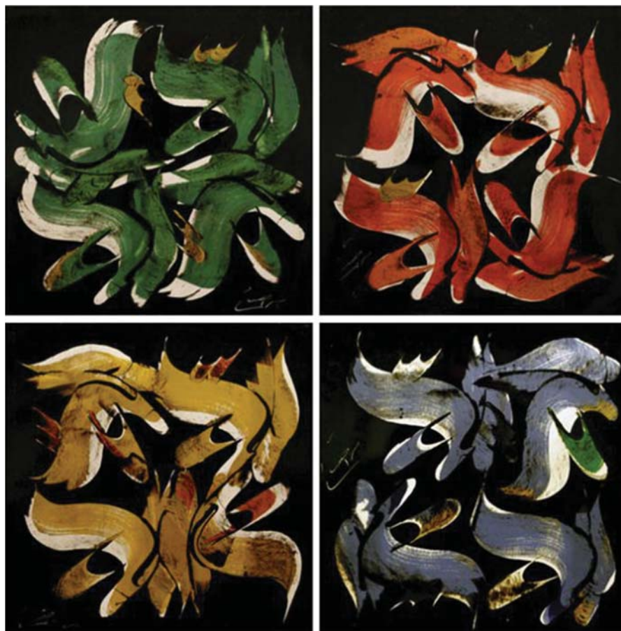
تصویر ۲. «الله»، محمداحصایی، آکرلیک روی مقوا، ابعاد هر لث ۵۸/۷cm × ۵۹

فلسفه سنت این‌گونه تعبیر می‌شود که سفید در واقع همان تجلی «نور» است که تمامی رنگ‌ها را در خود دارد. رنگ طلایی و نقره‌ای نیز به دلیل درخششی که به همراه دارند همچون رنگ سفید از جایگاه ویژه‌ای برخوردارند. همچنین طیف‌های مختلفی از رنگ آبی همچون آبی فیروزه‌ای، آبی لاجوردی و... به‌عنوان پس‌زمینه آثار به کار گرفته می‌شود و یا رنگ سبز که در اسلام رنگی مقدس به حساب می‌آید. یکی از اصول مورد تأکید سنت‌گرایان اصل نظام سلسله‌مراتبی واقعیت یا وجود است. در بینش این رویکرد انسان‌شناسی و جهان‌شناسی به هم پیوسته‌اند و مراتب عالم هستی به‌عنوان عالم کبیر در انسان به‌عنوان عالم صغیر مطابقت دارد. «هنر و معماری سنتی مبتنی بر اصل تناظر میان عالم و آدم است. این معنا سبب گشته در کیهان‌شناسی ادیان شرقی به‌ویژه اسلام، اشکال هندسی، ابعاد کیهانی را شرح داده و هم آنها در ساخت معماری‌های مقدس تجلی یابند. در این میان دایره و مربع جایگاه ویژه‌ای دارند. جایگاهی که در متون کیهان‌شناسی هم بیانگر روح لایتنای عالم‌اند (به‌صورت دایره) و هم بیانگر ابعاد یتنای