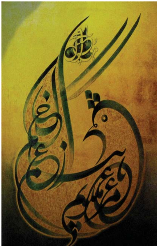
تصویر ۳. «مرغ باغ ملکوتیم نیم از عالم خاک». جلیل رسولی، اکریلیک روی بوم

موضوعات مقدّس و ادبی موجود در خوشنویسی بودند. البته قابل ذکر است که گرچه در دههٔ چهل رویکرد بی‌توجهی به اصول خوشنویسی در به‌کارگیری خط و صرف استفاده از حروف با بار بصری‌ای که دارند در آثار هنرمندان گرایش اول وجود داشت، ولی مشاهده می‌شود که در دههٔ هشتاد این هنرمندان نیز تا حدودی به سمت گرایش دوم تغییر رویکرد داده‌اند. این امر در آثار حسین زنده‌رودی به‌عنوان یکی از مهم‌ترین نمایندگان گرایش اول در آثاری که در دههٔ هشتاد خلق کرده قابل مشاهده است. این در حالی است که در آثار دهه‌های قبل زنده‌رودی صرفاً شاهد رویکردی حروف‌گرایانه بودیم که سبکی کاملاً نقاشانه به آثارش می‌داد. (تصویر ۱)