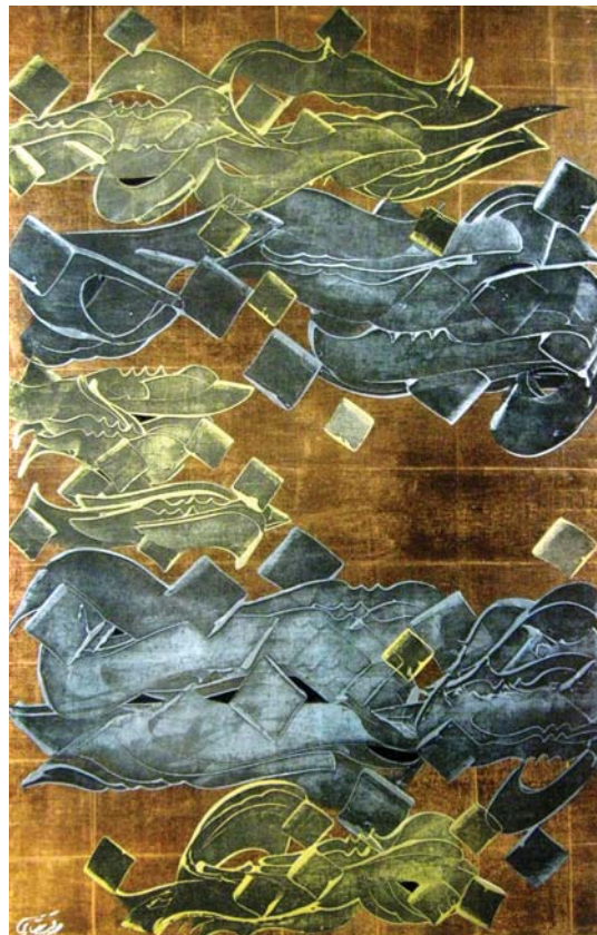
تصویر ۴. بدون عنوان، صداقت جباری، رنگ روغن روی بوم، ۱۵۰×۱۰۰

علی شیرازی نیز سعی بر حفظ سنت با استفاده از به‌کارگیری نستعلیق با رعایت قواعد اما در ابعاد بسیار بزرگ دارد. وی با استفاده از رنگ‌گذاری‌های متنوع جلوه بیشتری به آن‌ها می‌بخشد اما علی‌رغم این موارد کارهای دهه هشتاد او نسبت به آثاری که در سال‌های بعد ارائه می‌دهد نقاشانه‌تر می‌نماید چراکه در کارهای بعدی خود به‌طور خاص بر بزرگ کردن حروف و لایه‌لایه کار کردن