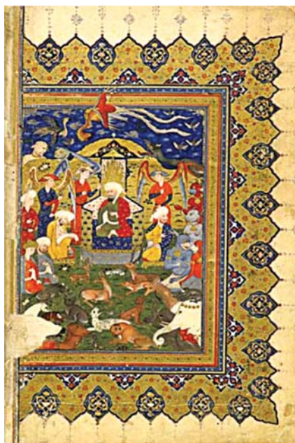
تصویر ۳. بر تخت نشستن سلیمان نبی (ع)، شاهنامه کتابخانه ملی فرانسه، شعبه شرقی فارسی، شماره ۴۹۰، مأخذ: همان.

اند. ادامه متن شاهنامه در صفحات بعد از سر لوحکتابت شده اند. تمامی صفحات دارای جدول کثی با ابعاد ۲۵۰×۱۳۵ سانتی متر است. هر صفحه دارای دو ستون و ۳۰ سطر و ۵۸ بیت شعر است. ورق‌های ۶۱، ۱۷۲ و ۴۳۴ از وسط صفحه‌ها کنده شده‌اند که با توجه به کلمات رکامه پایین صفحه‌های راست نسخه و مغایرت کلمات شروع صفحه‌های چپ، قابل تشخیص است. (همان).