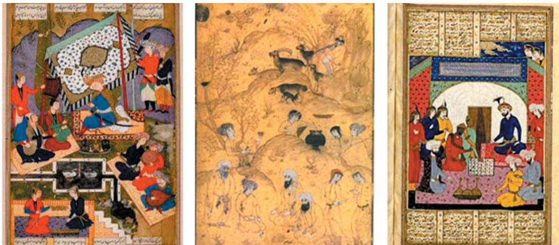
تصویر ۶. از سمت راست به چپ، نگاره انوشیروان تخته نرد را به جای شطرنج به راجای هندی می‌دهد (شاهنامه کتابخانه ملی فرانسه به شماره ۴۹۰) مأخذ: همان، نگاره چوپان (اثر محمد هروی)، کتابخانه ملی فرانسه، مأخذ: همان، ۲۳۶، نگاره رودابه دختر مهرباب در باغ، شاهنامه کاخ موزه نیاوران.