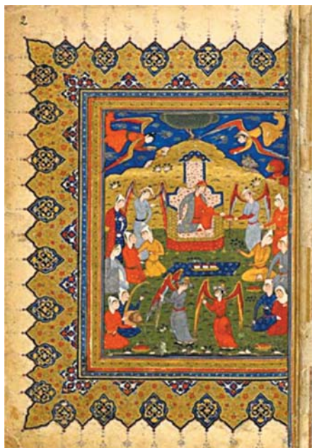
تصویر ۴. بر تخت نشستن ملکه بلقیس، شاهنامه کتابخانه ملی فرانسه، شعبه شرقی فارسی، شماره ۴۹۰