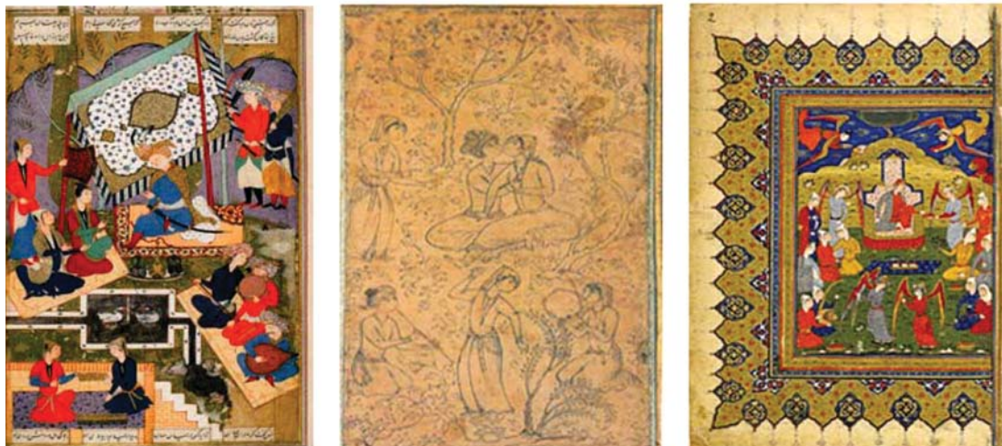
تصویر ۵: از سمت راست به ترتیب: نگاره ملکه بلقیس، شاهنامه کتابخانه ملی فرانسه به شماره ۹۰، مأخذ: همان. نگاره مجلس جشن و طرب، محمد هروی، مکتب قزوین، کتابخانه ملی فرانسه، مأخذ: خزایی، ۱۳۷۸، ۲۳۵. نگاره رودابه دختر مهرباب در باغ، مکتب قزوین و اصفهان، شاهنامه کاخ موزه نیاوران.

در شاه عباس اول بوجود آمد و از آنجا که وی مدتی در هرات اقامت کرد دور از ذهن نیست که با هنرمندان چیره دستکارگاه هرات آشنا شده و ایشان را با خود به قزوین و سپس به اصفهان برده باشد زیرا اسکندر بیک شرح اقامت شاه را چنین بیان می‌کند «شاه عادل و سپهر رکاب، طوایف ازبک را راند و آسایش مردم بازگردانید و امارت بلخ و سایر ولایات خراسان را آباد نمود از جمله میمند و فاریاب را خرم داشته است» (ترکمان، ۹۸۰، ۱۳۵۰). مطلب دیگر آنکه فاصله زمانی کتابت دو نسخه شاهنامه ۱۰۰۸ ه.ق در (کاخ موزه نیاوران) و شاهنامه ۱۰۱۲ ه.ق در (کتابخانه ملی فرانسه) چهار سال است از این رو احتمالاً ابتدا شاهنامه ۱۰۰۸ ه.ق به شاه عباس اول هدیه شده و در مدت اقامت وی در هرات کتابت شاهنامه ۱۰۱۲ ه.ق در همان کارگاه آغاز شده است. حال با تأکید بر گفته سچوکین در کتاب «هنرمندان دوره شاه عباس» که در مورد شاهنامه ۱۰۱۲ ه.ق (کتابخانه فرانسه) می‌گوید: «نقاشی‌های این شاهنامه اثر هنرمندان مختلف است و با کتابت آن فاصله زمانی دارد» (Stcho-kine, 1964, 209).