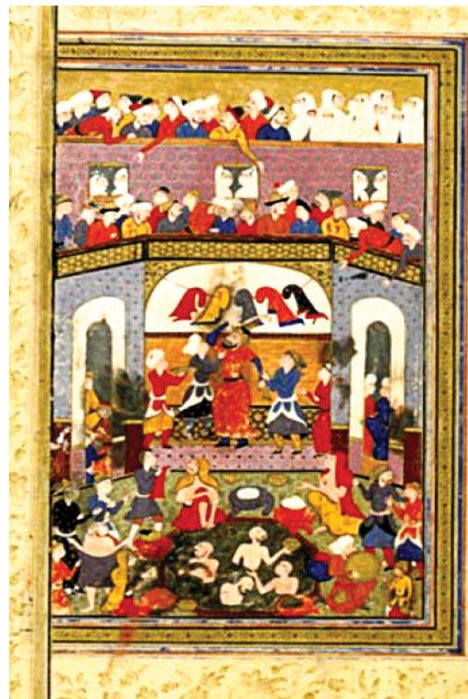
تصویر ۱. پادشاه در حمام، شاهنامه کتابخانه ملی فرانسه، شعبه شرقی فارسی، شماره ۴۹۰

۳۰ سطر در صفحه دوستونی نگارش شده‌اند. تذهیب‌های ورق‌های ۲ پشت و ۳ (صفحه مزدوج) ورق‌های ۳ پشت و ۴ (صفحه مزدوج) آغازین متن با آرایه‌ای از توده‌های ابر بر روی زمینه طلایی با نقش‌های گیاهی (آرایه‌های عنوان‌ها و دیگر تزیینات (که ویژگی آن‌ها زمینه طلایی و دسته‌های گل است) همه به سبک شیراز در آن روزگار هستند. همچنین نقاشی‌های ورق‌های ۱ پشت و ۲ که ربطی به محتوی متن شاهنامه ندارند، نقاشی ۴۶۹ پشت (صفحه‌ای از حمام عمومی) (تصویر ۱) و در ورق ۴۶۷ (رقص درویشان زیر درخت سرو) (تصویر ۲) که آن‌ها نیز به محتوی متن مربوط نیست، تأثیر و نقش مکتب قزوین را در نسخه‌پردازی و نگاره‌های این شاهنامه نشان می‌دهند.» (ریشار، ۲۰۳، ۱۳۸۳) این نسخه علاوه بر این چند تصویر توصیف شده، دارای ۵۰ نگاره دیگر نیز می‌باشد که بدون تردید در زمان دیرتر از نگارشدن نقاشی شده‌اند و سبک آنها کاملاً متفاوت از ۵ نگاره اول است. ایوان سچوکین معتقد است که «نقاشی‌های شاهنامه ۱۰۱۲ ه. ق اثر هنرمندان مختلف آن روزگار و مربوط به مکتب شیراز و قزوین می‌باشد.» (Stchoukine, 1964, p208). مهرورق ۴۷۰ پشت، نشان می‌دهد که این نسخه در دوران شاه عباس اول در اختیار صاحب منصب هرات و از وزرای وقت بوده و در جریان تصرف هرات به دست حاتم بیگ و سپس فرزند وی به نام میرزا طالب خان نصیری اردوباری «واقع‌نویس» در