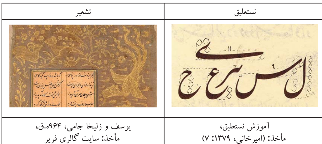
جدول ۳ مقایسه معیار سنجش واژگان نستعلیق و نقوش تشعیر - مأخذ: همان.

۲. بازشناسی تشابهات صورت‌گرایی نستعلیق و تشعیر با توجه به عوامل مؤثر در شکل‌گیری نستعلیق و تشعیر به موازات یکدیگر و به واسطه ارتباط و پیوستگی مداوم میان آن‌ها، در اکثر دست‌نوشته‌ها حضور یکی مستلزم وجود دیگری است. این هم‌نشینی، تأثیرات غیرقابل‌انکاری بر کیفیات ظاهری آن‌ها نیز به وجود آورده و از این رهگذر اشتراکات قابل‌تحلیلی، از حیث صوری که به عنوان یکی از معیارهای