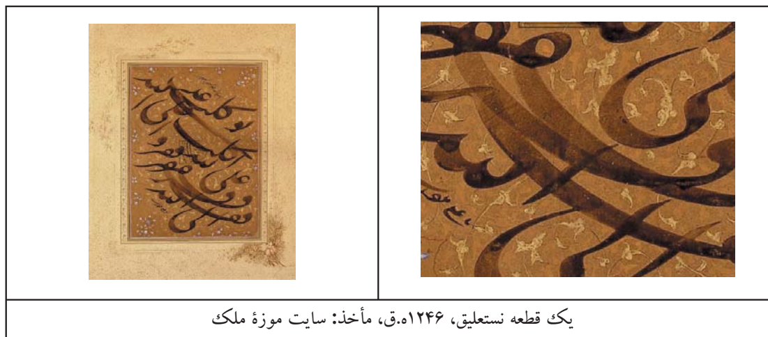
یک قطعه نستعلیق، ۱۲۴۶ ه.ق، مأخذ: سایت موزه ملک

جدول ۵. همپوشانی لایه‌های متنوع خاکستری، مأخذ: همان.