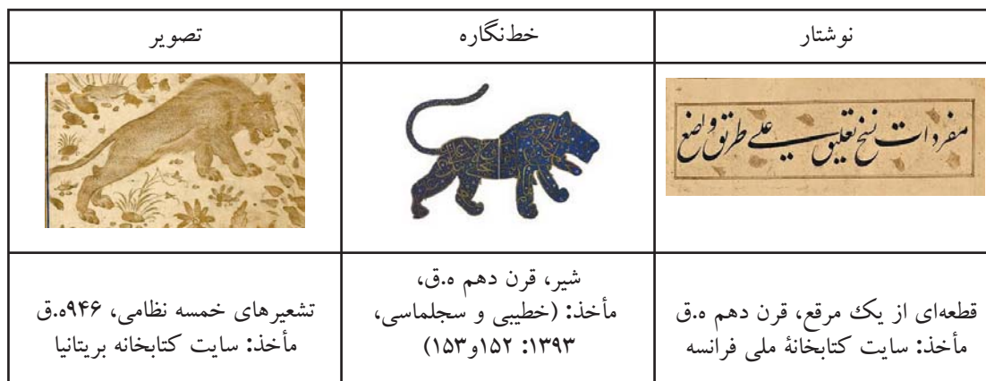
جدول ۲ «خط نگاره» حدوسط نوشتار و تصویر، مأخذ: همان.

مهم جهت ارزش‌گذاری آثار هنری قلمداد می‌شود، میان قلم نستعلیق و تشعیر وجود دارد. بر این مبنا ضروری می‌نماید تا به مطالعه ویژگی‌های صورت‌گرایی حاصل شده از تأثیرات میان این دو هنر پرداخته شود. در بیان صورت‌گرایی، «فرم» یا به معنای هرگونه نظم و ترتیب اجزاء بوده یا در معنای انحصاری، صرفاً به انتظامی صحیح، زیبا، هماهنگ و منظم اطلاق می‌شود.» (تاتارکوه ویچ، ۱۳۸۱: ۵۲) فرم در واژگان (نستعلیق) از یک سو بر سطح کلمه چیره می‌یابد و از سوی دیگر در ذهن مخاطب نقش می‌بندد و در ورای ظاهر قرار می‌گیرد. بنابراین در ابتدا، پیش از تبدیل کلام به معنا با یک فرم ظاهری روبه‌رو هستیم که صفحات متن را رقم می‌زنند و در درجه دوم، با تبدیل کلام به معنا، واژگان بیش از یک فرم ساده تلقی می‌شوند که در ورای معنا جای دارند و همیشه از حیث دلالتی که به بیرون از خود دارند، در ذهن خواننده متن تجسم می‌یابند. به‌واقع «در هنر واژه‌پردازی، فرم و محتوا