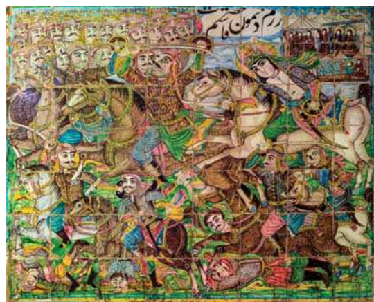
تصویر ۱۸. رزم نمودن حضرت قاسم، تکیه معاون الملک، ۹۶/۸/۱۵.

نوشتاری، همچنین تأثیر سنت نقاشی و کتاب آرایی ایرانی باشد. آنچنان که در نگاره‌های سنتی ایرانی مرسوم بوده، نقاشی‌ها اغلب ویژگی روایتی داشته و در پیوند با یک متن ادبی و نوشتاری بودند، از این رو همواره بخشی از فضای نگاره به متن ادبی مرجع اختصاص می‌یافت. بنابراین حضور عناصر نوشتاری در کنار عناصر تصویری برای مخاطب ایرانی سابقه‌ای دیرین دارد، اگرچه با استقلال نقاشی از متن ادبی و نوشتاری به تدریج این پیوند گسسته شد. بکارگیری نوشتار در این نقاشی‌ها تابعی از ترکیب‌بندی عناصر تصویری است، بدین معنا که در صحنه‌های رزم و پیکار که عناصر تصویری خودگویای روایت بوده، عناصر نوشتاری کمتر بوده و تنها محدود به نام برخی اشخاص و یا واقعه تصویر شده، می‌باشد (تصاویر ۱۳ و ۱۲ و ۴)؛ در صحنه‌های مربوط به سرهای بریده شهدا که از تراکم عناصر تصویری کاسته می‌شود، بر ازدحام عناصر