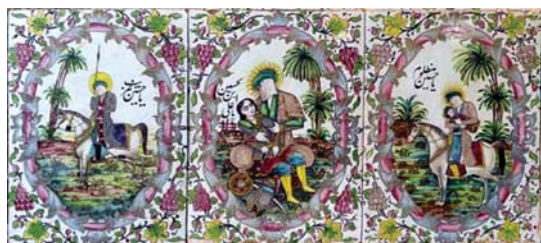
تصویر ۲۶. کاشی‌نگاری مذهبی، تکیه معاون الملک، ۹۶/۸/۱۵، همان.

همچنین استفاده از عمق میدان مقامی به صورت تجسم بزرگتر شخصیت اصلی و در مرکز تصویر قرار دادن آن، اغراق در حالت و حرکت چهره‌ها و پیکره‌ها، استفاده نمادین از رنگ، نمایش نقطه اوج واقعه دیگر ابزارهای بیانی هستند که نقاشان در جهت برانگیختن احساسات و عواطف مخاطبان به خدمت گرفته‌اند. تمامی نقاشی‌ها جز در موارد کوچک اندازه مملو از پیکره‌های انسانی در تکاپو هستند که از یک سو حالتی از آشفتگی، اضطراب، تنش و دشواری را به بیننده انتقال می‌دهند؛ و از سوی دیگر اشاره به اهمیت و عظمت واقعه کربلا به عنوان یک فاجعه دارند.