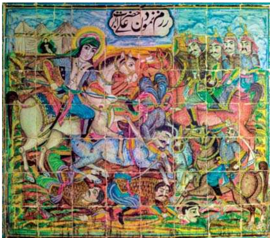
تصویر ۱۷. رزم نمودن حضرت علی اکبر، تکیه معاون الملک، ۹۶/۸/۱۵.