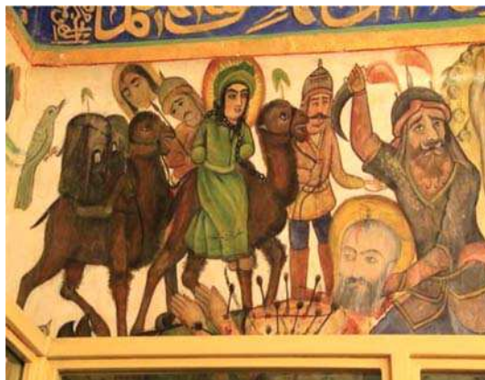
تصویر ۳. حضرت سجاد، بقعہ شاہ زید، مأخذ: همان.

آن‌ها دانست. نبود وحدت در زمان و مکان بدین معناست که وقایع و شخصیت‌هایی که در یک تعزیه به نمایش درمی‌آمدند و یا در یک دیوارنگاره تصویر می‌شدند در یک زمان و مکان واقعی و در یک رخداد واحد حضور نداشته‌اند، بلکه این تخیل هنرمند نقاش است که زمان و مکان را به اختیار خود گرفته، فراتر از واقعیت تاریخی، به منظور ارتباط خلاق‌تر وقایع و رخدادهای موازی در زمان‌ها و مکان‌های مختلف را با هم درمی‌آمیزد و با ترکیبی نو در یک نمایش و یا تصویر عرضه می‌دارد. این موضوع باعث می‌شود تا نقاشی‌ها از مرزهای زمانی و مکانی مرسوم و واقع‌نما فراتر رفته و امکان قرارگیری کسانی که در آن لحظه تاریخی در کربلا حضور نداشته‌اند، در کنار امام حسین (ع) و یارانش وجود داشته باشد (حسینی‌رادو عزیززادگان، ۱۳۹۰: ۳۶؛ میرزایی‌مهر، ۱۳۸۶: ۹۱). بنابراین نداشتن وحدت زمانی و مکانی به معنای شکستن زمان و مکان واقعی روایت‌های مختلف و فراتر رفتن به مدد تخیل و درهم آمیزی آن‌ها با طرحی نو در هر دو گونه بیان روایت‌ها، چه به صورت نمایشی و چه تصویری است.