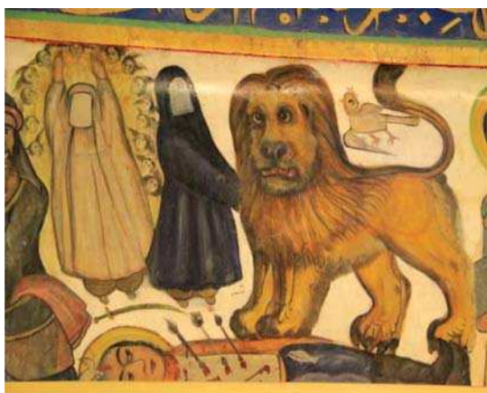
تصویر ۱۰. حضرت فاطمه به همراه شیر و فضا، بقعه شاه‌زید، مأخذ: همان.

بیان نمادین نیز بیش از همه در رنگ‌ها و نشان‌ها نمایان است. نخست در پرده‌های نقاشی در تجلی سیمای قدیسین و معصومین به زبان نمادین از مفهوم رنگ بحث شده و سپس این بیان سمبلیک از پرده‌های نقاشی به نمایش‌های تعزیه و نقاشی‌های دیواری راه یافته‌است. در تعزیه لباس‌های رنگین بر تن موافق‌خوانان و مخالف‌خوانان پوشانده و به شیوه تمثیلی، تضاد و تقابل رنگ را وسیله جداسازی اولیا از اشقیا قرار داده‌اند. کاربرد نمادین رنگ‌ها و نشان‌ها در یک مجلس شبیه‌خوانی بدین‌گونه است که شمر با پیرهن، شالو سربندی سرخو پری ابلق (دو رنگ، سیاه و سفید) یا سرخ بر کلاه‌خودش ظاهر می‌شود. در مقابل حضرت عباس (ع) با ردا و علم سبز، پر سبز بر کلاه‌خود و کمربندی سبز نمایان می‌شود. پرچم‌ها، بیرق‌ها، چادرها و خیمه‌های یزیدیان سرخ‌است و خیمه‌های حسینی سیاه، سبز و یا نیلگون است. شمیریان چکمه‌های قرمز به پا دارند و گاهی نقاب یا دهان‌بندی سرخ بسته‌اند. اسب‌های