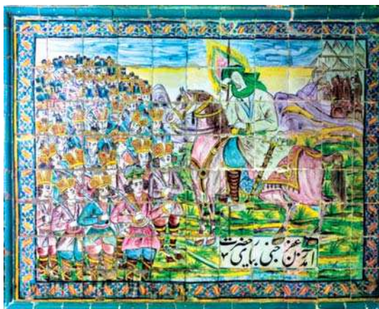
تصویر ۱۹. آمدن زعفرجی به یاری حضرت، تکیه معاون الملک، ۹۶/۸/۱۵. مأخذ: همان.