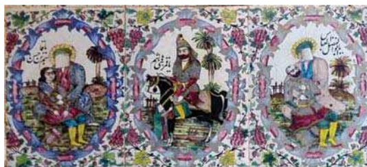
تصویر ۲۵. کاشی‌نگاری مذهبی، تکیه معاون الملک، ۹۶/۸/۱۵، مأخذ: همان.