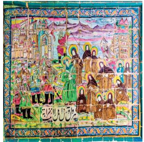
تصویر ۲۲. بیرون آوردن اهل بیت از خرابه، تکیه معاون الملک، ۹۶/۸/۱۵، مأخذ: همان.

با لباس فرنگی تصویر شده‌اند (تصویر ۲۳). در برخی موارد نیز در یک کاشی‌نگاره تصویر دو یا چند واقعه و روایت رزم در هم ترکیب شده و کنار هم تصویر شده، چنان‌که در تصویری امام حسین (ع) در سه صحنه ظاهر می‌شود: در مرکز میدان نعل حضرت ابوالفضل را در بر گرفته، در سمت چپ پایین سوار بر اسب علی‌اصغر را روی دست بلند کرده و اندکی بالاتر، نعل علی‌اکبر را به آغوش کشیده‌است. در بالا و پس زمینه تصویر در هر دو سو انبوهی از صفوف درهم فشرده اشقیاء، سوار بر اسب و پیاده تصویر شده‌اند. در پایین و پیش‌زمینه نیز زنان و اهل بیت در چادرها و نعل شهادت در ترکیبی افقی نمایانده شده‌است (تصویر ۱۶). در کاشی‌نگاره‌ای دیگر رزم سیدالشهدا و حضرت ابوالفضل، هم‌زمان در دو جهت با خیل دشمنان تصویر شده‌است (تصویر ۲۱). از این رو نام کاشی‌نگاره به دو واقعه اشاره دارد و یاد نقاشی دیگر که در نیمه راست آن مختار بر تخت نشسته و در نیمه چپ کفار را قصاص می‌کند. در این کاشی‌نگاره نیز دو نام دیده می‌شود که هریک اشاره به یک روایت و رویداد دارد و به صورت مجزا در دو بخش بالا و پایین کاشی‌نگاره آورده شده‌است (تصویر ۲۴).