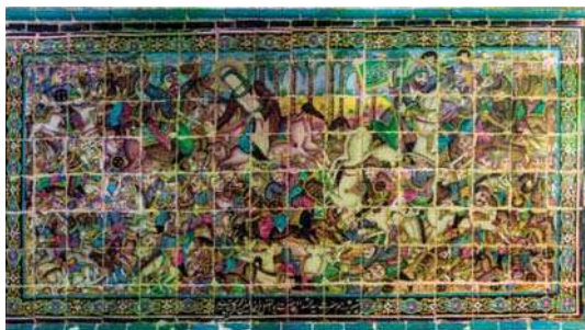
تصویر ۲۱. رزم سیدالشهدا و حضرت ابوالفضل، تکیہ معاون الملک، ۹۶/۸/۱۵، مأخذ: همان.

پایان کاشی‌کاری تکیه براساس منظومه‌ای سروده مرحوم