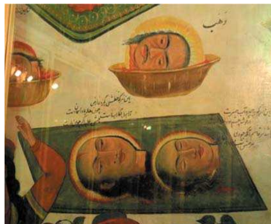
الف. تصویر ۷، بخشی از تصویری ۱، گچ‌نگاری مذهبی، مأخذ: همان.

اشقیا سیاه یا ابلق است و ذوالجنح و اسب‌های اولیا به رنگ سپید هستند. پر سبز زینت بخش مغفر حسینیان و پر ابلق و زرد و سرخ آراینده کلاهخود یزیدیان است. حر به نشانه توبه و علامت تسلیم، پر سپید بر مغفر خویش دارد. شاخه درخت با برگ‌های سبز نماد نخلستان است. خاک نینوا اگر است و بر قبه بارگاه حسین بن علی اکلیل نشانده‌است. ملایک سبزپوشند و زعفر جنی سیاه‌پوش است. دیوارهای دارالجفای شام و دارالاماره عبدالله نیز با کتیبه‌های سرخ آراسته شده‌اند (عنصری، ۱۳۶۶: ۲۴۴-۲۳۷). شبیه امام حسین (ع) لباسی سبز یا سفید و یا ترکیبی از هر دو رنگ با شال و دستار سبز بر تن دارد و همواره اسب او سفید است. شبیه ابن‌سعد لباس‌هایی به رنگ قرمز، قهوه‌ای و یا نارنجی به تن دارد (آریان‌پور و همکاران، ۱۳۹۵: ۷۱-۷۰). اگر چه کاربرد هر رنگ بار معنایی مشخصی دارد و هنرمندان با آگاهی آن را به کار می‌بردند، اما رنگ‌های مورد استفاده برای هر شخصیت همواره ثابت نبوده