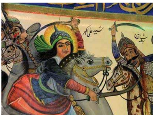
تصویر ۶. رزم حضرت علی اکبر، بقعہ شاہ زید، مأخذ: همان.

از دیگر وجوه اشتراک میان این دو گونه هنری نداشتن وحدت زمانی و مکانی و بیان نمادین است که شاید بتوان آن‌ها را مهم‌ترین ویژگی‌های تأثیرگذار بر ساختار صوری