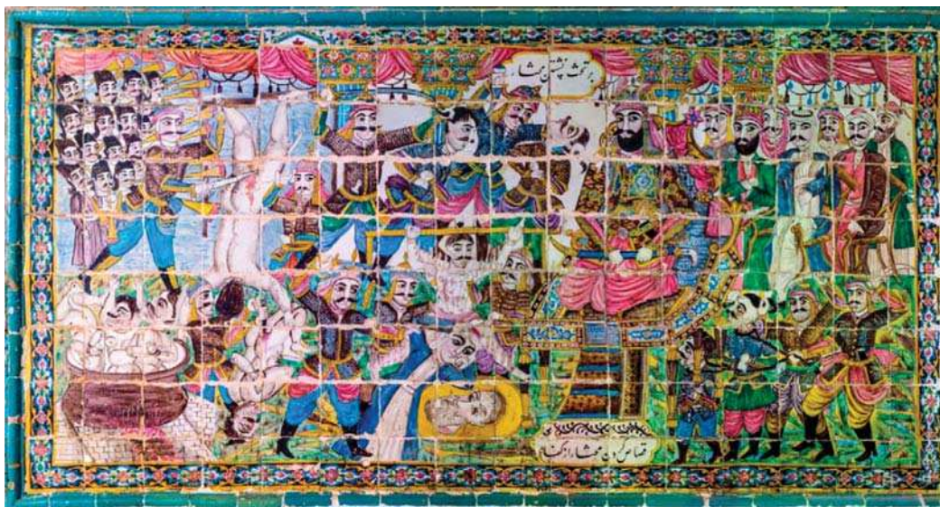
تصویر ۲۴. بر تخت نشستن مختار و قصاص کردن مختار کفار را، تکیه معاون الملک، ۹۶/۸/۱۵، مأخذ: همان.

به طور تقریبی تمامی نقاشی‌های مرتبط با مضمون عاشورا در تکیه معاون در هر اندازه‌ای دارای پس‌زمینه و فضا سازی متناسب با صحنه و روایت تصویر شده چون بنای معماری، عناصر طبیعت و غیره هستند (تصاویر ۲۳ و ۲۲ و ۱۵). همچنین اغلب نقاشی‌ها دارای دو نظام نشانه‌ای تصویری و نوشتاری هستند. حضور عناصر نوشتاری در کاشی‌نگارهای تکیه اندک بوده و تنها محدود می‌شود به نام مهم‌ترین شخصیتی که در واقع نقاشی شرح روایتی با مرکزیت اوست (تصاویر ۲۶ و ۲۵ و ۱۸ و ۱۷)، پرچم‌هایی با آیه‌ای از قرآن (تصاویر ۲۰ و ۲۱) و یا نامی برای صحنه تصویر شده (تصاویر ۲۴-۲۱ و ۱۹ و ۱۵). برخی نیز فاقد هرگونه عنصر نوشتاری هستند (تصویر ۱۶). این نوشتارها به شکلی متمایز از عناصر تصویری و با کادربندی و محدوده مشخص در درون قاب و یا در حاشیه نقاشی و بر روی قاب پیرامون آن نوشته شده‌اند. در مواردی نیز نام صحنه به همراه نام نقاش و یا بیت شعری در یک یا چند قاب مجزا بر روی لبه پایین حاشیه نقاشی آورده شده‌است (تصاویر ۲۳ و ۲۱ و ۱۵). در بالای نقاشی‌های