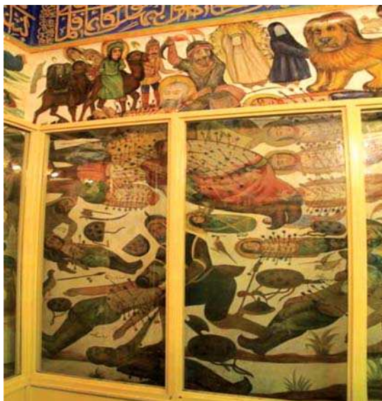
تصویر ۲. شهادت امام حسین (ع) و یارانش، بقعه شاه‌زید

در تعزیه‌ها و نمایش‌های خیال‌پردازی تصویر می‌شد که توسط هنرمندان و با الهام از وقایع به اجرا درآمده در تعزیه‌ها و بهره‌گیری از ویژگی‌های ظاهری تعزیه‌خوانان و اسباب و وسایل آن‌ها با محتوایی مذهبی و مقدس ایجاد می‌شدند (حسینی‌راد و عزیززادگان، ۱۳۹۰: ۳۲). براساس تأثیرپذیری و ارتباط تعزیه و دیوارنگاری مذهبی، وجوه مشترک بسیاری میان آنها ایجاد گردید. موضوعاتی که اغلب در دیوارنگاره‌های مذهبی قاجاری تصویر می‌شدند، موضوعات مذهبی شیعه همچون غیر خم، شمایل و جنگ‌های حضرت علی (ع)، واقعه عاشورا و مصیبت‌های امام حسین (ع) و اهل بیت پیامبر (ص) در آن روز، امام رضا و شفاعت آهوان، بارگاه حضرت سلیمان، داستان‌های یوسف و زلیخا و.. بودند؛ البته مهم‌ترین آنها واقعه کربلا و موضوعات مرتبط با آن بود که موضوع مشترک دیوارنگاره‌های مذهبی و نمایش‌های تعزیه در این دوران نیز بود. قابل توجه این‌که شهادت امام حسین (ع) که از قدیمی‌ترین تعزیه‌ها و محور و اساس همه تعزیه‌ها بوده (شهیدی، ۱۳۸۰: ۲۸۷)، بیشتر تعزیه‌ها پیرامون همین واقعه اجرا گردیده‌اند، اصلی‌ترین موضوع دیوارنگاره‌های بقاع متبرکه و نقاشی‌های درون تکیه‌ها و حسینیه‌ها نیز بود (حسینی‌راد و عزیززادگان، ۱۳۹۰: ۳۶). تعزیه شهادت امام حسین (ع) در تعزیه‌خوانی‌های نخستین، با نام تعزیه «هفتاد و دو تن» اجرا می‌شده‌است. به تدریج شهادت هر یک از شهیدان به صورت تعزیه مستقلی درآمد (شهیدی، ۱۳۸۰: ۲۸۷) و در هر روز یکی از آنها خوانده و اجرا می‌شد. گفتار و کلام در تعزیه به زبان شعر و آهنگین بود. تعزیه‌خوانان نخست اشعار تعزیه را از دیوان‌ها، کتاب‌ها و جنگ‌های