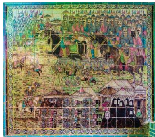
تصویر ۱۶. امام حسین (ع) در کربلا، تکیه معاون الملک، ۹۶/۸/۱۵.