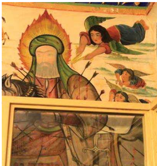
تصویر ۱۳. رزم سیدالشہد، بقعہ شاہ زید

ثبات هستند، از تراکم عناصر و هیجان تصویر کاسته شده و حالتی از اندوه، سکون و مظلومیت نمایان است و متون نوشتاری جایگزین عناصر تصویری گشته تا آنها را در رساندن مفاهیم یاری نمایند (تصاویر ۹-۷). عناصر تصویری و نوشتاری متناسب با بیان عاطفی و برانگیختن احساسات و هیجانات مخاطبان به کار رفته است.