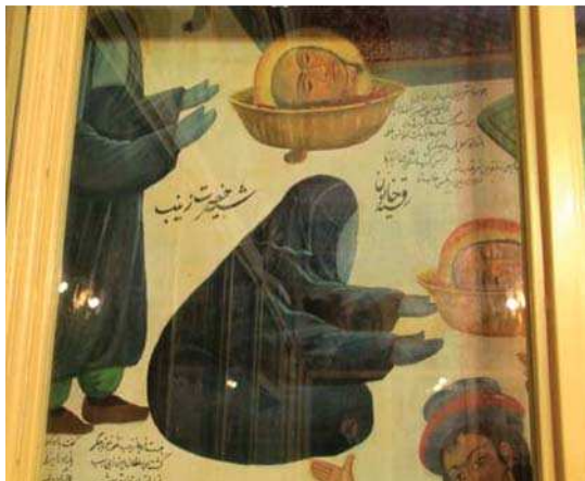
ب. تصویر ۸، بخشی از تصویری ۱، گچ‌نگاری مذهبی، مأخذ: همان.