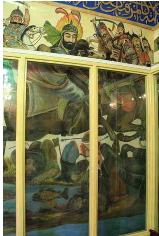
تصویر ۱۲. رزم حضرت ابوالفضل در کنار فرات، بقعه شاه‌زید، مأخذ: همان.

عدم وحدت زمانی و مکانی، در نقاشی‌های امام‌زاده با درهم آمیزی روایت‌ها و وقایع و حضور شخصیت‌ها و موجوداتی خارج از واقعیت تاریخی واقعه کربلا نمایانده شده که حاصل خلاقیت و تخیل نقاش و تأثیرپذیری او از نمایش‌های تعزیه است. چنانکه در تصاویر حضرت فاطمه (س) به همراه فضه و شیر تصویر شده‌اند (تصاویر ۲ و ۱۰) و یا در صحنه رزم سیدالشهدا (تصویر ۱۳) و شهادت حضرت علی‌اصغر (تصویر ۱۴) فرشته‌های بال‌دار دیده می‌شوند. همچنین در میان تصاویر افرادی با پوشش و کلاه فرنگی نقاشی شده‌اند (تصاویر ۷ و ۸). امام حسین (ع) و حضرت ابوالفضل نیز در صحنه‌های مختلف و بیش از یک‌بار تصویر شده‌اند. فقدان قاب‌بندی و عدم تفکیک نقاشی‌ها، ترکیب‌بندی و فضای آن‌ها را آشفتگی کرده‌است (تصویر ۱۱). از این‌رو درک و دریافت روایت نقاشی‌ها در نگاه نخست اندکی دشوار و مبهم است. اما بنا به همین پیوستگی نقاشی‌ها در شاه‌زید می‌توان آن را یک نقاشی گسترده در نظر گرفت که روایت‌ها و وقایع گوناگونی در آن تصویر گردیده و نمونه وسیعی از عدم وحدت زمانی و مکانی است. همچنین به‌کارگیری عناصر مورب و متحرک، ازدحام پیکره‌های انسانی و حالت تهاجمی و پرتحرک آنها در بخش‌هایی که به صحنه‌های نبرد و پیکار پرداخته، بر تراکم عناصر و هیجان ترکیب‌بندی افزوده است تا تنش، هیجان و دشواری را به مخاطب انتقال دهد (تصاویر ۱۲ و ۴). اما در بخش سرهای بریده شهدا، عناصر تصویری در حالت افقی و