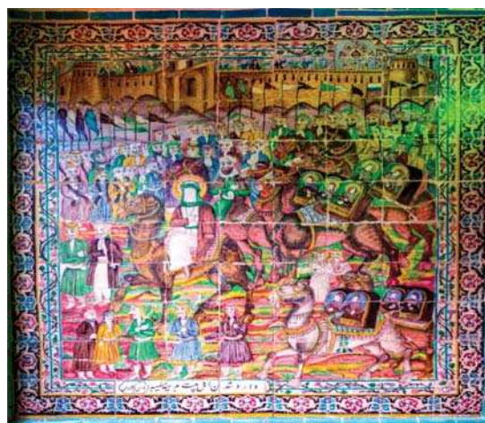
تصویر ۱۵. ورود اهل بیت به مدینه، تکیہ معاون الملک، ۹۶/۸/۱۵.

یزید با لباس سرخ و فرنگیان نیز با کت‌های قرمز تصویر شده‌اند. ابن سعد با لباس‌های قرمز و قهوه‌ای و اسب ابلق است. زنان اهل بیت با چادرهای سیاه و روبندهای سفید بدون چهره‌پردازی تصویر شده‌اند. امام سجاد (ع) با پوشش سبز و حضرت قاسم (ع) با لباس سبز و سیاه و دستار سبز سوار بر اسبی قهوه‌ای تجسم یافته‌اند (تصاویر ۴ و ۳). حضرت علی اکبر (ع) با لباس سرخ و دستار سبز سوار بر اسبی سفید تصویر گردیده است (تصویر ۶).