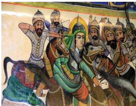
تصویر ۴. رزم حضرت قاسم، بقعہ شاہ زید مأخذ: همان.