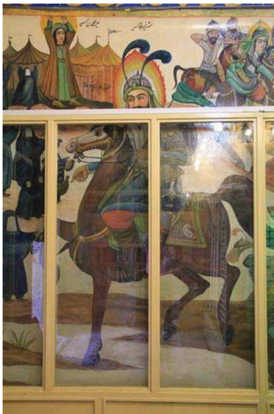
تصویر ۱۱. وداع حضرت ابوالفضل با اهل بیت، بقعه شاه‌زید، مأخذ: همان.

و گاه برای یک شخصیت رنگ‌ها و نشان‌های متفاوتی به‌کار رفته‌است. چنان‌که در دیوارنگاره‌ها گاه پرهایی به رنگ سرخ یا سفید و یا ابلق (سرخ و سفید) برای حضرت عباس (ع) ترسیم شده که مشابه آن در شمایل‌نگاری‌ها و نقاشی‌های قهوه‌خانه‌ای دیده می‌شود (قاضی‌زاده، ۱۳۸۵: ۶۲ و ۶۰) و گاه به جای دو پر جفت تنها یک پر تصویر شده‌است. انعکاس این ویژگی‌ها و زمینه‌های مشترک با تعزیه را می‌توان در دیوارنگاره‌های به جای مانده از آن دوران مشاهده نمود. بدین منظور به خوانش و سپس تطبیق نقاشی‌های با مضمون واقعه کربلا در گچ‌نگاره‌های بقعه شاه‌زید و کاشی‌نگاره‌های تکیه معاون‌الملک، از آثار برجسته و اواخر قاجار، پرداخته می‌شود.