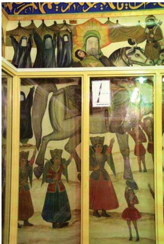
تصویر ۱۴. شهادت حضرت علی اصغر، بقعہ شاہ زید، مأخذ: همان.