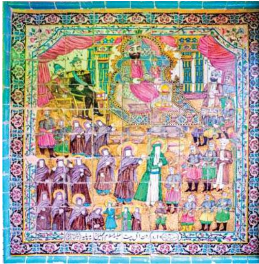
تصویر ۲۳. وارد کردن اهل بیت به مجلس یزید، تکیه معاون الملک، ۹۶/۸/۱۵، مأخذ: همان.