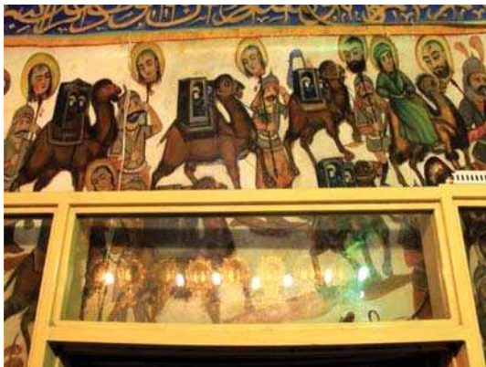
تصویر ۵. کاروان اسرای اهل بیت، بقعہ شاہ زید، مأخذ: همان.