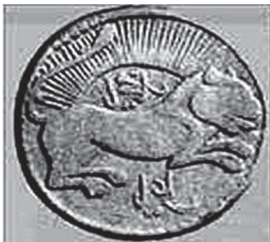
تصویر ۱۷. نقش شیر همراه با خورشید بر روی یک سکه طلای بیست تومانی متعلق به دوره قاجار