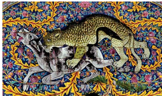
تصویر ۱۱. کاشی نگاره سردر عمارت باغ ارم با موضوع باستانی گرفت و گیر

در دو طرف پیشانی عمارت قرار گرفته اند، صحنه جدال بین ببر و گاو را به تصویر کشیده است. تسلط و برتری نقوش اسلیمی درشت با رنگ زرد و سبز بر زمینه نقوش گیاهی و گل‌های ظریف و ریز زمینه غلبه ببر را تداعی می‌کند. (تصویر ۱۱ و ۱۲) این جدال احتمالاً برگرفته از صحنه نبرد شیر با گاو، یکی از نقوش برجسته‌های تخت جمشید است که به عقیده رومن گرشمن ۱ ، این نقش گویای تغییر فصول سال، از نیم سال سرد به به نیم سال گرم و به بیان دیگر بازگو کننده حلول بهار است. (تصویر ۱۳)