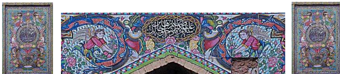
تصویر ۳۰. کاشی‌کاری هفت رنگ ورودی بقعه سید تاج الدین غریب، تصاویر فرشتگان بالدار با لباس‌های پوشیده در حال حمل و نگهداری گل و گلدان‌ها، مأخذ: همان