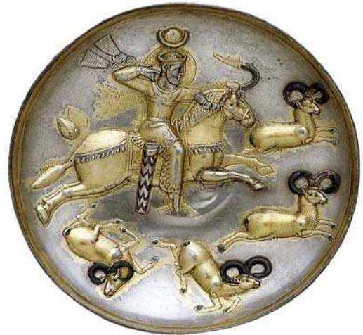
تصویر ۲۵. بشقاب نقره دوره ساسانی، شاه پیروز اول در حال شکار قوچ، مأخذ: دیویس و دیگران، ۱۳۸۸: ۴۴

تصویر نگاری پادشاهان و شاهزادگان از سنت‌های ایران باستان است. در سردر باغ ارم و عقیق آباد نقاشی‌هایی با موضوع پادشاهان ایران در دوره قبل و بعد از اسلام قابل مشاهده است. در نقاشی باغ ارم بر روی کاشی هفت رنگ، به شیوه اروپایی و متأثر از هنرمندان آن سعی در واقع نمایی دارد و ناصرالدین شاه را با لباس آبی رنگ و زیورآلات خاص شاهی، سوار بر اسب سفید در زمینه ای با منظره طبیعی به تصویر کشیده است. (تصویر ۳۱) در کاشی نگاره باغ عقیق آباد نیز تصویر پادشاهان ایرانی (هخامنشی و ساسانی) در مراسم تاج گذاری قابل مشاهده است. (تصویر ۳۲) در نتیجه ترسیم تصویر شاهان در دوره قاجار به صورت ایستاده یا سوار بر اسب، نشسته همراه با عصا و شمشیر در تزیین بناها به یکی از متداول‌ترین رسوم در کاشی کاری مبدل شده بود. پادشاهان قاجار به خصوص فتحعلی شاه و ناصرالدین شاه که دوره زمامداری شان طولانی بوده، در پی شکوه