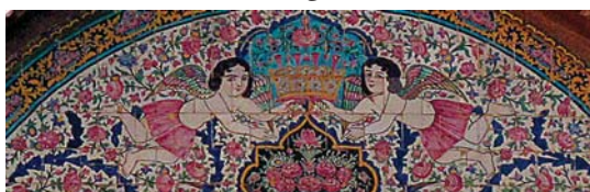
تصویر ۲۸. کاشی‌کاری هفت رنگ سردر نارنجستان قوام، تصویر دو فرشته بالدار با تاجی مزین به مروارید

بر اساس پژوهش‌های انجام شده در شش بنای شاخص دوره قاجار در شیراز، تزیینات کاشی سردرها قابل تفکیک در چهار حوزه موضوعی اساطیری، سیاسی، مذهبی و نمادین است. که با توجه به ماهیت کاشی‌کاری سردر بنا، این نقش‌ها بازگو کننده ویژگی‌های هنر قاجاری و نشان از هویت و فرهنگ قاجار است. در مجالس اساطیری و سیاسی این دوره، داستان فتح یک قسمت، یک جنگ خاص و همچنین تصاویر رزم‌های اساطیری و قهرمانان متداول تر بوده است. در این دوره شاهان قاجار نیز، پیکره نگاری را ابزاری مناسب برای ارتقای مقام سلطنتی