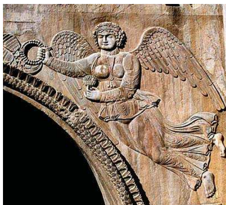
تصویر ۲۹. نقش برجسته طاق بستان با نقش الهه پیروزی یا فرشته بالدار، مأخذ: همان