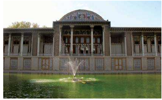
تصویر ۴. نمای روبرو از ضلع شرقی باغ عفیف آباد، تاجگذاری یکی از پادشاهان ساسانی