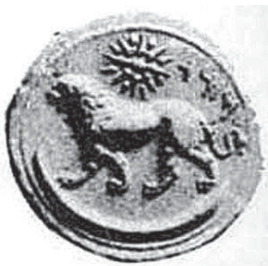
تصویر ۱۶. سکه ای متعلق به زمان پادشاهی داریوش سوم دوره هخامنشیان، مأخذ: جمال زاده، ۴۵-۱۳۴۴، ۶

در هنر و کیش هخامنشیان، شیر نماد میترا بوده و در آیین مهر پرستی نیز مقام ویژه ای داشته است. در دوره هخامنشی و ساسانی نقش شیر اهمیت ویژه ای داشته و برای نشان دادن قدرت و نیروی پادشاه اغلب او را در حال مبارزه و شکار شیر نشان داده‌اند. این نقش از دوره غزنویان به بعد گاهی در ترکیب با خورشید دیده می‌شود. به ویژه از دوره صفوی به بعد این ترکیب تصویری را بسیار می‌بینیم و در دوره قاجار به نشان رسمی دولت