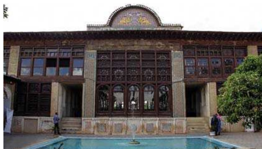
تصویر ۷. نمای روبرو از ضلع شرقی خانه زینت الملوک، شیراز

رو به شمال قرار گرفته و شامل کاشی‌کاری بر دیواری مرتفع است که نقوش متنوعی را در بر گرفته است. در قسمت‌های دیگر ورودی نیز کاشی هفت رنگ استفاده شده و بر روی آنها تصاویر فرشتگان، گل و مرغ و نقوش منظره و تصاویری از وقایع کربلا در قاب‌های دایره‌ای، مستطیل و بیضی شکل در طرح‌های زیبا نقش بسته است. بر روی برخی از آنها نیز آیات قرآنی و احادیث به خط ثلث نگاشته شده و در پایان نیز تاریخ ۱۳۱۰ ه.ق قید شده است. این بقعه در سال ۱۳۸۰ با شماره ۴۵۱۳ در فهرست آثار ملی به ثبت رسیده است. (کمالی سروستانی، ۱۳۸۴: ۹۸-۹۷؛ تصویر ۱۰)