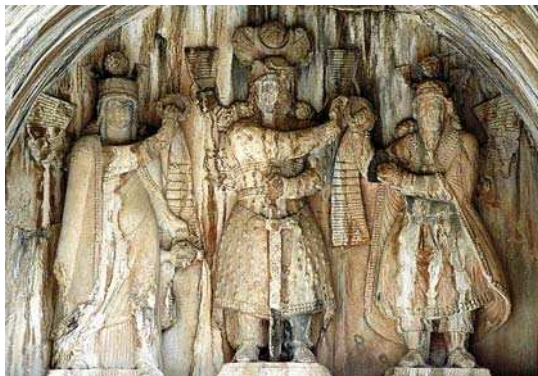
تصویر ۲۲. سنگ نگاره طاق بستان با نقش تاج شاهی و پرچم، تاج گذاری خسرو پرویز، دوره ساسانی، مأخذ: همان