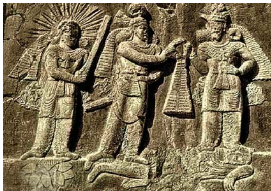
تصویر ۲۱. سنگ نگاره طاق بستان، مراسم تاج گذاری اردشیر دوم، دوره ساسانی

مهمی در زندگی و هنر انسان‌ها داشته است. از نقوش تکرنگ انسان‌های اولیه گرفته تا نقوش حک شده بر صخره‌های ساسانی و نقاشی‌ها و نقش برجسته‌ها دوره اسلامی، صحنه شکار و شکارگاه وجود دارد، خواه بر روی کاشی‌های هفت رنگ، گچ، سقف‌ها و یا روی زمینه چوب و غیره. (نه اورا، ۱۳۸۳: ۱۵۸) برای مثال بشقاب شکار کوچ از آثار دوران ساسانیان، ۴۵۷ تا ۴۸۳ م، که در موزه متروپولیتن، نیویورک، بنیاد فلچر ۲ نگهداری می‌شود. این بشقاب ساخته شده از نقره، حکاکی، برجسته کاری و مرقع کاری شده با قطر ۲۱/۹ س م و ارتفاع ۴/۶ س م، شاه پیروز اول را در حال شکار آهو (قوچ) نشان می‌دهد. (دیویس و دیگران، ۱۳۸۸: ۴۴؛ تصویر ۲۵) همانطور که در سردر خانه زینت الملوک مشاهده می‌شود، صحنه‌هایی از شکار بر روی کاشی هفت رنگ به تصویر کشیده شده است. (تصویر ۲۶) شکارچیان اغلب با سلاح‌های گرم (تفنگ) و با لباس‌های محلی (فارس) در حالت‌ها و فیگرهای متنوع مشغول به شکار آهو و حیوانات دیگر هستند. (شکوهمان و شیرازی، ۱۳۸۹: ۳۷)