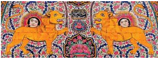
تصویر ۱۹. کاشی‌کاری سردر عمارت نارنجستان قوام با نقش شیر و خورشید

نشان داده شده است. (شکوهیان و شیرازی، ۱۳۸۹: ۳۲) بنابراین می‌توان گفت: نماد شیر در دوره قاجار نسبت به دوره‌های قبل از خود از نظر معنایی و شکلی، دچار کمی استحاله می‌شود و معنای سیاسی و حکومتی آن، کاربردش را در سردر بناهای عمومی رواج می‌دهد.