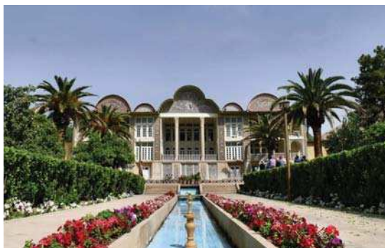
تصویر ۱. نمای روبرو از ضلع غربی باغ ارم، قاجاریه

قاجار، کاربرد شیوه کاشی هفت رنگ همراه رنگ آمیزی زیر لعاب روش غالب بوده است. (کاربونی و ماسویا، ۱۳۸۱: ۱۱) از خصوصیات مهم کاشی های زیر لعابی دوران قاجار تنوع رنگ، تنوع نقش ها، برجسته بودن و کاربردهای مختلف آن است. طیف رنگ‌ها گسترده بود و علاوه بر رنگ های استفاده شده در دوره های قبل، از رنگ های جدیدی نیز استفاده می شده است. (۲۲۲ Fehevvari 2000)، این شیوه و ویژگی های آن روی کاشی های هفت رنگ بناهای شاخص شیراز نیز تکرار شده است. تأکید هنر قاجار بر موضوعات مرسوم در هنر