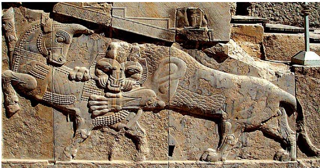
تصویر ۱۳. نقش برجسته هخامنشی، تخت جمشید، نبرد حیوان با حیوان (گرفت و گیر)

برخی نبرد بین این دو حیوان را به ستیز بین فصل‌ها تعبیر کرده‌اند. صحنه گرفت و گیر (جدال بین خیر و شر) که بر سردر باغ ارم و نارنجستان قوام به صورت قرینه