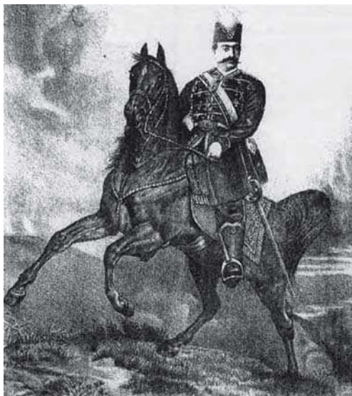
تصویر ۳۳. ناصرالدین شاه قاجار، تصویر چاپ سنگی شماره دوازدهم، روزنامه شرف.

حاکم بر جامعه خویش اند، از این رو نه تنها از نظر زیبا شناختی قابل تحسین اند، بلکه پیام آور تصویری، از پیشینه کهن ایران زمین‌اند. به طور کلی کاشی‌کاری سردربناهای شیراز در دوره قاجاریه، با عناصر و جزئیات فراوان، متنوع به لحاظ رنگ و نقش و بسیار ارزشمند، پدیده ای می‌باشند که توجه