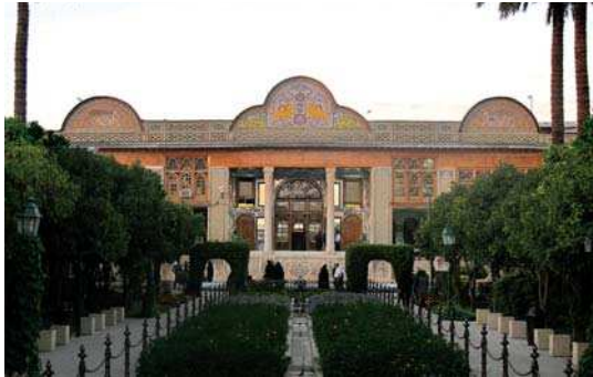
تصویر ۵. نمایی روبرو از عمارت نارنجستان قوام