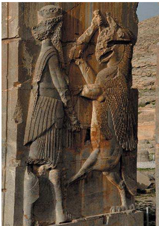
تصویر ۱۵. نقش برجسته هخامنشی، تخت جمشید، نبرد انسان با حیوان اساطیری (نبرد خیر و شر)