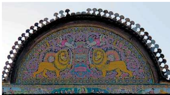
تصویر ۸. کاشی نگاره سردر زینت الملک با نقش شیر و خورشید و ۳ مجلس با موضوع شکار شکارچیان و داستان نارنج و ترنج حضرت یوسف و زلیخا، مأخذ: همان