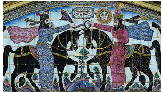
تصویر ۳۲. کاشی‌کاری هفت رنگ سردر ورودی و عمارت باغ عقیق آباد، تصاویر پادشاهان ایران باستان، مأخذ: همان