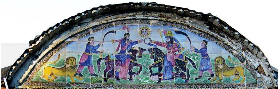
تصویر ۳. سردر عمارت باغ عفیف آباد، مجلس تاج گذاری پادشاه ساسانی

شیراز به دلیل سابقه تاریخی در تأثیر پذیری فرهنگ غربی، نقش اول را ایفا می‌کند. اما اغلب کاشی‌کاری‌های شیراز به خصوص بناهای نام برده، را کاشی‌های تصویری با مضامین ججاری‌های تخت جمشید و نقوش برجسته ساسانی تشکیل می‌دهد. تا پایان دوره قاجار در مکتب نگارگری شیراز مضامین کتاب‌های ادبی کلاسیک ایران همچون هزار و یک شب، شاهنامه، پنج گنج نظامی، دیوان حافظ و آثار سعدی، همچنین قصص قرآنی چون داستان یوسف و زلیخا، ملک سلیمان و ... همواره مد نظر هنرمندان نگارگر شیراز بوده و در کاشی‌کاری بناهای شیراز به وفور از این نگاره‌ها و داستان‌ها استفاده شده است. استفاده از کاشی در نماهای بیرونی به صورت گسترده رواج داشت. توجه به رنگ‌های شاد به ویژه طیف قرمز و تأکید بر عنصر انسانی در نگاره‌ها از ویژگی‌های مکتب شیراز است. (ریاضی، ۱۳۹۵: ۵۱) کاشی‌های شیراز از نظر کیفیت و طراحی خام دست ترند، اما سرزندگی،