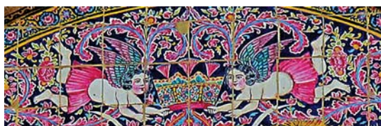
تصویر ۲۷. کاشی‌کاری هفت رنگ سردر خانه زینت الملک، تصویر دو فرشته بالدار با تاجی مزین به مروارید