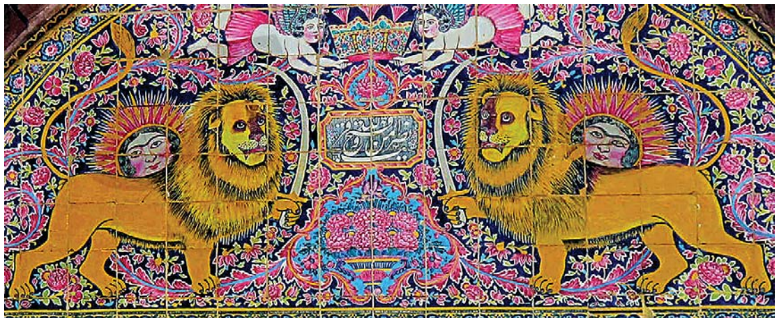
تصویر ۲۰. کاشی‌کاری سردر عمارت زینت الملک با نقش شیر و خورشید

در سردرهای باغ عفیف آباد، نارنجستان قوام و خانه زینت الملوک، نقش شیر شمشیر به دست همراه با خورشید و تاج شاهی به صورت قرینه ترسیم شده است. (به ترتیب تصویر ۱۸ و ۱۹ و ۲۰) خورشید دارای چشم و ابرو، به شکل زن، و شیر در حالی که بدن آن نیم رخ و سر تمام رخ، سه رخ و نیم رخ است با شمشیری در دست تصویر شده است. مانند سایر نقاشی‌ها، نیمی از خورشید پشت شیر قرار گرفته و شعاع‌های نور به صورت خطوط