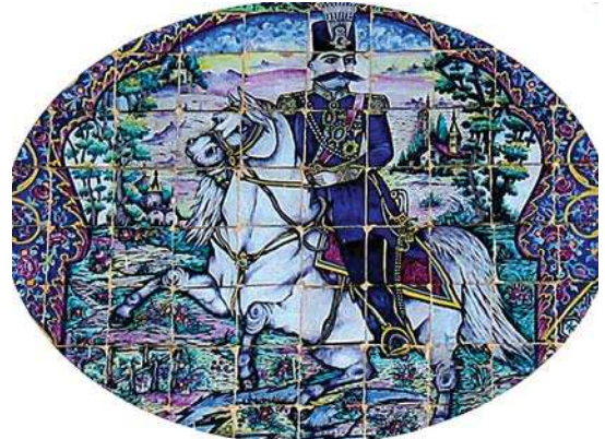
تصویر ۳۱. کاشی‌کاری هفت رنگ سردر عمارت باغ ارم، تصویر ناصرالدین شاه قاجار سوار بر اسب

بر این اساس در مقاله حاضر، نقوش سردر بناهای