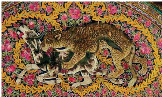
تصویر ۱۲. کاشی نگاره سردر عمارت نارنجستان قوام با موضوع باستانی گرفت و گیر