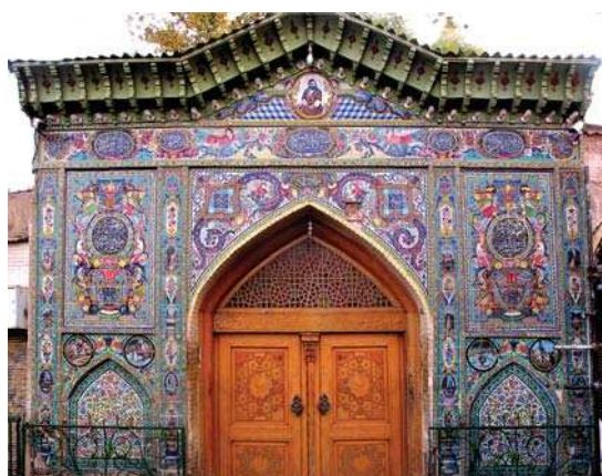
تصویر ۱۰. ورودی بقعه سید تاج الدین غریب

از بقاع متبرکه شیراز است که پیش از دوره قاجاریه در نزدیک دروازه کازرون احداث شده است. این بقعه، آرامگاه جعفر بن فضل بن جعفر بن علی ابن ابی طالب (ع) ملقب به «تاج الدین» و «غریب» است. ورودی این بقعه،