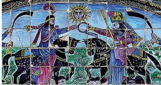
تصویر ۲۳. کاشی‌کاری سردر ورودی باغ عفیف آباد با نقش تاج شاهی و پرچم در دست پادشاهان ایران

شکار و شکارگاه از دیرباز مورد توجه انسان‌ها بوده است، گاه به دلیل رفع نیازهای اولیه و گاه تفریح و تفرج و گاه به عنوان نشان قدرت و توانایی. این موضوع نقش