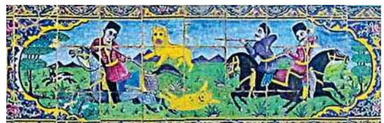
تصویر ۲۶. کاشی‌کاری هفت رنگ سردر خانه زینت الملک، صحنه شکار شکارچیان در شکارگاه با پس زمینه مناظر طبیعی، مأخذ: