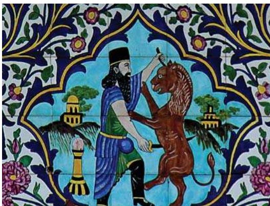
تصویر ۱۴. کاشی‌کاری هفت رنگ سردر عمارت باغ ارم، تصویر پادشاه هخامنشی در حال نبرد با حیوان اساطیری (نبرد خیر و شر)

نقاش به اساطیر را به خوبی نشان می‌دهد. همان گونه که در تصویر ۱۵، نقش برجسته ای از دوران هخامنشیان در تخت جمشید، نبرد انسان با حیوان ترکیبی با سر، بال، پای عقاب و تنه شیر و دم عقرب (نبرد خیر و شر)، قابل مشاهده است.