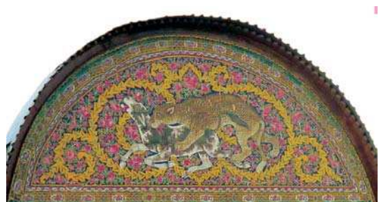
تصویر ۶. سردر عمارت نارنجستان قوام با نقش شیر و خورشید در هلالی وسطی و نقش اساطیری گرفت و گیر در هلالی‌های طرفین