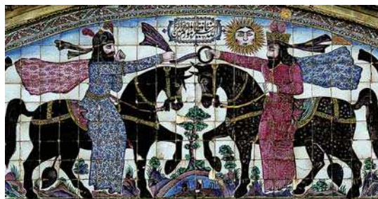
تصویر ۲۴. کاشی‌کاری سردر عمارت باغ عفیف آباد با نقش تاج شاهی و پرچم (مراسم تاج گذاری)

یکی از نقوشی که در سردر خانه زینت الملوک، نارنجستان قوام و بقعه سید تاج الدین غریب وجود دارد، تصویر