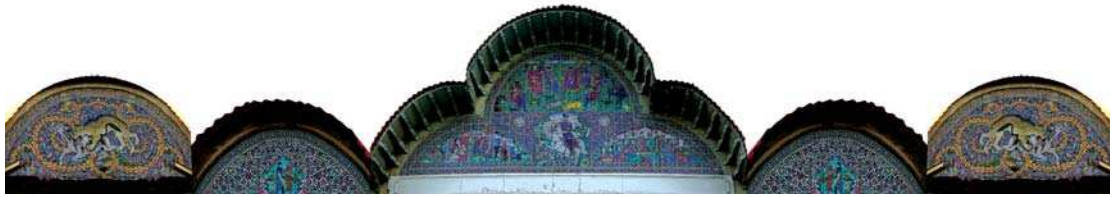
تصویر ۲. هلالی وسطی با ۳ مضمون بارگاه حضرت سلیمان، خسرو شیرین و یوسف و زلیخا، هلالی کناری آن نبرد خیر و شر و گرفت و گیر را به تصویر کشده است.

نشاط و نوآوری در آنها موج می‌زند. (همان: ۵۲) در کاشی‌کاری سردر بناهای شیراز در دوره قاجاریه که اغلب هلالی شکل هستند، تحولی از لحاظ رنگ و موضوع در کاشی‌کاری پدید می‌آید و نقوش ایجاد شده بر روی کاشی سردرها با ابعاد بزرگ و همگی تحت تاثیر نقاشی‌های قاجاری و با الهام از «عکاسی قاجاری»، «چاپ سنگی» و «نقاشی قهوه خانه ای» بوده است.