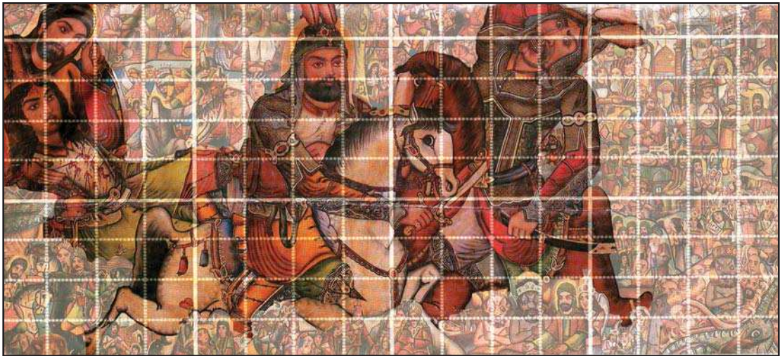
تصویر ۲. تجزیه و تحلیل پرسپکتیو مقامی، مأخذ: نگارندگان.

جایگاه شخصیت‌ها در تصویر نسبت به مقام آنها تعیین شده است. به‌طور مثال در صحنه‌های جنگی افراد سپاه را به یک اندازه در نقاط مختلف اثر بطور منسجم و یا پراکنده، بدون استفاده از پرسپکتیو و یا ضد پرسپکتیو، به تصویر می‌کشیدند؛ به جز مواردی استثنائی که شاه و یا شاهزاده‌ای را در میان آنان به تصویر درآورده اند. در چنین صورتی شخصیت اصلی تا حدودی بزرگتر و در فضائی باز و گسترده تر نقش می‌گردد. این مسأله نه تنها در به تصویر کشیدن شخصیت‌های یک اثر بکار گرفته می‌شود، بلکه دیگر جانداران نیز بخصوص اسب را که در زیر پایشان داشتند، در بر می‌گرفت. (کاشفی، ۱۳۶۴ و ۱۳۶۵: ۲۴). این فضا بندی خود باعث تعیین و مشخص نمودن مرکز دید و توجه می‌گشت؛ آنها فضای گسترده را برای بزرگان و فضای درهم فشرده را برای افراد کوچک در نظر می‌گرفتند. (تصویر ۲)