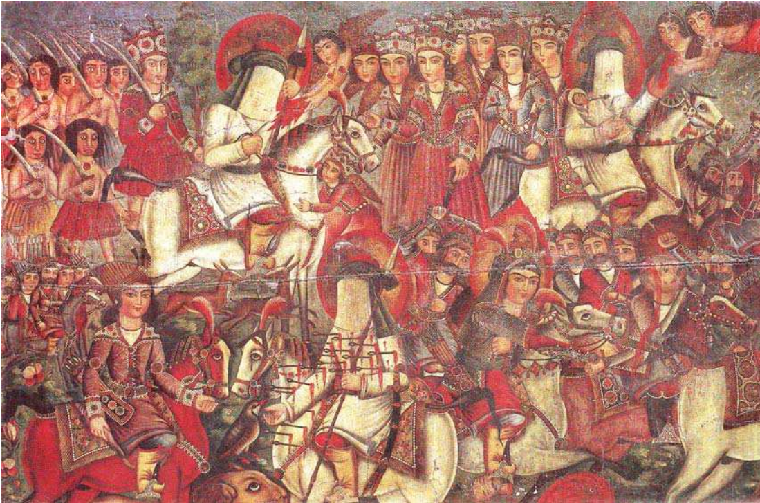
تصویره. قسمتی از یک پرده درویشی، میرزا مهدی نقاش شیرازی، رنگ و روغن روی بوم، سند ۱۲۸۱، ۱۲۸-۱۹۸، مجموعه فرهنگی سعد آباد.

داده می‌شود. نه به عنوان ماده‌پر کننده فضا بلکه به مثابه توسعه‌دهنده آن (Pavis, 2004:189). ریچاردسون و جانستن معتقدند که فضا در تئاتر دارای چندین سطح است: «در یک طبقه بندی عام، فضای تئاتر مرتبط با معماری ساختمان تئاتر است. فضای تئاتر در مفهوم تاریخی خود یک عبارت عام است در حالی که فضای صحنه، عبارتی خاص تلقی می‌شود که بیشتر با طراحی صحنه، اکسسوار و دکور سرو کار دارد. محیط نمایشی که دغدغه‌های سه بعدی و فضایی هر نمایش خاص را شامل می‌شود، با ویژگی‌های دینامیک اجرا و عناصری که پدید آورنده تأثیر ویژه نمایش بر تماشاگر است مرتبط است (Richardson & Johnston, 1991:113). در یک وضعیت آرمانی رابطه بازیگر و تماشاگر زمانی به حد اعلای خود می‌رسد که این دو محیط (نمایشی و فیزیکی) در بهترین حالت تعاملی خود باشند. (سرسنگی، ۱۳۹۲: ۵۷). در پردهخوانی محیط نمایشی و محیط فیزیکی برهم منطبق‌اند؛ پردهخوان محیط فیزیکی را بر اساس محیط نمایش انتخاب می‌کند از این رو است که این دو فضا از هم تفکیک‌ناپذیر می‌شوند. این امر به معنی این است که در پردهخوانی محیط فیزیکی در تعامل با چشم‌انداز، مرزهای بصری را از پرده و محیط اجرایی تا پس زمینه دور دست (Extreme Longshot) گسترش می‌بخشد؛ جایی که