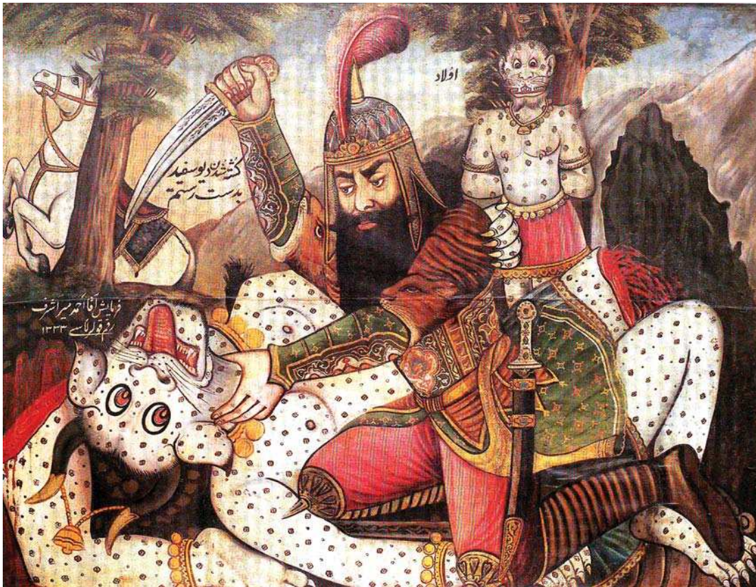
تصویر ۳. کشته شدن دیو سفید به دست رستم، حسین قولر آقاسی، ۱۳۳۳، ۱۰۵۴-۱۹۷/۵، مجموعه رضا عباسی.

نوع مذهبی آن) نشانه شهادت است. رنگ قرمز نشانه خشم و غضب بر دشمن و رنگ‌های تیره و کدر نشانه سپر، یراق و چهره کافران است، مانند مصیبت کربلا از قولر آقاسی. رنگ سبز جایگاه پهلوانان و یلان مورد علاقه و احترام مردم است، مانند نبرد رستم و اشکبوس (جنگ هفت لشکر) رقم آقاسی (ساریخانی، ۱۳۸۴: ۱۱۷). به این ترتیب در نقاشی قهوه‌خانه‌ای هارمونی رنگ‌های مکمل و تضاد میان رنگ‌های تیره و روشن دیده می‌شود.