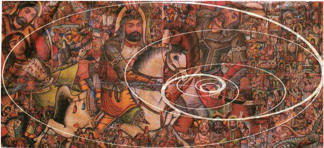
تصویر ۴: تجزیه و تحلیل ترکیب بندی در تصویر ۱.

لحاظ موضوع و فرم، مخاطب تصویر را به صورت یک کل واحد می‌تواند ببیند که در فضا جابه‌جا می‌شود و دگرگونی یا خطای باصره جالب توجهی پدید می‌آید زیرا فقط لبه‌ها (به گونه منفی) سطح‌های گوناگون را پدید آورده و حدود فضایی این سطح‌ها مشخص نگردیده است. قرار گرفتن تصویری بر روی تصویری دیگر در پرده‌ها می‌تواند به وسیله خطوط مرزی مشخص و تنالیت‌های تیره و روشن ایجاد گردد. در پرده نقاشی سطح‌های مختلف واقعیت، درونی و بیرونی، دور و نزدیک، دیدنی‌ها و حس کردنی‌ها درهم نفوذ می‌کنند و به طور هم‌زمان بازنمایی می‌شوند. بنابراین پرده نسخه برداری دقیق از طبیعت نیست، بلکه کنایه‌ای تصویری و یا تشابه صوری، احساسی است که در ضمیر کلی نهفته بود و ناگهان به صورت تجدید خاطره‌ای خواب گونه برای تماشاگر خودنمایی می‌کند (همان: ۷۵). نقاش، سازمانی دقیقاً محاسبه شده از سطح‌های تصویری و نظامی از روابط فضایی را کشف کرده و آن را به طرز منطقی که ناظر به عناصر تصویری است و با بهره‌گیری از تضادهای نور و سایه عرضه می‌دارد. نقاش سعی دارد واقعیت را در تمامیت آن نمایش دهد و این کار را به وسیله خطوط نیرومند و پویایی که از امکانات جنبندگی نهفته در شیء بیرون می‌کشد بیان می‌کند. شیء متحرک (عناصر تصویری در مجالس مختلف پرده‌خوانی) در پرده به لحاظ بصری با محیط خویش در ارتباط است و کلیتی واحد را به وجود می‌آورد. نفوذ محیط در شیء سبب تکمیل یا تحریف واقعیت شیء و هم‌زمانی حرکت، فرم و فضا می‌گردد (آرناسون، ۱۳۸۵، ۱۸۴). (تصویر ۴)