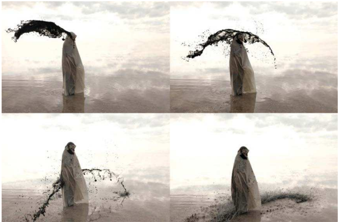
تصویر ۷. تاراگودرزی (۱۳۸۸)، از مجموعه پیشکش، دریاچه ارومیه، عکاس: شهرناز زرکش، مأخذ: آرشیو شخصی هنرمند.