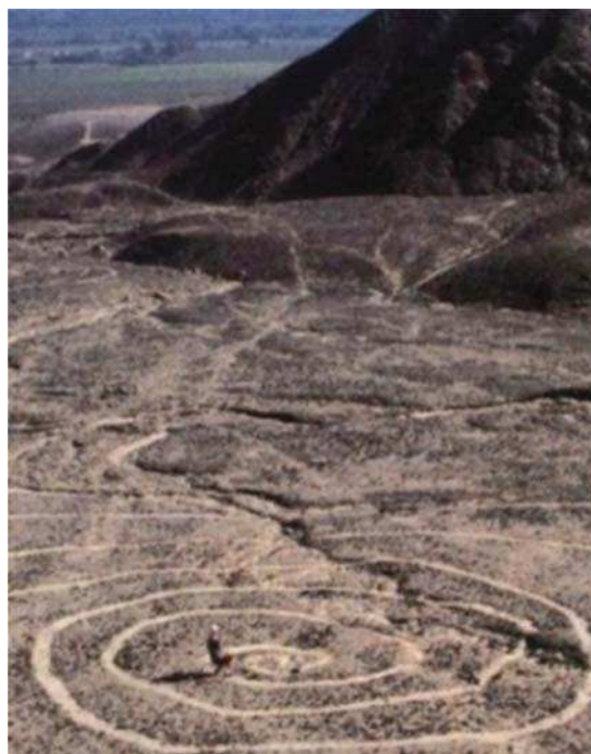
تصویر ۱ و تصویر ۲. خطوط طراحی شده توسط نازک‌کاه، پرو، مأخذ: Amiziev, 1999. (ش. ۱۳۷۸)

عکاسی و بکارگیری زاویه باز و بسته برای بدست آوردن نتایج بهتر در درک و تفهیم یک عکس یا تصویر. هنگامی که مخاطب عکسی را که با زاویه بسته گرفته شده است را مشاهده می‌کند، این فریم از تصویر او را تشویق می‌کند که بیشتر تمرکزش بر روی موضوع یا فرم مورد نظر باشد تا قاب تصویر. (Gorden, 2004) این نشان می‌دهد که ترکیب بندی برای معرفی یک تصویر و مفاهیمی که تصویر ارائه شده در بر دارد بسیار حائز اهمیت است. یک ترکیب بندی خوب چشمان مخاطب را برای جستجوی مفاهیم مطلوب و مورد نظر در عکس تشویق می‌کند. در مبحث عکاسی و کاربرد ترکیب بندی بهتر است عکاسان با این شاهکار تئوری و عملکردهایش آشنایی بیشتری داشته باشند.