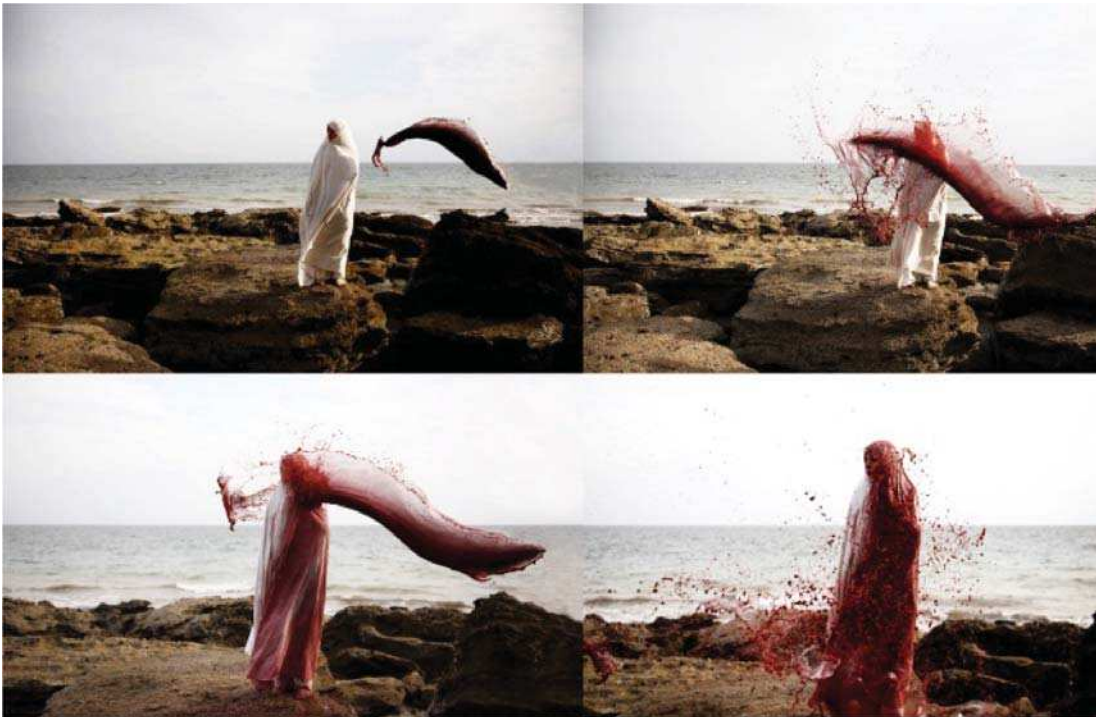
تصویر ۶. تاراگودرزی، از مجموعه پیشکش، جزیره هرمز (۱۳۸۸)، عکاس: راحله زمردی نیا، مأخذ: آرشیو شخصی هنرمند.

زمینی چهره‌های منفی دارند زیرا دس یابی به همه اطلاعات در مورد نوع اثر محیطی و شرایط اجرا و نحوه قرار گیری آن در محیط چیزی بسیار فراتر از مستندسازی بصری است. زیرا تصاویر ثبت شده از اثر تنها می‌تواند بخشی از آنچه را که مد نظر هنرمند بوده است را به تصویر بکشند و مهمتر از همه نمی‌توانند همه ابعاد و ویژگی‌های اثر را به طور واقعی به مخاطبان خود، نشان دهند. در نتیجه، یک فریم عکس به تنهایی نمی‌تواند در بر گیرنده مفهوم و احساس واقعی اثر به مخاطب باشد. به عبارتی دیگر، از آنجایی که مخاطبان نمی‌توانند آن حسی را که اثر در محیط واقعی و با مقیاس دقیق با خود به همراه دارد را مستقیماً درک کنند، مجبور هستند به همان اطلاعاتی که عکس ثبت شده در اختیار مخاطب قرار می‌دهد، بسنده کنند. بنابراین، عکاسی به تنهایی رسانه صادقی برای درک کامل اثر خلق شده نخواهد بود.