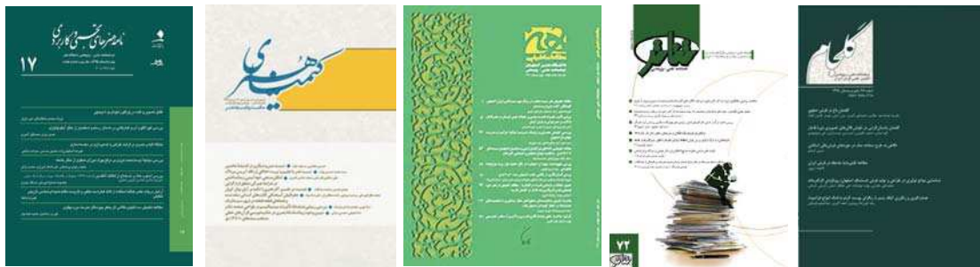
تصویر ۲. روی جلد برخی مجلات علمی - پژوهشی هنر

هجده گانه جدول (۱) دیده نمی‌شوند. مقاله‌ای در حوزه هنر یافت نشد تا بتوان نتایج آن را با مطالعه حاضر مقایسه کرد. اما، یافته‌های حاصل از این پژوهش تنها با یکی از مطالعات انجام‌شده در حوزه علوم انسانی قابل‌مقایسه است. در مقایسه یافته‌های به‌دست‌آمده از مطالعه اخیر با پژوهش افشاری و همکاران (۱۳۹۲)، از مجموع ۳۵ کاربرگ ارزیابی مجلات علوم انسانی ۴۱ شاخص و از مجموع ۹ کاربرگ مجلات هنر ۵۳ شاخص شناسایی و استخراج شد؛ اما هر دو گروه از ۱۱ مؤلفه برای ارزیابی مقالات علمی خود استفاده می‌کنند. در این مقایسه، بیشترین توجه کاربرگ‌های ارزیابی حوزه علوم انسانی به مؤلفه «روش تحقیق» و کمترین توجه به مؤلفه «محتوا» است؛ اما طبق یافته‌های پیشین، در کاربرگ‌های ارزیابی هنر شرایط به گونه دیگری است. سایر پژوهش‌هایی که در پیشینه تحقیق به آن‌ها اشاره شد، بیشتر به‌صورت نقادانه به مسئله داوری، کاربرگ‌های ارزیابی و نیز شاخص‌های موجود در آن‌ها توجه نموده‌اند؛ درحالی‌که هدف این مطالعه تأکید بر ضرورت لحاظ نمودن مؤلفه‌های نگارش مقاله علمی در کاربرگ‌های ارزیابی مجلات تخصصی حوزه هنر است. در هر صورت، مرور سوابق پژوهش گواه این مطلب است که، تاکنون به‌عنوان پژوهشی از نوع کاربردی به سنجش کاربرگ‌های ارزیابی این حوزه از علم هیچ‌گونه توجهی نشده است.