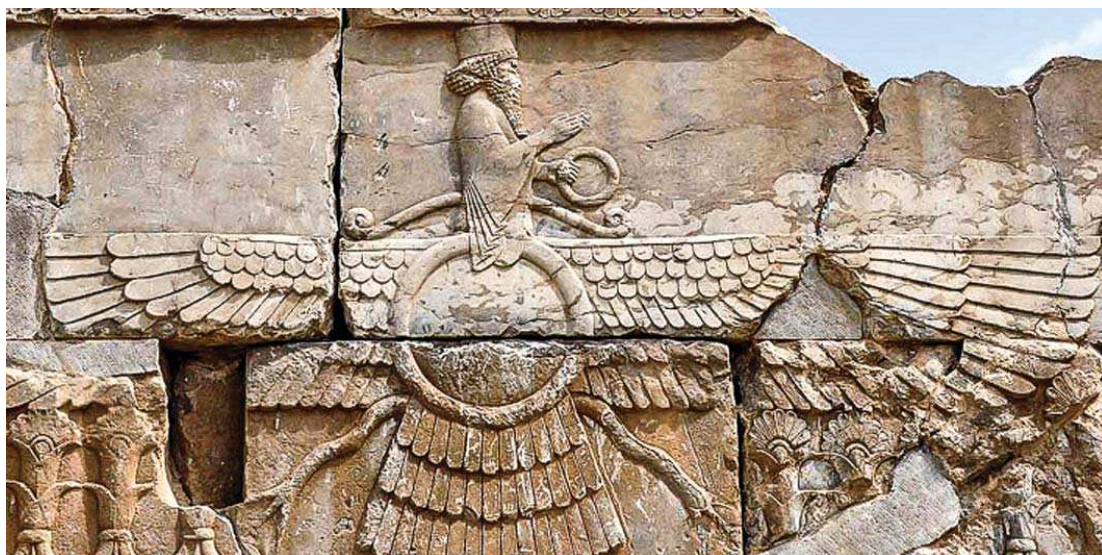
تصویر ۶- فروهر - تخت جمشید

در سنگ قبور آرامنه جلفا فرشتگان با دو بال و اکثراً با خطوط گردان و یا شکسته ترسیم شده‌اند، حال آن که در نقوش و تزیینات کلیسایی انواع فرشتگان با تعداد بال‌های مختلف موجود هستند که به فرشتگان چهاربال و شش بال به ترتیب کروهه و سروبه می‌گویند (تصویر ۵). فرشتگان در بسیاری از مزارها به دور نماد مسیح و صلیب هستند که اولویت او را شهادت می‌دهند. اصلی‌ترین فرشتگان خداوند در تمامی ادیان توحیدی میکائیل، جبرئیل و اسرافیل می‌باشند. در آموزه‌های این ادیان