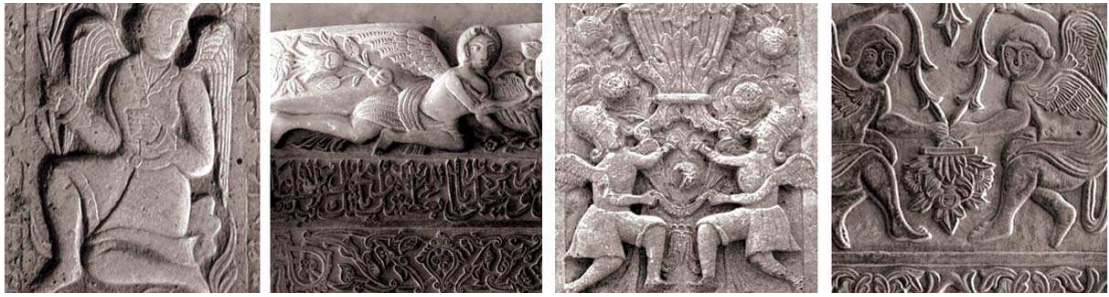
تصویر ۹. فرشتگان مزارهای تخت فولاد، ماخذ: نگارندگان