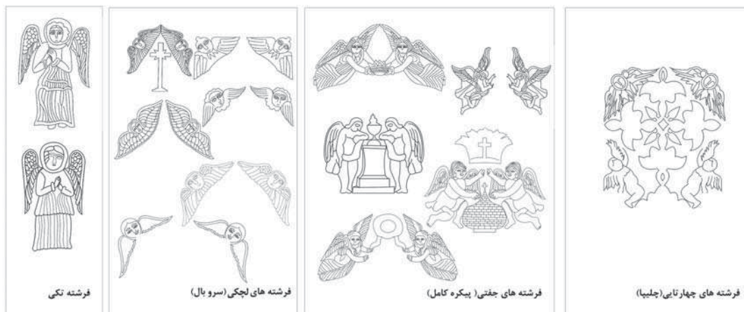
تصویر ۸. شکل انواع فرشتگان، ماخذ: نگارندگان

۲- چهارتایی (چلیپایی) - فرشتگانی که به طور قرینه