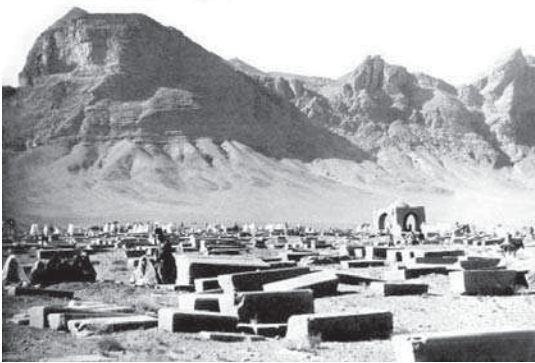
تصویر ۱. آرامگاه ارامنه جلفای اصفهان در دوره قاجار

و قدیمی ترین سنگ مزار آن متعلق به تاریخ ۱۵۵۱ میلادی است. مزارها مدفن انبوه مسیحیان به ویژه ارامنه ایران و اروپاییان مسیحی و از تمامی اقشار جامعه است که از دوران صفوی تا به امروز در آن جا آرمیده اند (بلانت، ۱۳۸۳، ۱۰۴) (تصویر ۱ و ۲).