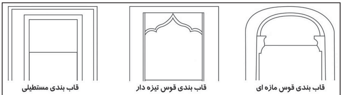
تصویر ۳. انواع قاب بندی‌های سنگ مزارها

تناسب میان طول کادر سرلوحه سنگ به طول سنگ قبر بین نسبت حدود (\frac{1}{4} تا \frac{1}{8}) هستند. لوحه پایینی قبر به طول کل آن بین نسبت حدود (\frac{1}{3} تا \frac{1}{8}) می‌باشد و بیان‌گر این که کادر پایین بیش‌ترین فضای سنگ را به