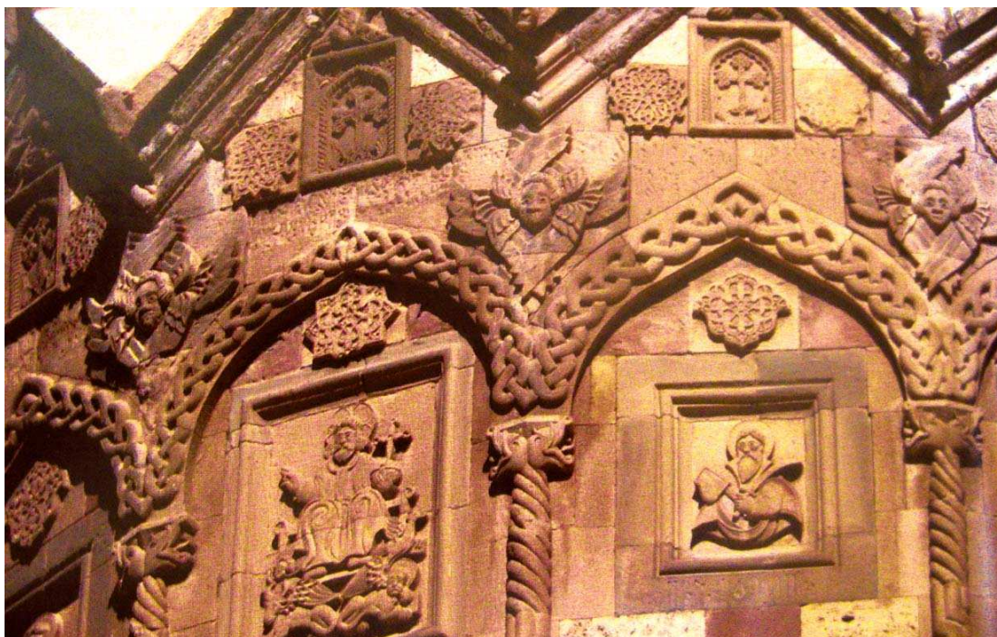
کلیسای استپانوس مقدس - جلفا