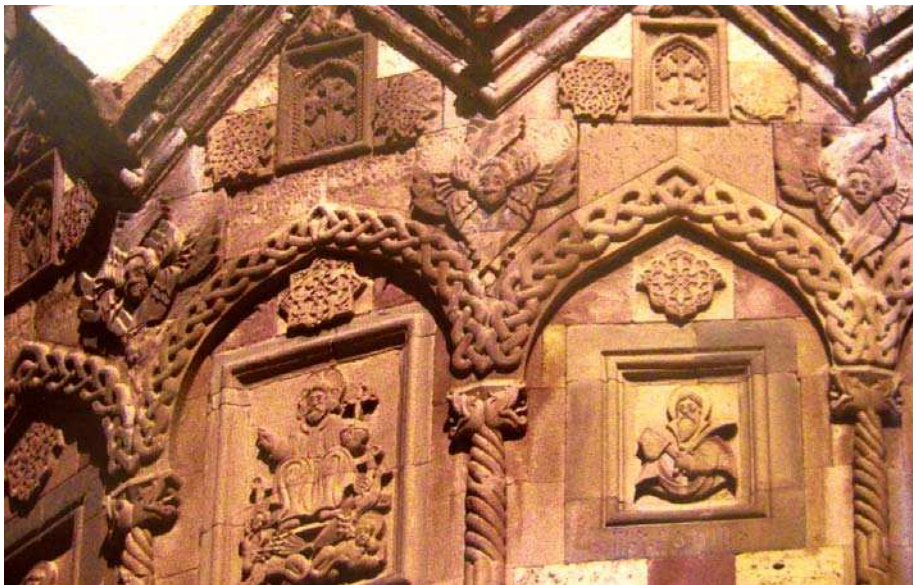
تصویر ۷. کلیسای استپانوس مقدس - جلفا

تکرار شده اند که در میانه آن‌ها عموماً صلیبی قرار داده شده است.