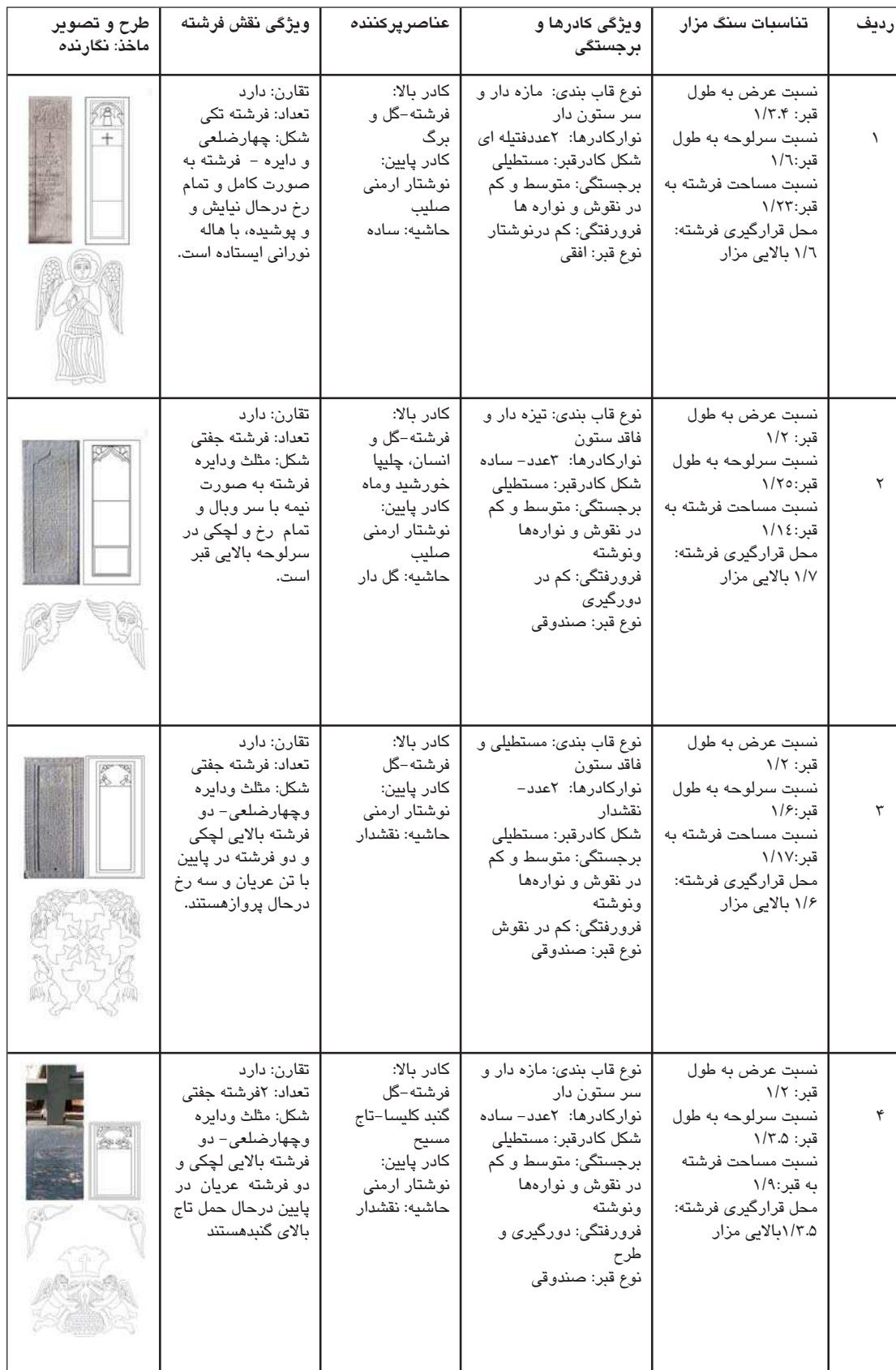
جدول ۲- بررسی سنگ مزارها