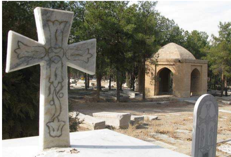
تصویر ۲. آرامگاه آرامنه جلفای اصفهان، پاییز ۱۳۹۵

خود اختصاص داده است (جدول ۲- تناسبات کادرها). فضای بیرونی قاب بندی و حاشیه دور سنگ، نیز نقش دارا کثرا گل و برگ، و در برخی موارد ساده و بی نقش هستند (جدول ۲- عناصر پرکننده)