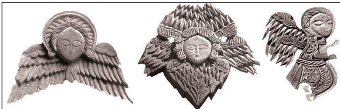
تصویر ۵. حجاری‌های کلیسای تادئوس مقدس، ماخذ: شاهمندی، ۱۳۹۲، ۱۰۱.

همه انسان‌ها، فرشتگان نگهبان دارند که به ویژه برای ارواح پرهیزکاران دارای پیام خوش و بشارت هستند و فرشتگان در طول تاریخ بر پیامبران مانند حضرت ابراهیم، حضرت موسی، حضرت مریم، حضرت عیسی و حضرت محمد(ص) و برخی قدیسان ظاهر شده‌اند (شاهمندی، ۱۳۹۲، ۱۰۰-۹۹).