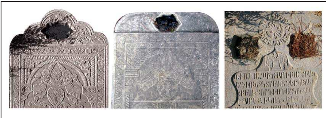
تصویر ۴. نمونه‌های تشت آب و نقش مایه فرشته در بالای برخی سنگ مزارهای ارامنه، ماخذ: نگارندگان

شیوه اجرایی، گاهی انتزاعی و ذهنی و یا به شیوه طبیعت گرایانه کاملاً واقعی هستند. نقوش انسانی خودبه دو دسته شخص متوفی (در حالت ایستاده، نشسته، سواره) یا مسیح و نقش فرشتگان تقسیم می‌شوند.