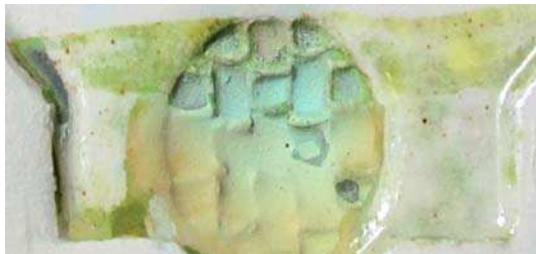
تصویر ۲. نتایج آزمون رنگ زرد الف در دمای ۵۸۰.