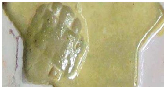
تصویر ۵. نتایج آزمون رنگ زرد ب در دمای ۵۵۰، مأخذ: همان.