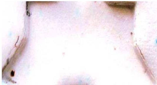
تصویر ۴. نتایج آزمون رنگ زرد ب در دمای ۵۰۰. مأخذ: همان.