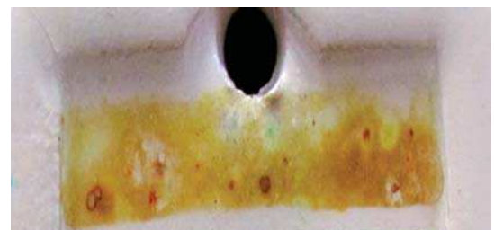
تصویر ۳. نتایج آزمون رنگ زرد الف در دمای ۶۳۰.

لعاب مینایی شیوه‌ای از تزئین اجسام سفالین است که فرآیند پخت این لعاب در دو مرحله و با تکنیک رولعابی صورت می‌گیرد. این شیوه از سفالگری در دوره میانی اسلام (اواخر