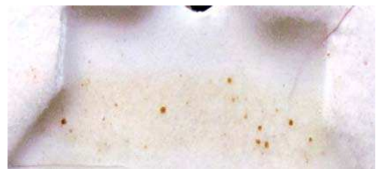
تصویر ۱. نتایج آزمون رنگ زرد الف در دمای ۵۰۰.