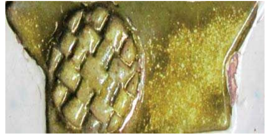
تصویر ۶. نتایج آزمون رنگ زرد ب در دمای ۵۸۰.

–نحاس محرق به کبریت زرد (گوگرد) نیشابوری از نحاس محرق به گوگرد، با نام مس سوخته نیز یاد می‌کند و معتقد به رکن بزرگ بودن این ماده در میناکاری و کاشیکاری است (جوهری نیشابوری، ۱۳۸۳، ۳۲۱). در بخش چهارم کتاب مذکور به سوزاندن مس با گوگرد جهت ساختن نحاس محرق به گوگرد اشاره می‌کند (همان، ۳۵۴-۳۵۷). در این روش از اختلاط مس با گوگرد، سولفید مس ( Cu_2S ) حاصل می‌شود. همانگونه که ذکر شد نحاس محرق ترکیبی از مس و گوگرد است که در صنعت با عنوان سولفید مس عرضه می‌شود. روی سختج، روی سوخته (بیرونی، ۱۳۵۸، ۶۸۹)، روسختج، راسخت، راسخ، روسوخته، (دهخدا، ۱۳۷۷، ۲۲۳۶۵) روسخ تاج و روسوخته (رازی، ۱۳۷۱، ۵۲۲) از دیگر نام‌های سولفید مس در گذشته است.