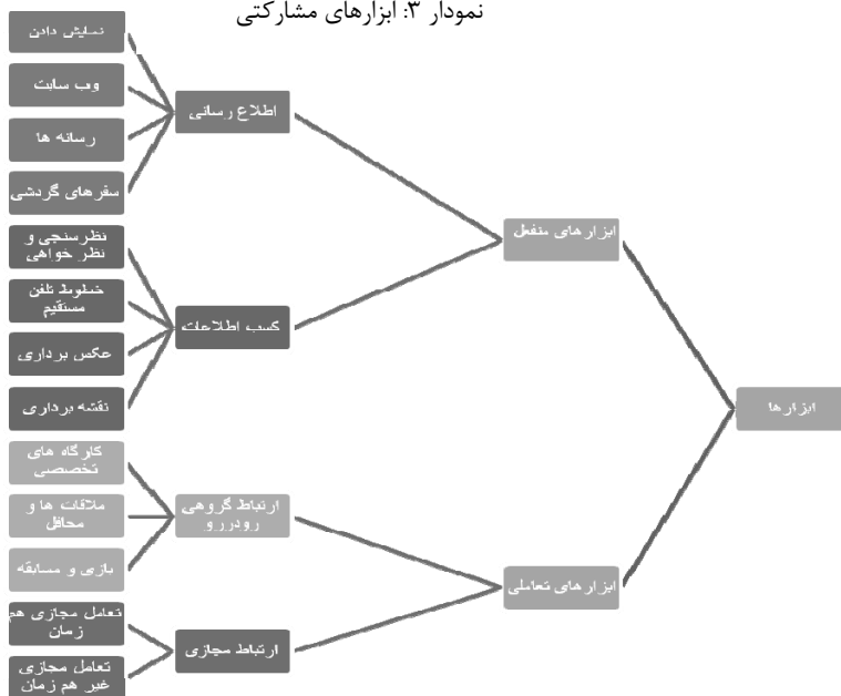
نمودار ۳: ابزارهای مشارکتی