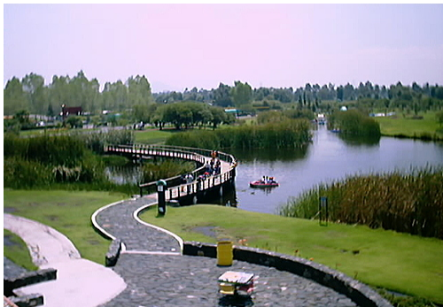
ماخذ: (M .Power, 2006:45)