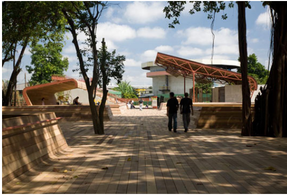
تصویر ۴- سطوح چوبی پیوسته مسیر های پیاده روی

به جای استفاده از مصالح متنوع برای سایر فضاهای این پلازای شهری، تیم طراحی تصمیم به پیوستگی بصری با استفاده از چوب مشابه برای تعریف فضاهای کوچکتر گرفت. نتیجه یک جریان سه بعدی پیوسته و سیال است که از کف شروع شده و با حرکات خود در فضا، فضاهای نیمه باز و بسته را می‌سازد. برنامه‌ریزی موجود در سایت، بازدیدکنندگان را به تفکر در مورد بوم‌شناسی گذشته و حال پارک تشویق می‌کند و مزایای اکولوژیکی را همچون قابی در دید آن‌ها قرار می‌دهد؛ از جمله: