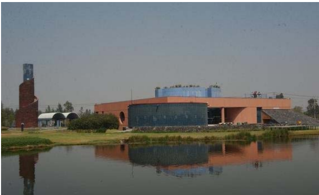
تصویر ۱- دید به مجموعه بنای اکولوژیکی از سمت رودخانه

به عنوان نمونه یک پروژه بازسازی محیطی در مقیاس کلان، این پروژه نشان دهنده چالش‌های شهر نشینی و طراحی شهری در یکی از شهرهای مشهور و رو به رشد جهان است که هم فضای باز برای تفریح و تفرج را فراهم می‌آورد و همچنین زمینه تاثیرگذار برای پیشرفت اقتصادی فراهم می‌کند. اکسچیمیلکو به معنای مکانی که گل‌ها رشد می‌کنند؛ مربوط به دوران قبل از آرتک‌ها، منظری از باغ - جزیره‌های مصنوع در دریاچه‌ای که زمانی دره مکزیکو را در بر گرفته بوده است. این پروژه به عنوان طراحی معماری منظر، توسط ماریو اسپچتنان ۱۸ در سال ۱۹۹۳ ارائه شد. و برنده جوایز متعددی از جمله جایزه سبز طراحی شهری دانشگاه هاروارد در ۱۹۹۶ و جایزه طراحی مرکز آب کناری واشنگتن دی.سی در ۱۹۹۴ ۱۹ شد تصویر شماره (۱).