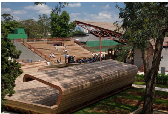
تصویر ۵- فضاهای جمعی و فضاهای نیمه باز

با مقایسه این دو پروژه، ایده‌های اصلی حاصل از تحلیل دو پارک اکولوژیکی شاخص را می‌توان به صورت زیر بیان کرد: