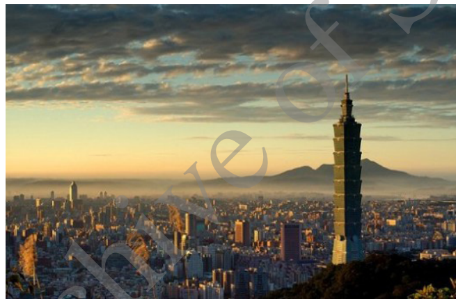
شکل ۳: آسمان خراش تایپه ۱۰۱ در تایوان

اگر طراح به این امر با تمامی ابعاد آن توجه داشته باشد که هر یک از کاربری‌های مستقر در ساختمان‌های بلندمرتبه، شرایط خاصی را جهت دسترسی و سایر زیرساخت‌ها می‌طلبند، بنا به تنوع کاربری مطلوب در مجموعه، باید به تعیین و یا تحدید ارتفاع ساختمان پردازد. به طبع قواعد شهرسازی همواره محدودیتی در زمینه حداکثر ارتفاع ساختمان‌ها تعیین می‌کنند که در مراحل ابتدایی طراحی مورد توجه طراح قرار می‌گیرد. دسترسی به طبقات فوقانی ساختمان‌های بلندمرتبه، به گونه‌ای که به گستره کاربری‌های مدنظر کاربران خدشه وارد نشود، امری است که ملزومات طراحی هدفمندی را طلب می‌کند. از جمله این ملزومات، می‌توان سامان‌دهی مناسب فضاهای رفت و آمد و آسانسورها (که غالباً از جمله بی فضاهای سخت محسوب می‌شوند) را با توجه به تعداد کاربران و موارد استفاده‌شان نام برد. برای نمونه آسمان خراش تایپه ۱۰۱ ۱۵ در تایوان شکل ۳، مجهز به آسانسورهای پرفشار و سریع‌السیری است که در مدت ۳۹ ثانیه به سکوی نظاره می‌رسند.