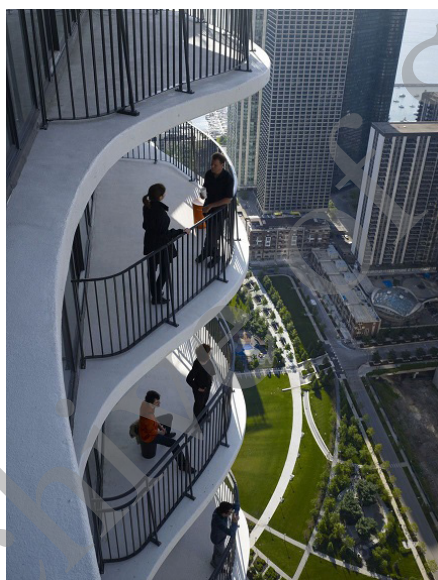
شکل ۴: طراحی بالکن در طبقات برج آکوا

یکی دیگر از راهکارهای افزایش کیفیت انعطاف‌پذیری در ساختمان‌های بلند، در نظر گرفتن فضاهای نیمه باز، مانند بالکن در طبقات مختلف می‌باشد. طراحی فضاهای نیمه باز، همچون بالکن و آتریوم در ساختمان‌های بلند، تأثیر به‌سزایی در افزایش رضایت کاربران دارد. نمونه مطلوب بهره‌گیری از بالکن در برج ۲۵۰ متری آکوا ۱۶ شکل ۴، قابل مشاهده است. این‌گونه فضاها با قابلیت توسعه فضای داخلی در خارج از بنا، گذشته از افزایش حق انتخاب کاربران برای دستیابی به کاربری‌های جدیدتر، زمینه مناسب‌تری را در جهت افزایش میزان انعطاف‌پذیری بنا پدید می‌آورند. با اضافه کردن زیر فضاهایی از این دست، با شخصیت متفاوت، می‌توان گستره گزینه‌های چیدمان را افزایش داد (Bentley, 2003, p. 192). فضاهای نیمه باز، همچون فضاهای نیمه‌عمومی، زمینه مناسبی جهت ارتقاء سطح کیفی ساختمان‌ها را فراهم می‌آورند. به علاوه امتیازی که در فضاهای نیمه باز وجود دارد، امکان برخورداری از عوامل طبیعی همچون نور طبیعی در این فضاهاست که به خودی خود تنوعی مطلوب در آن‌ها مستتر است.