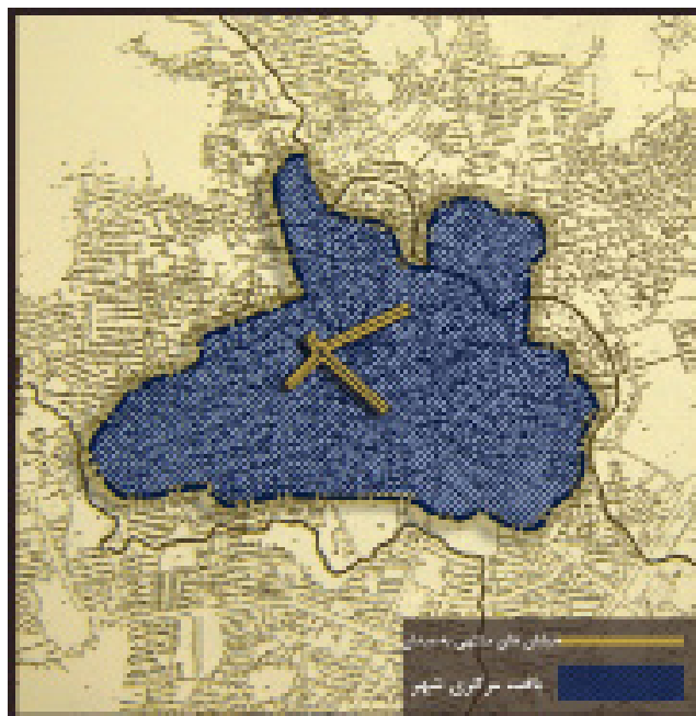
شکل ۲: میدان در تطبیق با عملکرد جدید و اولویت حرکت سواره از سال ۱۳۴۲ به بعد

از سال ۱۳۴۲ به بعد، شکل شهر از قالب‌های قبلی کاملاً دور شده و الگوهای شیوه بین‌المللی مورد توجه قرار می‌گیرد. با افزایش اتومبیل فرم میدان تغییر و با عملکرد جدید و الویت حرکت سواره تطبیق پیدا کرده است. در سال ۱۳۴۲ میدان به صورت فرم کنونی ساخته شد. امروزه محدوده میدان تحت عنوان هسته مرکزی شهر، کاربری‌های اداری، تجاری و فرهنگی را در خود جای داده است. بازار به عنوان قلب اقتصادی شهر شامل عمده‌فروشی‌ها و خرده‌فروشی‌ها تنها به عنوان مرکز خرید عموم شهر نبوده و شهرستان‌ها، بخش‌ها و روستاهای اطراف را نیز پوشش می‌دهد. همچنین ادارات دولتی که بسیاری از آن‌ها در سطح استان عمل می‌کنند در این ناحیه قرار گرفته‌اند.