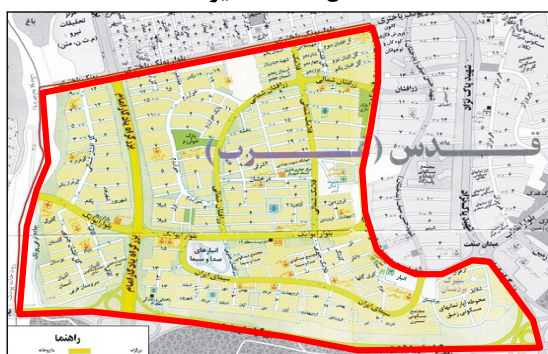
شکل ۲: محله ایوانک