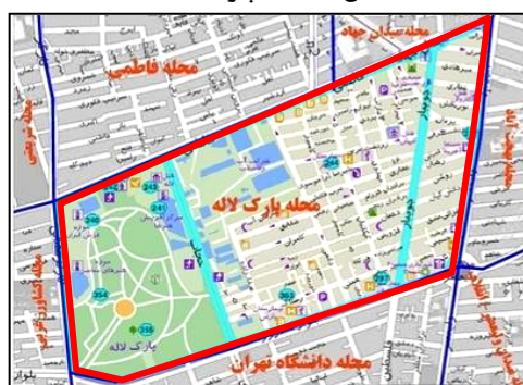
شکل ۱: محله پارک لاله