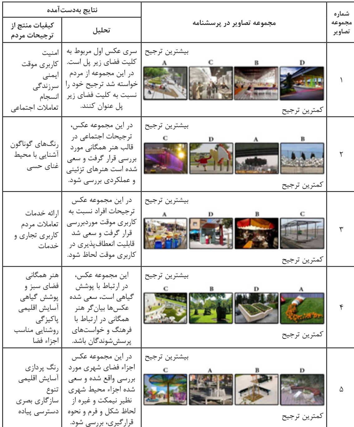
جدول ۳: بررسی تمایلات و انتظارات استفاده‌کنندگان از فضا براساس

علاوه بر ملاک‌های مطلوبیت و عدم مطلوبیت فضاهای زیر پل، در روش طبقه‌بندی کیفیت‌های بصری به‌منظور دریافت نظرات مشارکت‌کنندگان، پنج مجموعه عکس در نظر گرفته شد و از پاسخ‌دهندگان خواسته شد، عکس‌ها را براساس ترجیح خود اولویت‌بندی کنند و انتظارات خود را از مکان مطلوب خود بیان کنند. انتظارات مطرح‌شده مشارکت‌کنندگان بعد از پیاده‌سازی، دسته‌بندی شده و در قالب کیفیت‌های طراحی شهری استنتاج و دسته‌بندی شده‌اند. نتایج زیر جدول ۳ از تحلیل مجموعه عکس‌ها و اظهارات مشارکت‌کنندگان به‌دست آمده است: