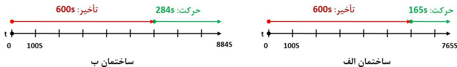
شکل ۳: خط زمان تخلیه ساختمان‌های مورد مطالعه

شکل ۳ تفکیک بازه‌های زمان تأخیر و زمان حرکت را در محاسبه زمان تخلیه برای هریک از دو ساختمان مورد مطالعه نشان می‌دهد. همانطور که از مشاهده خط زمان هر دو ساختمان مشهود است، قسمت عمده زمانی که برای تخلیه هر ساختمان محاسبه شده است به زمان تأخیر مربوط می‌شود (در ساختمان الف تقریباً ۷۸ درصد و در ساختمان ب ۶۸ درصد زمان کلی تخلیه را زمان تأخیر دربر می‌گیرد).