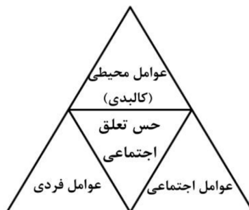
شکل ۲: دسته‌بندی عوامل تأثیرگذار بر مفهوم حس تعلق اجتماعی

شکل دو، الگوی تحلیلی تحقیق را نشان می‌دهد که در آن عوامل تأثیرگذار بر شکل‌گیری و ارتقاء حس تعلق اجتماعی مشخص شده‌اند. براساس پیشینه موضوع، متغیرهای تأثیرگذار تحت سه عامل اجتماعی، محیطی و فردی دسته‌بندی شده‌اند. این عوامل، ممکن است در شکل‌گیری سایر مفاهیم مرتبط با ادراک، رفتار و فعالیت‌های انسانی نیز مؤثر باشند (Bell et al., 2005; Gifford, 2007). هر یک از این عوامل چندین متغیر را شامل می‌شوند.