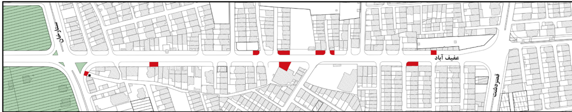
شکل ۷: رستوران‌ها و اغذیه‌فروشی‌ها

■ قرارگیری میز و صندلی کافه‌ها و اغذیه‌فروشی‌ها در پیاده‌رو