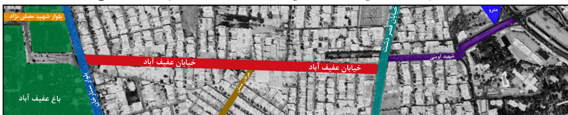
شکل ۱: موقعیت خیابان عقیف‌آباد، باغ عقیف‌آباد و ایستگاه مترو شهید آوینی

معبر عقیف‌آباد از جمله خیابان‌هایی است که در سطح شهر عملکرد تجاری تفریحی دارد. این موضوع موجب استقبال شهروندان از محور عقیف‌آباد شده است.