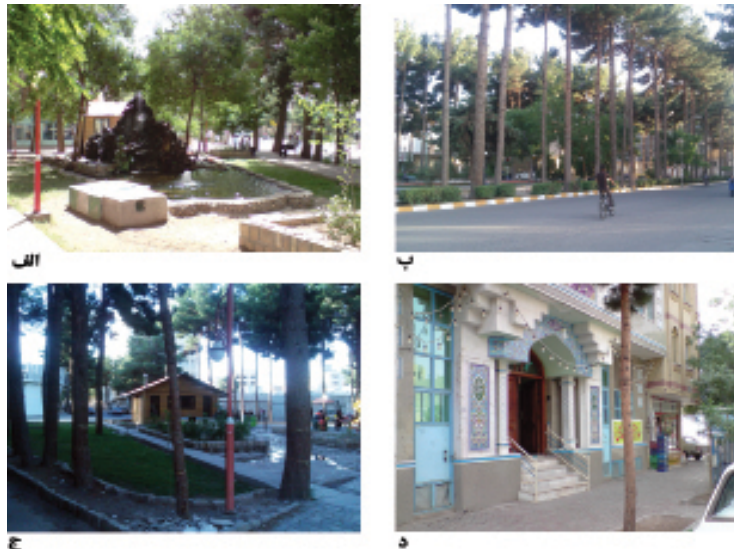
الف: پارک مرکزی محله، ب: خیابان محله، ج: پارک کودک محله، د: مسجد محله (مسجد النبی (ص))

کیفیت پیاده‌روها، امکان عبور امن از خیابان، وجود عوامل تعدیل‌کننده ترافیک سواره در خیابان بهار از این حیث مفید عمل می‌کنند. در محله بهار شاهد وجود باشگاه بیلیارد و باشگاه بازی‌های کامپیوتری هستیم که فضای فراغت برای نوجوانان و جوانان فراهم آورده است. دسترسی مناسب در مرکز محله به پارک و فضای سبز محله، منتهی شدن مسیرهای متعدد از قسمت‌های مختلف محله به سمت پارک‌های مذکور، این فضاها را برای ساکنین محلی دسترس‌پذیر کرده است. وجود کافه شهرداری و کافه کتاب درون این فضا، وجود آبسردکن، سایه‌اندازی مناسب درختان درون پارک، کیفیت نسبتاً مطلوب پیاده‌روها، وجود تنوعی از کاربری‌های تفریحی همچون کافی‌شاپ، بستنی‌فروشی، آجیل و خشکبار، وجود