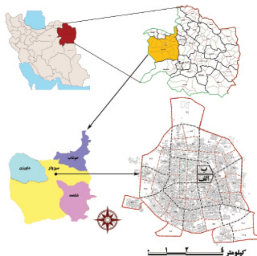
شکل ۱: محدوده کلی دو محله مورد مطالعه؛ شهر سبزوار

نگارندگان برگرفته از مهندسان مشاور هفت شهر آریا، ۱۳۸۸. محدوده الف: محله بهار و محدوده ب: محله انقلاب اسلامی را نشان می‌دهد.