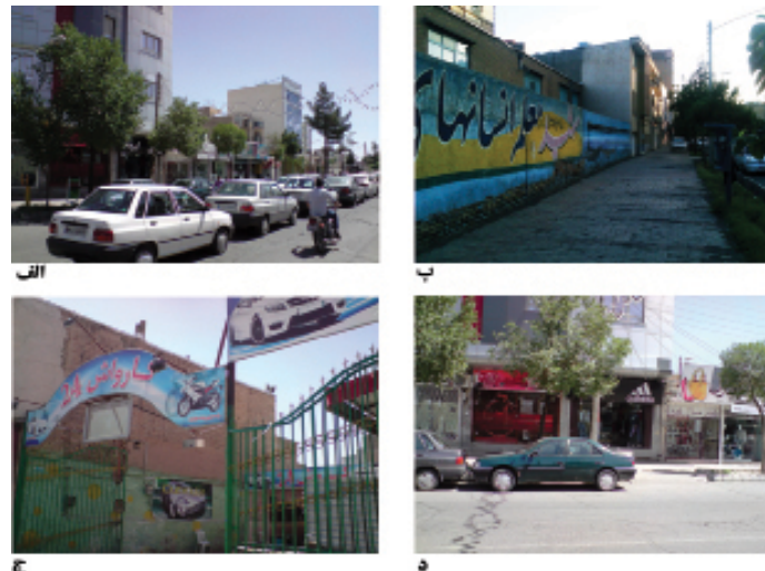
الف: خیابان محله، ب و د: جداره‌ها و فضای پیاده‌رو، ج: کاربری‌های مزاحم محلی