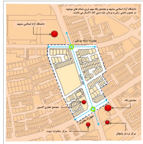
شکل ۴: شباهت‌های ادراکی مردان و زنان ۴۱-۵۲ سال