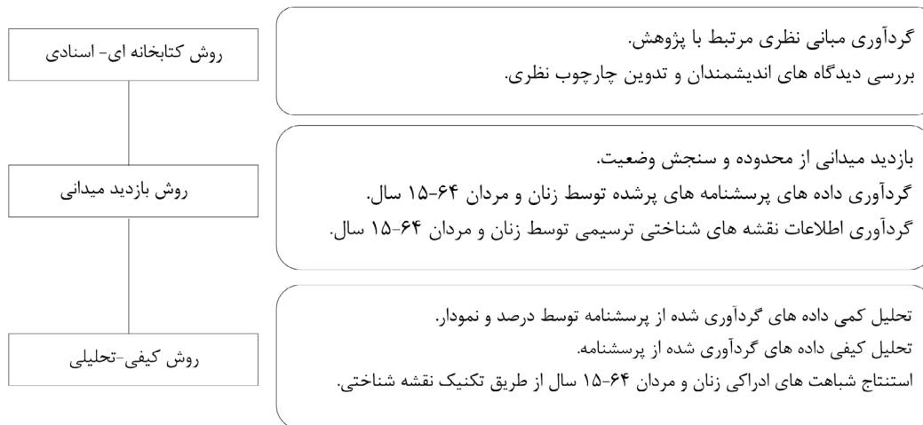
شکل ۱: فرآیند روش تحقیق