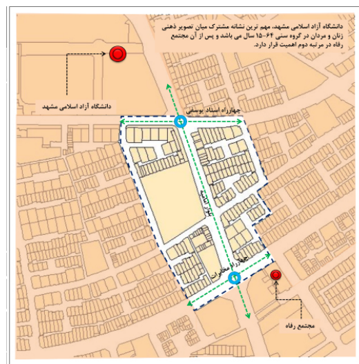
شکل ۶: شبهات‌های ادراکی مردان و زنان ۶۴-۱۵ سال