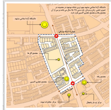
شکل ۲: شباهت‌های ادراکی مردان و زنان ۱۵-۲۸ سال