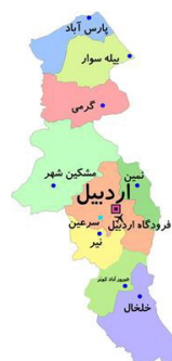
شکل ۳: نقشه شهری استان اردبیل

هدف طراحی تالار شهر اردبیل از یک سو ایجاد فضایی برای شورای شهر اردبیل و ارتباط بین مردم و دولت و از سوی دیگر جبران کمبود فضاهای فرهنگی در شهرستان اردبیل و پاسخگویی به احتیاجات مردم در بهره‌مندی از فضاهای تفریحی، آموزشی و گذران اوقات فراغت در فضایی مناسب و از طرف دیگر ساماندهی محدوده‌ای از بافت شهری می‌باشد که دچار اختلافات شهری و کمبود