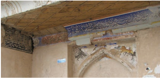
تصویر ۴. روند شکل‌گیری ارگانیک لایه‌های تاریخی در کتیبه سر در حمام شاه علی

۲- مرکز توسعه شهر بر روی مرکز کهن قرار نگرفت و به این ترتیب بخش‌های جدید ضمن تقویت بافت کهن، هویت شهری خود را در ارتباط با بخش قدیمی تعریف کردند. نظیر چنین برخوردی را نه فقط در مورد یک شهر بلکه همچنین در مجموعه‌ای از تجارب متنوع تاریخی نگهداری از میراث فرهنگی ایران نظیر تعمیرات مساجد تاریخی بر اساس ارزش‌های کهن و یا تشکیل صورت‌های جدید از یک تابلوی کاشیکاری می‌توان تعقیب کرد. جدول ۳ آموزه‌های صدرایی متناظر با ویژگی‌هایی را که شیرازی در تجربه تاریخی شکل‌گیری نمونه‌های هنر و معماری بومی ایرانی در اصفهان برشمرده‌است، ارائه می‌کند. موارد مشابهی از این جدول را برای ردیابی آرای دیگر نحله‌های حکمت نیز می‌توان تهیه کرد. ویژگی این جدول بازگرداندن موضوع تداوم فرهنگ آفرینش به حوزه ملموس یعنی «نحوه مداخله انسان در ماده» است.