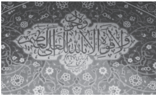
تصویر ۱. بازسازی کاشیکاری مسجد حاج محمد جعفرآبادهای پس از وقوع صدمات در حین جنگ تحمیلی، اثر استاد حسین مصدق زاده

حرکت خطی بی‌بازگشتی از تولد به سوی مرگ در نظر می‌گیرد و نگاه چرخه‌ای به زمان را کهنه‌پرستانه می‌داند (Dushkina, 2009: 92).