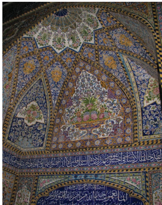
تصویر ۵. تاثیر سر در مسجد رحیم خان (چپ) بر طراحی بازسازی سر در مسجد حاج محمد جعفر اثر استاد والیان، نمونه از روابط برون ساختاری اثر