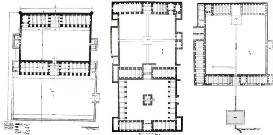
تصویر ۶. راست: اقامتگاه شاهی عباس‌آباد سیاه‌کوه (کلایس، ۱۳۶۵: ۸۳)، وسط: اقامتگاه شاهی سفیدآباد (کلایس، ۱۳۶۵: ۷۸)، چپ: اقامتگاه شاهی دمبی (سیرو، ۱۳۵۷: ۱۶۸).