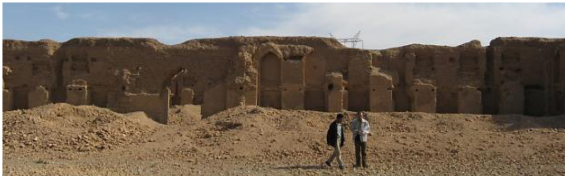
تصویر ۵. بخشی از صحن و غرفه‌های اقامتگاه شاهی دمبی

هشتم هجری (۷۱۵ تا ۷۲۵ هجری) می‌داند. او مجموعه سربازخانه و کاروانسرای سنگی دمبی را با مجموعه سربازخانه و کاروانسرای هشت‌ضلعی چهارآباد در جاده نطنز مشابه دانسته است (سیرو، ۱۳۵۷: ۱۷۱). سیرو در جایی دیگر درباره کاروانسرای سنگی دوره صفوی در دمبی آورده است: «کاروانسرای دنیبی یک محل توقف مهم در جاده اصفهان - نطنز بوده و در زمان صفویه رفت و آمد بسیاری داشته است. این بنای شگفت (۵۵/۹ در ۵۷/۲ متر) حاصل استفاده مجدد از یک بنای مغولی است؛ به‌همین دلیل است که درعین دنباله‌روی از طرحی که طبق نمونه‌های گذشته ترسیم شده است، تفاوت‌های فاحشی را نشان می‌دهد. این نقص‌ها عبارت‌اند از تنگی راه طویله، ورودی‌ای که مستقیماً وارد یک دالان پهن می‌شود و فقدان قسمت مخصوص نگهبانان در ورودی. هم‌چنین، بی‌قاعدگی‌هایی در طویله‌های جنبی دیده می‌شود که انباری‌هایی در انتهای دالان [طویله‌ها] ترتیب داده‌اند. سردر که از طرف خارج بسیار ویران است، قسمت اعظمش مغولی است. دیوار بزرگ خارجی با قلوه‌سنگ، پانزده برج و پشت‌بند، متعلق به بنای اولیه مغولی است. بر فراز یکی از برج‌ها [در دوره صفوی] یک فانوس قرار داده‌اند ... حیاط مربع است و دو ایوان بزرگ براساس طاق‌هایشان مغولی هستند؛ اما ایوان‌های کوچک در دوره صفوی بازسازی شده‌اند. کاروانسرای دنیبی براساس آثار قدیم‌تر متعلق به اواخر دهه ۷۳۰ هجری است و تغییر شکل‌های دوره صفوی براساس قطعات تزئینی متعلق به دوره شاه‌عباس اول است» (سیرو، ۱۳۵۷: ۲۲۷-۲۲۸).