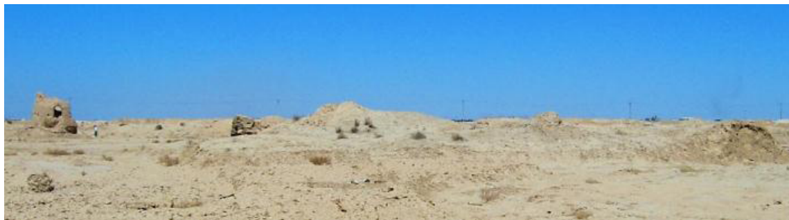
تصویر ۲. یکی از برج‌های برجای‌مانده از حصار دولت‌آباد قدیم در سمت چپ و بقایای حصار در امتداد آن

کشت و زرع و جابه‌جایی خاک زمین‌های دولت‌آباد قدیم برای مقاصد کشاورزی، ساختمان‌سازی و کوره‌های آجرپزی از یک‌سو و هم‌چنین تخریب در اثر سیلی که در آن به‌وقوع پیوسته از سوی دیگر، تعیین حریم این شهر را براساس بقایای سطحی مشکل می‌سازد؛ اما با نگاهی بر تصاویر ماهواره‌ای از این منطقه به‌نظر می‌رسد وسعت شهر قدیم در حدود ۷۰۰×۱۲۰۰ متر بوده و بر این اساس، در موقعیتی از طول جغرافیایی "۴۷' ۵۹" ۳۲° تا طول "۴۷' ۳۵" ۳۲° و از عرض جغرافیایی "۴۴' ۰۰" ۵۱° تا عرض "۴۴' ۱۵" ۵۱° قرار گرفته است. براساس بررسی نگارندگان در منطقه، در حال حاضر از روستا یا شهر قدیم فقط بقایای دو برج، برخی تپه‌های کوچک و بزرگ ناشی از جابه‌جایی خاک و آوار ساختمانی، قطعات سفال آبی و سفید صفوی، لعاب‌دار تک‌رنگ فیروزه‌ای و سبز برجای‌مانده است. دو برج اشاره‌شده در فاصله ۳۷۰ متر از یکدیگر قرار دارند و با توجه به برجستگی‌های موجود در حد فاصل این دو به‌نظر