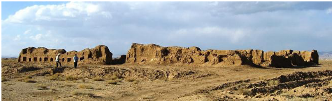
تصویر ۳. اقامتگاه شاهی علی‌آبادریگ - نمای جنوب غربی

ارباب‌اصفهانی در دوره قاجار، فقط به خربزه مرغوب در مزارع کمشچه و مزرعه علی‌آباد که از مزارع کمشچه بوده، اشاره کرده است (ارباب‌اصفهانی، ۱۳۶۸: ۳۰۱). این ذکر او نشان می‌دهد در زمان او روستای علی‌آبادریگ چندان آباد نبوده و وصف قابل توجهی نداشته و تنها به‌عنوان یکی از مزارع کمشچه شناخته می‌شده است.