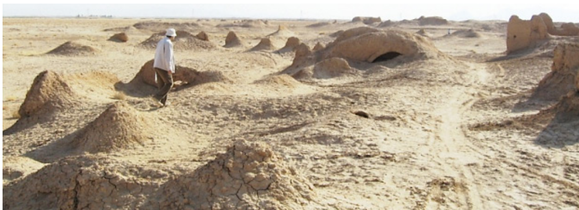
تصویر ۴. بقایای معماری روستای علی‌آبادریگ، مدفون در زیر شن