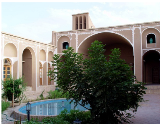
۱۸. ایوان جنوبی و بادگیر پشت آن در خانه سالاری میبد

است که در دشت یزد-اردکان روی بنایی غیر از آب‌انبار احداث گردیده است. این در حالی است که دیگر بادگیرهای عظیم و مشهور ایران حداقل از سال ۱۲۰۰ هجری به بعد ساخته شده‌اند. قبل از تاریخ ۱۱۶۰ ه.ق. معماری شاهکاری برای بادگیر در ایران گزارش نشده است. بنابراین، به جرات می‌توان گفت که بادگیر دولت‌آباد نقطه عطفی در رواج ساخت بادگیرهایی با ساختار تنوره‌های بلند و پرهایی کارساز بوده است (تصویر ۱۵).