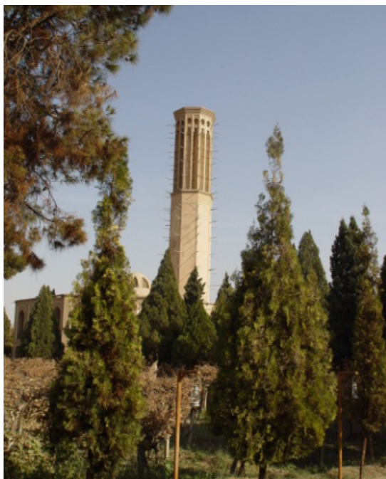
۱۵- بادگیر عمارت باغ دولت‌آباد

متأسفانه از این دوره تاریخی در منطقه مورد مطالعه آثار معماری چندانی مانند دوره مظفری و تیموری برجای نمانده است. به‌طور کل، در دوره صفوی بیش‌تر توان