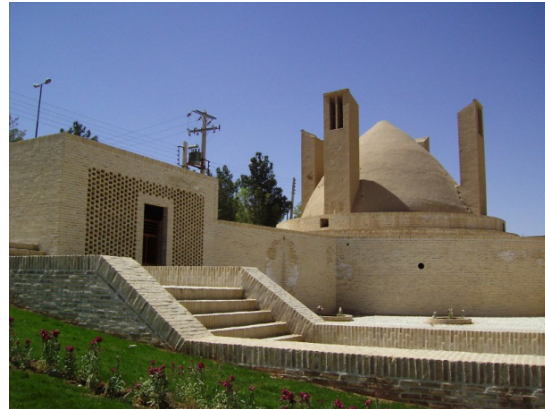
۱۹. آب انبار کلار میبد، صفوی

نکته دیگر این که با توجه به متون کهن تر، آب‌انبارهای بادگیردار حتی در قرون چهارم و پنجم هجری قمری در اقلیم کویری ایران وجود داشته‌اند. ناصر خسرو قبادیانی بلخی (۳۹۴-۴۸۱ ه.ق.) در سفرنامه خود به شهر نایین و آب‌انبارهای آن اشاره دارد: