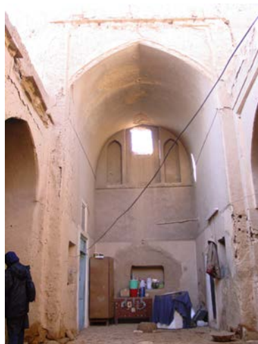
۴. ایوان رفیع خانه سیدرضا در میبد.