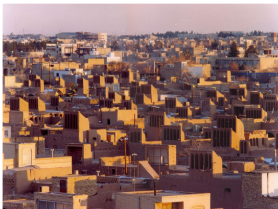
۲۳. آسمانه یک بافت قاجاری، بادگیرهای یک سویه، محله مهرجرد میبد.