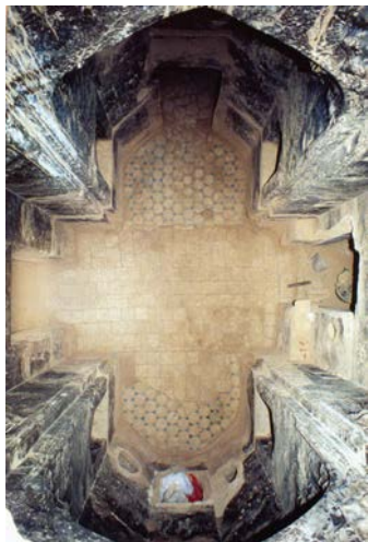
۵. طنبی مجلل پشت ایوان در خانه برونی میبد (ماخذ: کریمی، ۱۳۸۵: ۱۳۳).