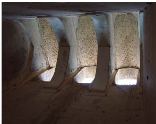
۲۹. تشکیلات سازه چشمه‌های بادگیر مدرسه غیاثیه