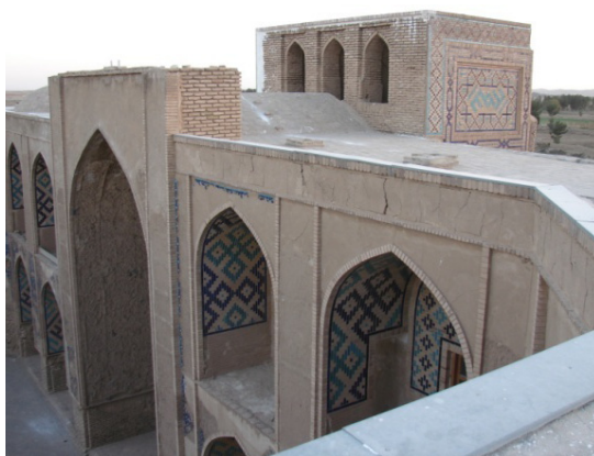
۲۶. بادگیر مدرسه غیاثیه در پشت صفا

مدرسه غیاثیه خرگرد به تاریخ ۸۴۸ ه.ق، بادگیر یک‌سویه این مدرسه در انتهای ضلع جنوبی رو به سوی شمال دارد و با توجه به جایگاه قرارگیری در پلان و تزئینات کاشی معرق که در بدنه داخلی و خارجی آن با تکنیکی مشابه کاشی کاری سایر بخش‌های مدرسه، هم‌زمان با ساخت بنا برپا شده است (تصاویر ۲۵ - ۲۹).