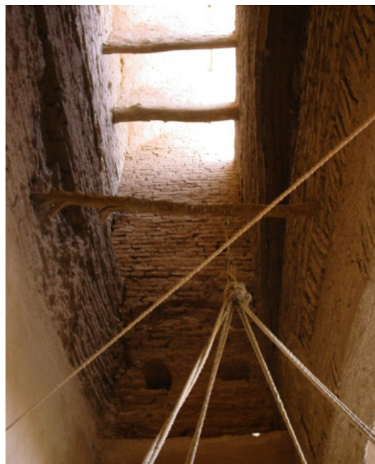
۱۴- داخل کانال بادگیر خانه سمیعی میبد. در طرفین بدنه بادگیر داغ طاق قدیمی که برچیده شده است مشهود می‌باشد. (ماخذ: اسفنجاری و ذاکراملی، ۱۳۸۵: ب: ۱۸).