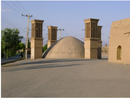
۲۰. آب انبار رستم گیو یزد با بادگیرهای چهارسویه