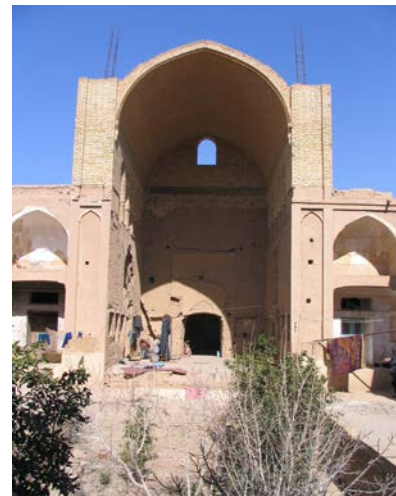
۳. ایوان رفیع خانه حیسینیان (طاق بلندها) در یزد.

زمان خود بود و ... مزار مقدس جد بزرگوارش او ساخته، چهار صغه عالی و طنبی بزرگ که مدفن شیخ الاسلام است» (همان: ۶۹).