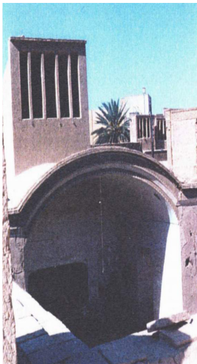
۱۷. ایوان جنوبی و بادگیر پشت آن در خانه گلشن میبد