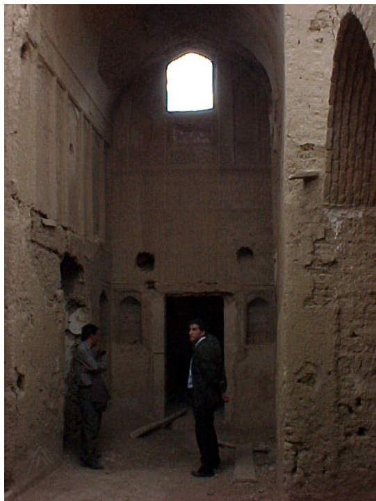
۶. بازو رابط طنبی و ایوان در خانه برونی (ماخذ: آرشیو پایگاه پژوهشی میبد).

اشعار و ضرب‌المثل‌های آن عصر نیز از طنبی به‌عنوان فضایی عالی و بسیار مهم یاد کرده‌اند. برای مثال، خواجه شمس‌الدین حافظ شیرازی که در عصر شاه‌شجاع