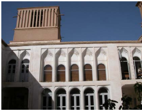
۱۶. یکی از بادگیرهای خانه رسولیان یزد