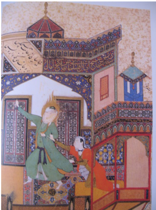
۳۰. گریز یوسف از زلیخا، بهزاد، بوستان سعدی، هرات، ۸۸۸ هـ ق (ماخذ: بلر، ۱۳۸۱: ۶۷).

توصیفات ترسیم نموده باشد و نه از طریق مشاهده مستقیم، باز هم نشان از این دارد که احتمالاً در شرق ایران آن روزگار ساخت بادگیر رایج بوده است. بادهای شدیدی که در منطقه خواف و شرق خراسان می‌وزد و مهارتی که در ساخت آسیاب‌های بادی در آن وجود داشته است، بدون شک مردم این سرزمین عنصر طبیعی باد را بسیار خوب می‌شناخته‌اند و در جهت مهار و حتی استفاده بهینه از نیروی آن استفاده می‌برده‌اند (تصویر ۳۰).