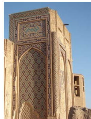
۲۷. تزئینات بدنه بیرونی بادگیر مدرسه غیاثیه. تکنیک این تزئینات مشابه تکنیک تزئینات سایر بخش‌های بدنه بیرونی بناست. ترکیب کاشی و آجر (مغلی)

تصویری از یک نگاره اثر بهزاد متعلق به کتاب بوستان سعدی که صحنه فرار یوسف از خوابگاه زلیخا را نمایش می‌دهد. در سمت راست این نگاره عنصر آبی‌رنگی شبیه به بادگیر مشاهده می‌شود. تاریخ نقاشی به سال ۸۸۸ ه.ق. منسوب است. حتی اگر بهزاد که در مکتب هرات قلم می‌زده است، این عنصر را از روی تعاریف و