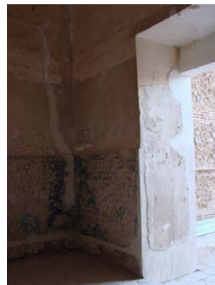
۲۸. تزئینات بدنه داخلی بادگیر مدرسه غیاثیه. کاشی‌های شش ضلعی لاجوردی، در ازاره دیوار. سنت رایج در معماری دوره تیموری خراسان بزرگ.