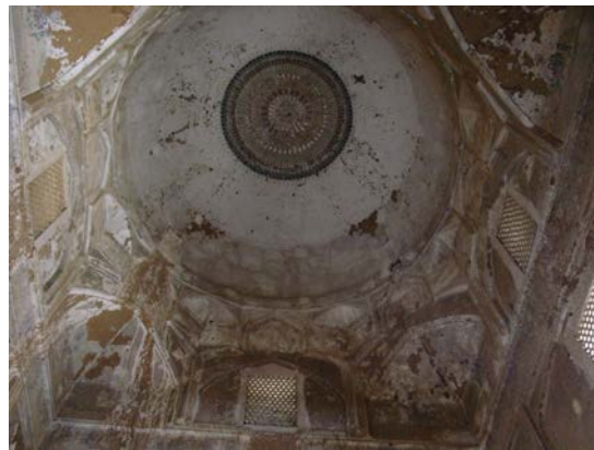
۷. طنبی مدرسه کمالیه

با بررسی که روی برخی از این بادگیرها در مساجد به انجام رسید، دیده شد که بادگیر اولاً از فضای پشت‌محراب، در گذر، بیرون‌زدگی دارد، به‌طوری‌که راستای دیوار پشت محراب و دیوار پشت بادگیر در یک امتداد نیست. ثانیاً در برخی موارد از داخل محراب شواهدی از تغییراتی در تزئینات محراب برای ایجاد تنوره بادگیر مشاهده شده