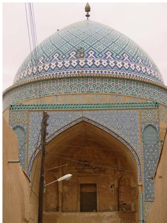
۸. گنبد ایوان بقعه سید رکن‌الدین