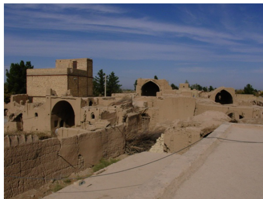
۲۲. آسمانه یک بافت ایلخانی - تیموری، ایوان های بلند رو به سوی شمال، محله بدرآباد میبد. (ماخذ: ذاکرعاملی)

در عصر صفوی با وجود این‌که در بناهای شاخص و خانه‌ها به بادگیرهای اصیل صفوی برخورد نمی‌کنیم، می‌توان تعداد زیادی آب‌انبار در منطقه برشمرد که تاریخ صفوی دارند: