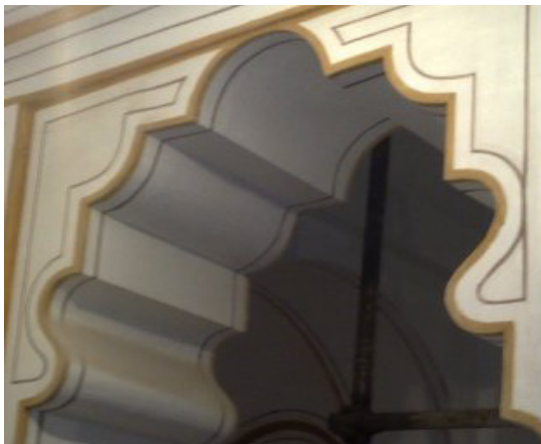
تصویر ۸. تویزه با چفد شکنجی (نگارندگان)