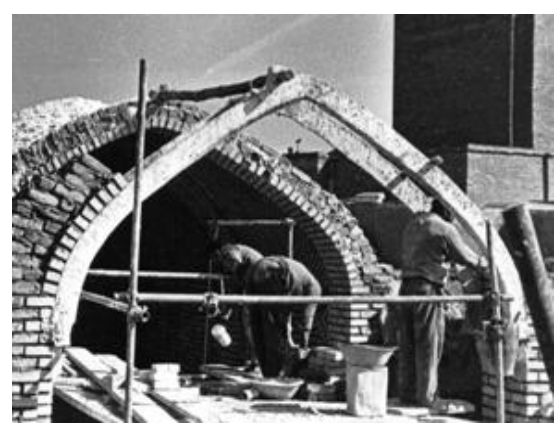
تصویر ۱. شابلون یا تویزه گچی