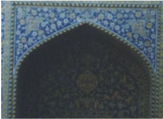
تصویر ۶. تویزه با چفد تیزه‌دار (جناغی)