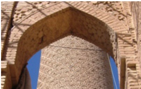
تصویر ۱۰. اجرای چانه یا لغاز (نگارندگان)

چگونگی تیزه، میزان خیز و همچنین از منظر ریخت و فرم دسته‌بندی نمود.