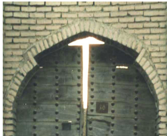
تصویر ۷. تویزه با چفد کللی