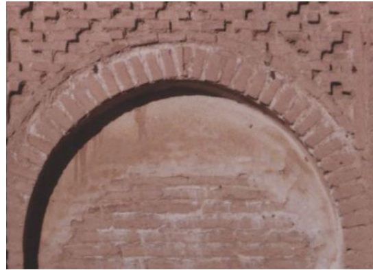
تصویر ۵. تاقنما با چفد مازه‌ای (بیز)، (نگارندگان)