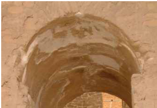
تصویر ۹. اجرای شانه یا هویه (نگارندگان)