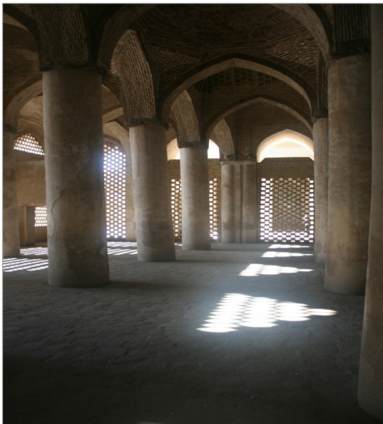
تصویر ۵. شبستان شمالی مسجد جامع (عتیق) اصفهان (نگارندگان، ۱۳۹۳)

که این مسأله می‌تواند به علت تناسبات نزدیک به یک (نسبت طول به عرض در پلان واحدهای فضایی) در اکثر فضاها و رنگ آرامش‌بخش آبی ۲۴ فیروزه‌ای در کاشی‌کاری‌ها و کاربرد خشت و گل و آجر در بنای مسجد که منجر به خاطره‌انگیز بودن آن می‌شود، باشد. ضمن این که روابط معنادار بین صفات نشان می‌دهد که از دید استفاده‌کنندگان، بنا هرچه «خاطره‌انگیزتر» باشد «آرامش» بیشتری دارد. پرسشنامه‌ها نشان می‌دهند که مسجد از دید استفاده‌کنندگان «دلپاز» است. روابط معنادار بین صفات نشان می‌دهد که بین صفات «دلپاز» و «روشن» و «دلپاز» و «پرنور» ارتباط برقرار است؛ از این رو می‌توان گفت حیاط وسیع مسجد (که استفاده‌کنندگان بیشترین حضور را در آن دارند) و پرنور بودن از ویژگی‌های آن است، منجر به پدید آمدن معنای دلپازی از معماری مسجد در استفاده‌کنندگان می‌شود.