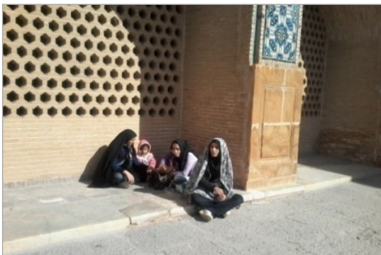
تصویر ۷. ایوانچه‌های ضلع شمالی که برای افراد حاضر در آن تشکیل یک قلمرو می‌دهد (نگارندگان، ۱۳۹۳)