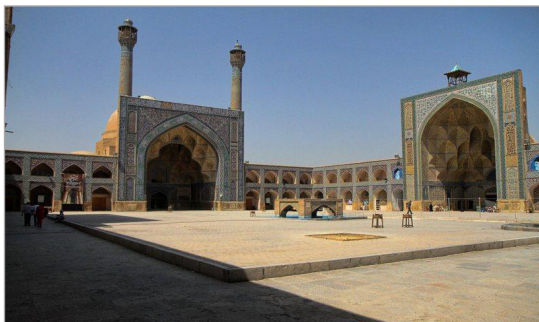
تصویر ۲. ایوان غربی (سمت راست) و جنوبی (سمت چپ) مسجد جامع (عتیق) اصفهان (نگارندگان، ۱۳۹۲)

جهت بررسی علل و نوع رفتارهای به وقوع پیوسته در مسجد جامع (عتیق) اصفهان، از میان دو نوع روش پژوهشی اصلی در روانشناسی (اکتشافی و فرضیه)، نوع فرضیه و از میان دو روش اصلی اثبات فرضیه (پژوهش میدانی و پژوهش آزمایشگاهی) پژوهش میدانی انتخاب گردید و از میان روش‌های مختلف پژوهش میدانی، از روش «مشاهده» و «پرسشنامه» استفاده شده است. در روش «مشاهده»، دو فن «تهیه فهرست رفتاری ۱۶ » و «تهیه نقشه رفتاری ۱۷ » و در روش «پرسشنامه»، دو فن «فتراق معنایی ۱۸ » و «اخذ تصویر (نقشه) ذهنی ۱۹ » برای دریافت معنای نقش بسته از فضا و بنا در ذهن استفاده‌کنندگان به کار رفته است. متغیرهای مداخله‌گر شامل سه عامل اصلی «سن»، «جنس» و «هدف حضور در بنا» هستند که مدنظر قرار گرفته‌اند. پرسشنامه از ۹۰ نفر از استفاده‌کنندگان که به صورت اتفاقی ساده گزینش شدند، اخذ شد که ۸۶ پرسشنامه فتراق معنایی و نقشه ذهنی قابل بررسی بودند. از نظر هدف حضور در بنا، ۴۰ نفر گردشگر، ۴۶ نفر عبادت‌کننده و از نظر جنسیت و سن، ۳۲ نفر زن، ۵۴ نفر مرد، ۲۲ نفر کودک، ۳۰ نفر جوان، ۱۶ نفر میان‌سال و ۱۸ نفر کهن‌سال جامعه آماری را