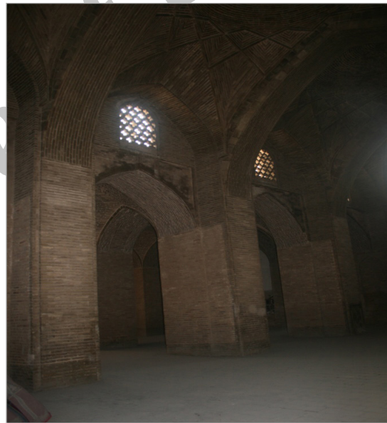
تصویر ۴. شبستان جنوبی مسجد جامع (عتیق) اصفهان (نگارندگان، ۱۳۹۳)