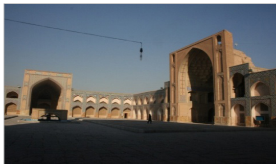
تصویر ۱. ایوان شرقی (سمت راست) و شمالی (سمت چپ) مسجد جامع (عتیق) اصفهان (نگارندگان، ۱۳۹۲)