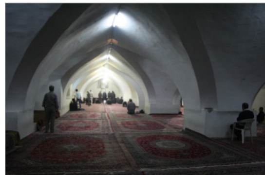
تصویر ۶. شبستان بیت‌الشتاء در مسجد جامع (عتیق) اصفهان (نگارندگان، ۱۳۹۳)