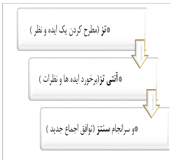
تصویر ۲. اجزای فرایند دلفی (نگارندگان)

فرضیه ۳. میزان مهارت دانش‌آموختگان کارشناسی مرمت بناهای تاریخی در سطح متوسط است.