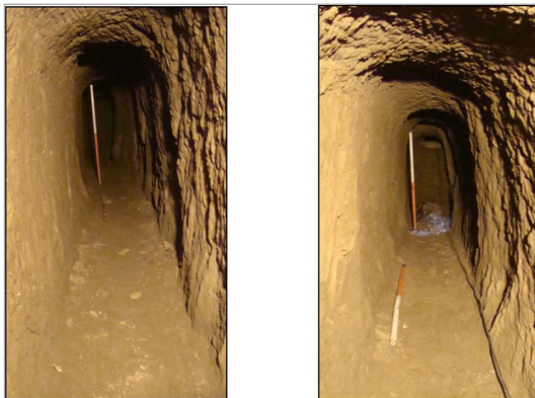
تصویر ۷. کانال‌های ارتباطی بین حلقه چاه‌ها (نگارندگان)

بوده است. همچنین ارتباط فضاها با کانال‌ها از طریق همان حلقه چاه‌ها امکان‌پذیر است (تصاویر ۵ و ۶ و ۷).