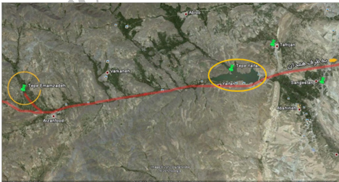
تصویر ۲. راه دسترسی و موقعیت قرارگیری مجموعه ارزانفود نسبت به شهر همدان، سد اکباتان و تپه یلفان (نگارندگان)

در مجموعه آثار معماری دست‌کند ارزانفود نیز همانند سایر محوطه‌های باستانی مهم، دسترسی و نزدیکی به منابع آب در شکل‌گیری و ایجاد آن مجموعه، بسیار مهم و چشمگیر بوده است. یکی از مهم‌ترین ویژگی‌های مجموعه، شکل‌گیری در مجاورت رودخانه‌ای دائمی است که تقریباً در تمام ماه‌های سال آب در جریان بوده است ۱ . آب این رودخانه از ارتفاعات رشته‌کوه الوند و از قله کله قاضی و سرخ‌بلاغ سرچشمه می‌گیرد ۲ . این رودخانه پس از عبور از میان مناطق کوهپایه‌ای و منطقه دربند ارزانفود از مجاورت غربی مجموعه دست‌کند ارزانفود گذشته و پس از عبور از میان روستاهای ارزانفود، علی‌آباد و یلفان در پشت سد یلفان جمع می‌گردد و تأمین‌کننده بخشی از آب آشامیدنی شهر همدان محسوب