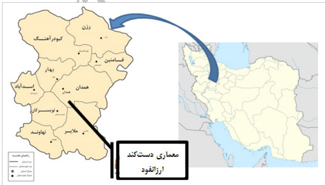
تصویر ۱. موقعیت قرارگیری مجموعه آثار معماری دست‌کند ارزانفود (نگارندگان)

آب، بر پایه باورهای اساطیری ایران باستان، دومین آفریده مادی است که اورمزد در گاهنبار دوم از گاهنبارهای آفرینش