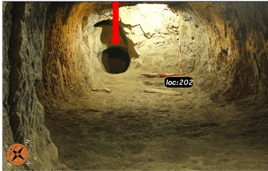
تصویر ۵. وضعیت قرارگیری حلقه چاه (منتهی به کانال و سطح محوطه) در انتهای فضای شماره ۲ کارگاه شماره ۵