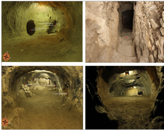
تصویر ۴. نمایی از ورودی و فضاهای زیرزمینی دست‌کند مجموعه