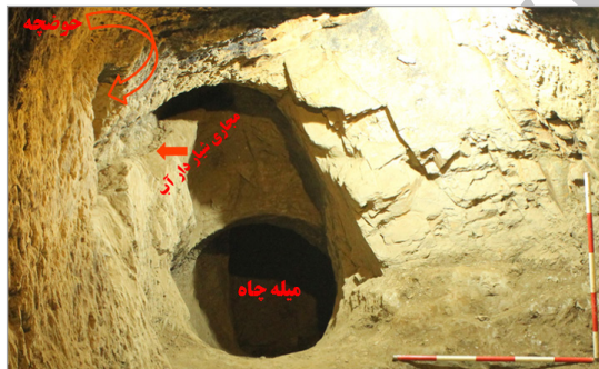
تصویر ۹. وضعیت قرارگیری حلقه چاه، مجرای آب و حوضچه در فضای شماره ۲ کارگاه شماره ۵ (نگارندگان)