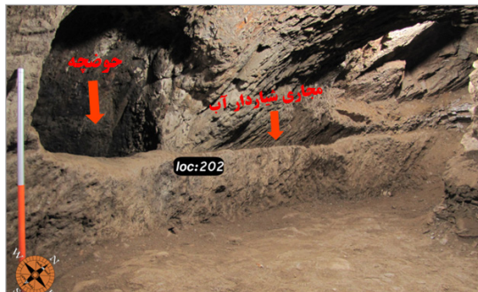
تصویر ۱۰. مجرای آب منتهی به حوضچه در دیواره غربی فضای شماره ۳ کارگاه شماره ۳