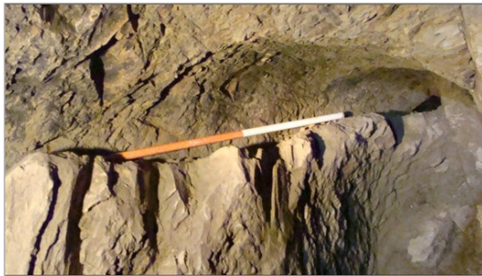
تصویر ۸. مجاری آب ایجادشده در دیواره فضاها (نگارندگان)

در برخی از فضاهای این مجموعه چندین حوضچه در مجاورت یک حلقه چاه قابل مشاهده است که از طریق روزنه‌ای به همدیگر وصل هستند. پس از پر شدن حوضچه اول، دومی و سپس سومی پر می‌شده که از این طریق علاوه بر ذخیره آب می‌توانستند آب موجود در فضاها را تصفیه نمایند و املاح موجود در آب را ته‌نشین نمایند. در برخی موارد حلقه چاه‌های منتهی به کف فضاهای این مجموعه دارای لبه و شیاری هستند که محلی برای تعبیه درپوش حلقه چاه محسوب می‌گردیده است. بدین منظور از تخته‌سنگ‌های صاف و قطور برای این موضوع استفاده می‌گردیده که حکم درپوش را داشته و همین موضوع مانع آلودگی آب شده و