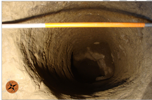
تصویر ۶. حلقه چاه در کف فضای شماره ۲۹ کارگاه شماره ۵ (نگارندگان)