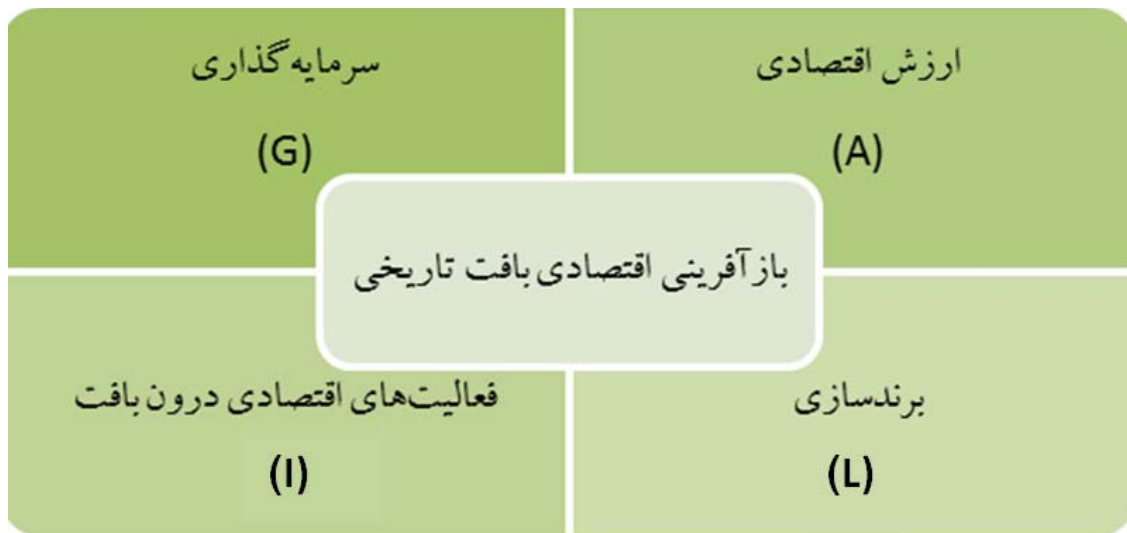
تصویر ۲. مدل بازآفرینی اقتصادی بافت تاریخی بر اساس نظریه کارکردگرایی ساختاری (نگارندگان)