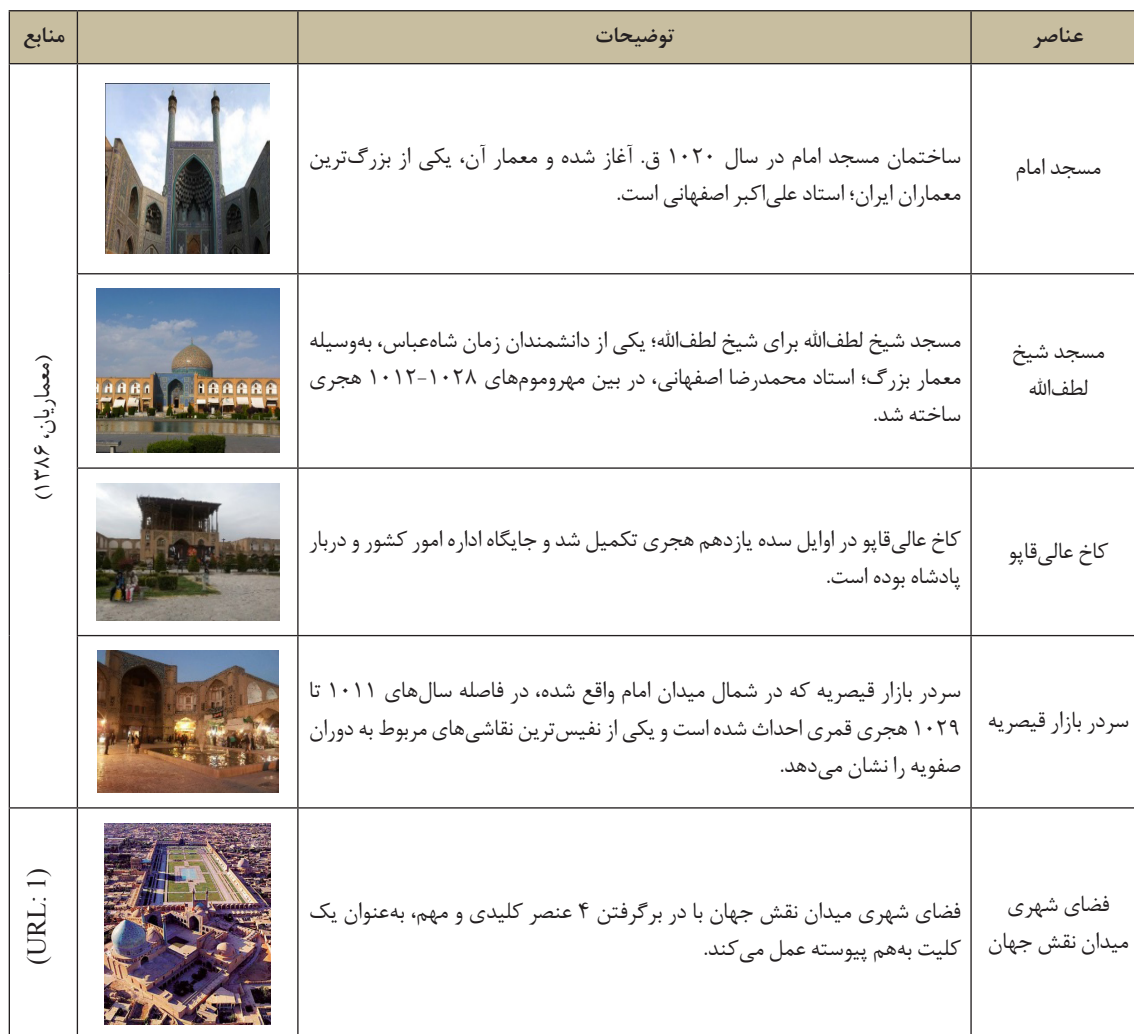
جدول ۲. عناصر میدان نقش جهان

جدول ۷، نشان‌دهنده بررسی ماتریس وزنی زیرمعیارهای ارزش اجتماعی-فرهنگی است. به لحاظ ارزش نمادین، مسجد امام، بالاترین امتیاز را به خود گرفته است. فضای میدان نقش جهان به لحاظ ارزش‌های تفریحی، هویت، تداوم خاطرات جمعی و وحدت در عین تنوع، بالاترین امتیازها را گرفته است. این نشان می‌دهد که تقریباً به لحاظ ارزش اجتماعی-فرهنگی، فضای شهری میدان نقش جهان در مجموع از وزن بیشتری برخوردار است. ماتریس وزنی زیرمعیارهای ارزش احساسی در ارتباط با ۵ مؤلفه مورد بررسی، در جدول ۸ نشان داده شده است. با توجه به این جدول مشخص شد که به لحاظ ارزش مذهبی، مسجد