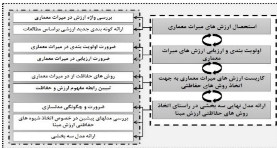
تصویر ۱. فرآیند پژوهش (نگارندگان)