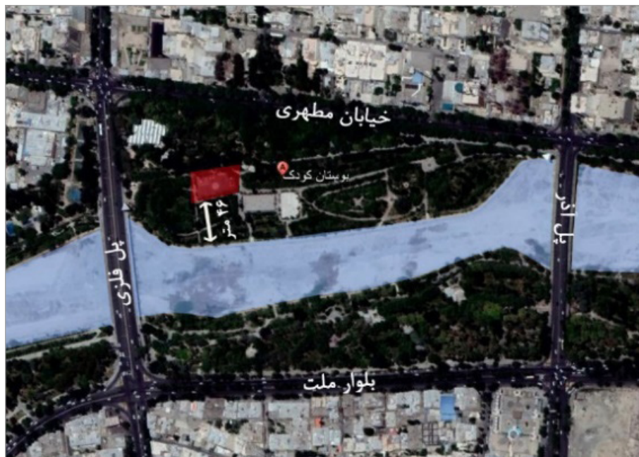
تصویر ۳. محدوده فضای بازی بوستان کودک (google earth pro, 2018)

زمینه، بسیار فقیر است (خبرگزاری مهر، ۱۳۹۶). تصویر ۳، نشان‌دهنده موقعیت بوستان کودک در منطقه یک کلان‌شهر اصفهان است. این بوستان، در کنار رودخانه زاینده‌رود واقع شده و از شمال، به خیابان مطهری، شرق، به پل آذر، جنوب، به رودخانه زاینده‌رود و غرب، به پل فلزی محدود می‌شود. فاصله این فضای بازی تا رودخانه زاینده‌رود، تقریباً برابر با ۴۶ متر است (قطعه قرمز رنگ در تصاویر ۳ و ۴).