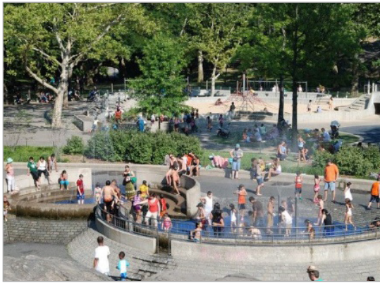
تصویر ۲. زمین بازی کمبریج (URL: 3)

اساس خروجی‌های مدل تحلیل عاملی اکتشافی، راهکارهای طراحی جهت ارتقای کیفیت فضاهای بازی با تأکید بر ایمنی و امنیت ارائه شده‌اند.