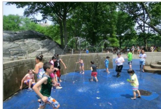
تصویر ۱. زمین بازی پارک هکسچر (سمت راست) (URL: 1) و زمین بازی یادمان اسمیت (سمت چپ) (URL: 2)