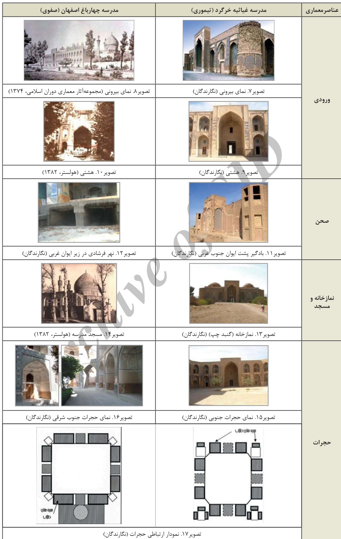
جدول ۲. تصاویر تطبیقی معماری مدرسه غیاثیه خرگرد (تیموری) و مدرسه چهارباغ اصفهان