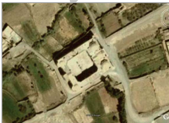
تصویر ۱. عکس هوایی از موقعیت مدرسه غیاثیه خرگرد در خواف

مسجد- مدرسه چهارباغ اصفهان، حد فاصل ضلع شرقی خیابان چهارباغ و کاروانسرای عباسی قرار دارد که «در فاصله سال‌های ۱۱۱۶ تا ۱۱۲۶ ه.ق. به‌دستور شاه‌سلطان حسین برای تدریس و تعلیم طلاب علوم دینی بنا شده است» (موسوی فریدنی، ۱۳۷۸: ۱۰۷). در طول ضلع شمالی آن، بازارچه بلند یا شاهی قرار دارد که سال‌هاست به‌نام بازار هنر در میان عموم معروف است. این بازار در دو طبقه ساخته شده است و وسط آن چهارسوقی با گنبد بزرگ وجود دارد که به‌وسیله دری مجلل با ضلع شمالی مدرسه (ورودی فرعی) ارتباط پیدا می‌کند (ریاحی، ۱۳۸۵: ۲۰۷).