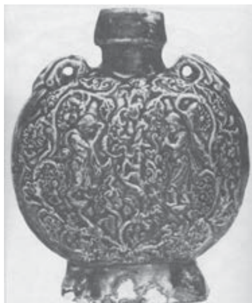
تصویر ۱۱. قمقمه مسافران، اواسط ۸ م. (تریگر، ۱۳۸۴: ۱۲۵).