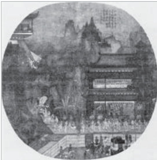
تصویر ۶. چائوپوچو، کوه‌های صخره‌ای در مسیر رودخانه در پاییز، جزئی از تصویر، ۱۲م. (Sullivan; 1967:55).

نقاشی‌های چینی جایی برای خود باز نکرد. در عوض، نوع خاصی از گیاهان برای ارائه بهشت توصیف شده در آئین بودایی نمودار گشت. این نوع، ساده‌سازی گل و گیاه، وابسته به نقوش بیگانه با هنر تصویرگری شرق بود. آثار موجود در هنر ساسانی که به گونه‌ای مطلوب می‌توانست دست‌مایه‌های بودایی را نشان دهد، از این دست نقش‌مایه‌هاست. این نوع تزئینات معابد بودایی به مرور گسترش یافت و در کاخ‌ها و خانه‌های اعیانی چینی‌ها ظهور نمود. تغییر ذائقه مردم و رواج یا احیای دوباره آئین‌های محلی چینی سبب شد تا نقاشان به نشان دادن نقاشی‌های طبیعت‌گرایانه گیاهان روی آورند. از قرن دهم میلادی/سوم هجری قمری، می‌توان به هنرمندانی برخورد که به خاطر کشیدن گل شهرت یافته بودند. در این نقاشی‌ها برخلاف اصول کلی نگارگری چینی رنگ به میزان بیشتری کاربرد داشته‌است. به بیان دیگر، در نقاشی چینی اصولاً از رنگ‌گذاری آن هم به صورت قشری و با هویت مشخص پرهیزی می‌شود. لیکن در این دوره با گزاردن رنگ بر زمینه و استفاده از رنگ‌های شدیدتر برای نشان دادن جزئیات روی زمینه به نوعی بر کاربرد رنگ تأکید می‌شود آن‌چنان که در پرداختن به موضوع طبیعت می‌توان به نمونه‌هایی کاملاً متفاوت نسبت به آثار دیگر توجه کرد که سنت تصویری ساسانی را تداعی می‌کنند.