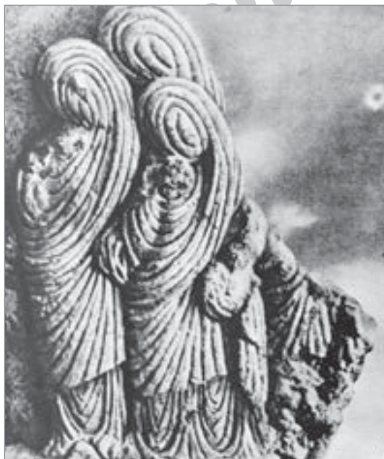
تصویر ۱۰. زنان پوشیده در حجاب، پالمیر، هنر اشکانی، قرن نخست میلادی ( http://dome.mit.edu/handle/1721.3/1837/ )

همچنین تصویر شکار گورخر مربوط به دورا/روپوس ۲۸ که سده دوم میلادی انجام شده (تصویر ۱۳)، نمونه‌ای آشکار از سبک نگارگری دوران اشکانی است که در دوره ساسانیان نیز ادامه پیدا کرد. حالت تاختن اسب در این نقاشی دیواری قابل تأمل است به گونه‌ای که، داستان اسب با فاصله‌ای معین از هم جدا شده حال آنکه پاهای اسب بهم نزدیک‌تر است. باید تأکید کرد که این نوع تصویرکردن اسب صفت ویژه نقوش ساسانی است که مورد پذیرش همگان قرار گرفت. نقاشی دیواری چینی از معبد تونگ کو ۲۹ مربوط به اوایل قرن پنجم میلادی نشان‌دهنده سوارانی است که به شیوه اشکانی