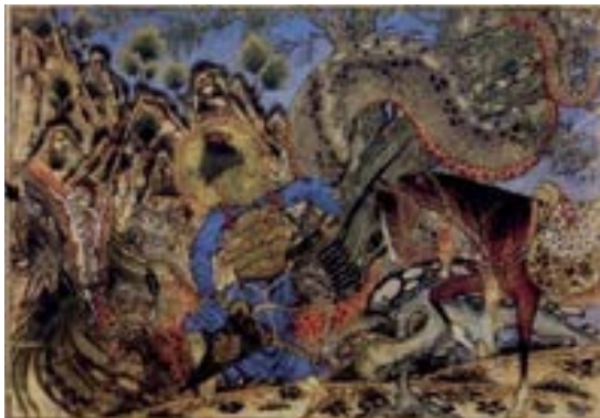
تصویر ۳. نبرد بهرام و اژدها، شاهنامه بزرگ، ۸۵۸ ق. (پوپ، ۱۳۸۷: ۸۳۹).

و برداشت متفاوت از این حیوان افسانه‌ای است. هرچند در هر دو جغرافیا می‌توان به قدرت و رعب‌آوردن این موجود پی‌برد لیکن در تصویر ایرانی، نحوه نمایش اژدهای شکست‌خورده محتضر با مفهوم چینی که این موجود را نماد انرژی و قدرتمندی می‌داند، اختلاف قابل توجهی دارد. همین نکته در صحنه شکست دادن اژدها به دست اسکندر نیز دیده می‌شود. قدرت و خشونت صحنه‌های رزم در این کتاب به گونه‌ای عالی آشکار شده آن‌چنان‌که، دستاوردهای این نگاره‌ها در مکاتب بعدی زمینه‌ساز آثار فراوان با بیان متفاوت گشته‌است. درباره کتاب شاهنامه بزرگ بسیار اظهار نظر شده‌است. آنچه درباره زمان انجام این نسخه می‌توان گفت آنست که با وجود اختلاف نظر موجود در شیوه اجرای تصاویر در اوایل قرن هشتم هجری قمری/چهاردهم میلادی اتفاق عقیده هم، وجود دارد. از آثار جاودانه شاهنامه بزرگ باید به نگاره مرگ اسکندر اشاره نمود (تصویر ۴). این تصویر بایستی طبق گفته فردوسی، از دنیارفتن اسکندر را در بابل نشان دهد. در این واقعه‌نگاری، مراسمی را در اسکندریه که در آنجا هزاران سوگوار جنازه اسکندر را هنگام غروب آفتاب به خاک سپرده‌اند، تصویر شده‌است. لیکن صحنه مورد