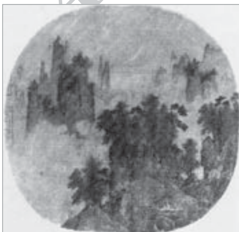
تصویر ۵. منسوب به لی تانگ، درختان پرشمار و کوه‌های عجیب نقاشی روی بادبز، اوایل قرن ۱۲ م. (Sullivan; 1967: 52).

سلسله سونگ جنوبی (۹۶۰ الی ۱۲۷۹ م./ ۳۴۹ الی ۶۷۷ ه.ق) پس از تثبیت به‌دست کائو تسونگ (۱۱۲۷ الی ۱۱۶۲) که خود هنرمندی نقاش و خوش‌نویس بود، اقدام به راه‌اندازی مجدد فرهنگستان سلطنتی نگارگری کرد. در نقاشی‌های دوره سونگ جنوبی چند رویه را می‌توان مشاهده نمود. نوع موضوعات مورد علاقه هنرمندان شکل‌های مختلفی از آثار را همچون سنت‌گرایی، نقاشی پیکره، پرندگان و گل‌ها و حیوانات را پدید آورده است. از میان هنرمندان مطرح این دوره لی تانگ ۷ ، به‌دلیل زاده‌شدن حدود سال‌های (۱۰۵۰ م./ ۴۲۹ ه.ق) هنگام آغاز سلسله سونگ جنوبی، می‌باید دوره مغول در سال‌های آخر عمر خود به‌سر می‌برده است. وی در نقاشی به‌ویژه ترسیم صخره و کوه مهارتی چشمگیر داشت (تصویر ۵)