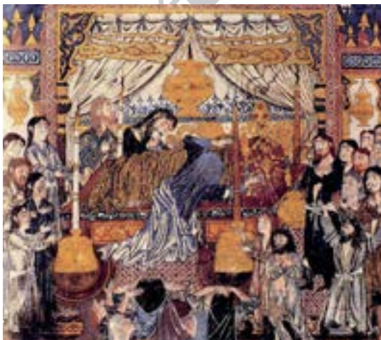
تصویر ۴. مرگ اسکندر، شاهنامه بزرگ، ۸۵۸ ق. (گری، ۱۳۶۹: ۱۶۰).

و پس از دوران مغول با گذر از هنر چین دارد «آنچه از کشفیات تاریخی نقاشی ایران قبل از مغول نتیجه می‌شود این است که نقاشی ایرانی به نیروی بیان و تخیل نمی‌رسد و دارای خصوصیت ویژه‌ای نمی‌شود مگر اینکه با نقاشی چین تماس پیدا کند. این عاملی است که نبوغ ایرانی را از بند سایر هنرهای مزین کردن کتاب از طریق فعل و انفعالاتی مرموز آزادمی‌سازد.» (گری، ۱۳۶۹: ۲۲). معلوم نیست که بازیل گری از این اظهار نظر چه نتیجه‌ای می‌خواهد بگیرد. اگر منظور او این است که همراهی هنر ایران و چین به شکل‌گیری هنر ایرانی با هویت ملی انجامیده‌است، می‌توان آن را پذیرفت لیکن در ادامه می‌گوید که نبوغ ایرانی از هنرهای تزئین کتاب رهایی‌یافته و معلوم نیست این اتفاق به چه صورت و کیفیتی رخ داده و در جهت بهبود هنر کتاب‌آرایی محقق شده یا خیر. اصولاً به کارگیری واژه مغولی برای آنچه در سده‌های هفتم و هشتم هجری قمری / سیزده و چهارده میلادی در تبریز اتفاق افتاده، صحیح نیست و همان‌گونه که دیگران نیز به این موضوع اشاره نموده‌اند، هم‌زمانی تأثیر هنر چین بر ایران با حکمرانی مغولان، این نام‌گذاری را پدید آورده‌است. هرچند در ابتدا حضور عناصر چینی در نگارگری ایران، می‌تواند منشاء شرق دور داشته‌باشد لیکن پس از مدتی نه‌چندان طولانی این عناصر به گونه‌ای در هنر ایران محو شدند که با گرفتن رنگ و بویی کاملاً ایرانی، از شکل اولیه خود ساقط و به عنصری محلی تبدیل گردیدند. از میان این مضامین می‌توان به اژدها و ابر معروف چینی اشاره نمود. ویژگی ایرانی بودن مینیاتورهایی که در این سرزمین ترسیم گردید به‌مرور از قرن هفتم هجری قمری بیشتر از گذشته شد و نوعی عنایت به بیان تصویری دوره ساسانی پدید آمد که در ادامه نمونه‌هایی از آنها ارائه خواهد شد.