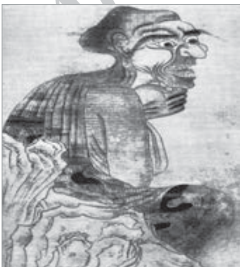
تصویر ۷. کوان هسیو، راهب لوهان، جزئی از تصویر، حدود ۹۴۰ م (Sullivan; 1967:62).

علت پایان یافتن حکومت سونگ جنوبی زمینه‌های مختلفی همچون فساد درونی داشت. سلسله یوان یا همان حکومت مغول از (۱۲۸۰ الی ۱۳۶۸ م. / ۶۷۹ الی ۷۶۹ ه.ق) در چین قدرت داشت. آنها همچون خویشاوندان مستقر در سرزمین‌های غربی خود از هنر چیز زیادی نمی‌دانستند و نسبت به آن بی‌تفاوت بودند. با این حال از آنچه در نقاشی چین اتفاق افتاده، می‌توان دریافت که این دوران در شکل‌گیری سبک‌های خاص چینی مؤثر بوده است. قوبلای قاآن از سال ۱۲۸۶ / ۶۸۵، بر کشور چین حکمرانی کرد و پایتخت خویش را نیز پکن