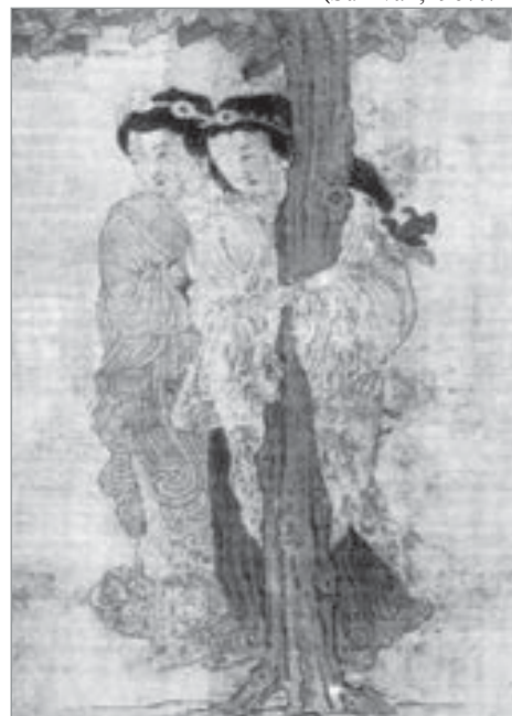
تصویر ۹. دوشیزگان ایستاده در کنار درخت، قرن ۷ م. (Sullivan; 1967: 60).