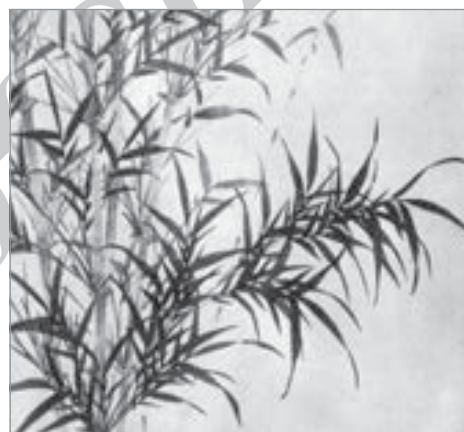
تصویر ۸. لیانگ کان، بامبو، جزئی از تصویر، ۱۴ م. (Sullivan; 1967: 74).

نقش برجسته‌ای در پالمیر به دست آمده که مربوط به سده نخستین میلادی و دوران حکومت اشکانیان است (تصویر ۹). این اثر به دلیل کاربرد نوعی خطوط پیچ و تاب‌دار به نقوش ساده شده هنر ایران که همواره به عنوان هویت خاص این آثار معرفی شده‌اند، اشاره دارد. مقایسه این نقش برجسته با نقاشی ویبی چی/ایسنگ با عنوان دوشیزگان در کنار درخت (تصویر ۱۰)،