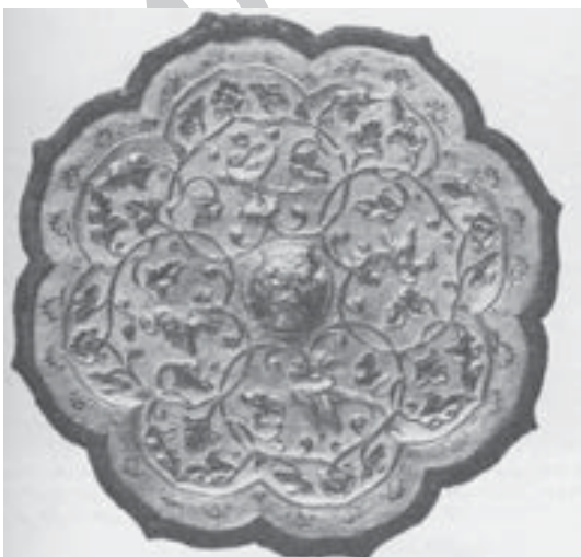
تصویر ۱۶. نقش پشت آینه با طرح برگ و نقش مایه طوماری پرنده و گل، میانه قرن ۸ م. (تریگر، ۱۳۸۰: ۱۲۴)