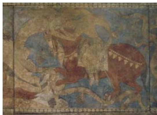
تصویر ۱. رستم، نقاشی دیواری، سغد، سده ۸ م. (Sims, 2002: 210)

بازیل‌گری معتقد است که بخش اعظم قرن چهاردهم میلادی، هنرمند ایرانی عناصری از منظره چینی را که به دستش رسیده به گونه‌ای ناشیانه استفاده کرده است. تقلید از طریق تزئینات آثاری همچون سرامیک و پارچه صورت گرفته است. عواملی مانند چگونگی نشان دادن آب به صورت موج، بهره‌گیری از موجوداتی مانند اژدها، عنقا و درنا که روی پارچه‌های وارداتی وجود داشته، در نقاشی‌های ایرانی آشکار شده است. باین وجود، گری بیان می‌کند که این عناصر بایستی از راه دیگری به ایران آمده باشند. راه‌های احتمالی دیگری که می‌توانسته به این مهم بیانجامد، رفت‌وآمدهای بین دو تمدن بوده که توسط سردمداران حکومتی و فرستادگان سیاسی و بازرگانی صورت می‌پذیرفته است. زمان نصر دوم سامانی اوایل قرن چهارم هجری قمری (دهم میلادی)، نقاشان چینی برای مصور کردن کلیله و دمنه از چین دعوت می‌شدند تا اثری برای اثبات این مدعا ارائه نمایند لیکن نتوانستند. تا آنجا که امروزه، نمی‌توان نفوذ چین را در نقاشی ایران پیش از مغول (قرن هفتم هجری قمری / اوایل سیزدهم میلادی) مشاهده نمود (گری، ۱۳۶۷: ۲۷). البته باید افزود که بین سال‌های ۷۶۲ تا ۷۷۶ ه.ق. در تبریز به این کتاب و تصویرگری آن توجه شد و از نمونه‌های باقی‌مانده آن زمان می‌توان باردیگر به وجود مناظر چینی گونه اشاره نمود (تصویر ۲). باینکه از نگاره‌های موجود در این نسخه‌ها به عنوان نمونه‌ای از نفوذ چینی در ایران پیش از حمله مغول یاد می‌شد لیکن، صاحب‌نظران در رد این نظر اتفاق نظر دارند. برای نمونه، کونل ۲ بر این باور است که «عناصر خاور دور در منظره‌سازی این مینیاتورها نسبت به دیگر نسخه‌های آن دوران به نحو کامل‌تری با ذوق ایرانی وفق یافته‌اند.» (کونل، ۱۳۸۷: ۲۰۱۲).