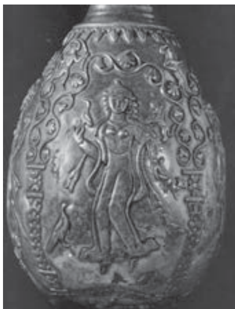
تصویر ۱۲. جام کلاردشت، م. ۶ (گدار، ۱۳۵۸: ۸۸).