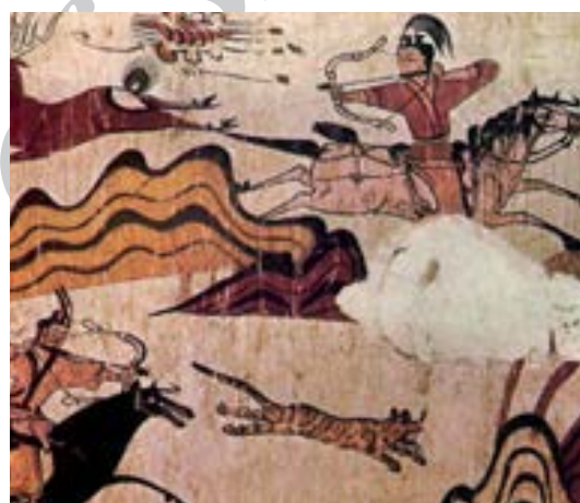
تصویر ۱۳. نقاشی دیواری صحنه شکار، جزئی از تصویر، معتونگ کو، حدود ۴۰۰ م. (Ganne; 1998:126).