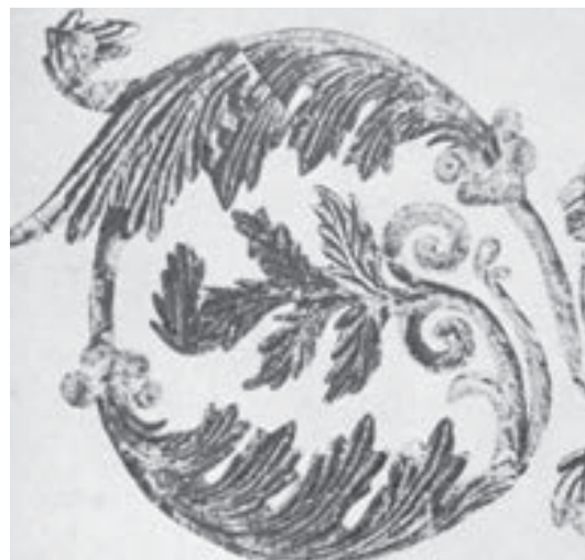
تصویر ۱۵. نقش مایه انجام شده بر دیوار کاخ بیشاپور، هنر ساسانی، قرن ۳ م. (گیرشمن، ۱۳۵۸: ۱۸۸).