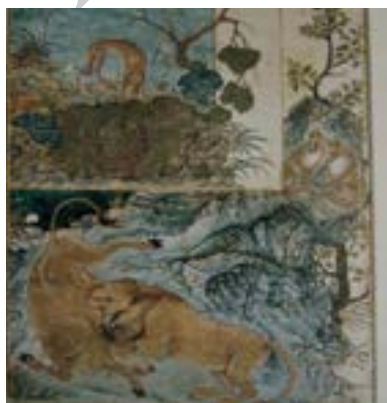
تصویر ۲. کلیله و دمنه، سده ۸ ه.ق. (پوپ، ۱۳۸۹: ۸۴۳)

تأسیس ربع رشیدی یا رشیدیه به دست خواجه رشیدالدین فضل‌الله از مهم‌ترین وقایع در پیشبرد مکتب تبریز است. توجه وی به نسخه‌برداری کتاب‌ها و صرف هزینه‌های کلان جهت نسخه‌برداری آثار ارزشمند، سبب شد تا این مجموعه بزرگ به اعتباری بی‌سابقه دست یابد. همچنین نگارش "جامع‌التواریخ" که به دستور غازان خان صورت گرفت، زمینه‌ای برای تصویرگری هنرمندان ساکن در تبریز شد. از ۸۸۰ صفحه این کتاب که اکنون در انگلستان است، این‌گونه برداشت می‌شود که هنر چین در نگاره‌ها تأثیرگذار بوده است. مناظر و کوه‌های این کتاب به سبک تانگ اشاره دارد. هرچند این سبک، نوعی نقاشی چینی است که بیشتر در ترسیم انسان‌ها متجلی می‌شود و در آن نوعی سادگی اجرا به چشم می‌خورد و بیشتر آن را دور از لطافت و چیره‌دستی معرفی می‌کنند. کتاب "منافع‌الحيوان" با ۹۴ تصویر، زمان غازان خان و احتمالاً حدود سال ۶۹۸ ه.ق. / ۱۲۹۹ م. در مراغه نسخه‌برداری شده و از نمونه‌های بارزش به دست آمده از مکتب تبریز است. نگاره‌های این کتاب بنابر قولی ۱ ، در یک‌زمان ترسیم نشده چراکه بعضی با رنگ‌های به اصطلاح پریده به سبک نقاشی‌های چینی و برخی دیگر به شیوه مکتب عباسی (بغداد)، اجرا شده‌اند. نوع ترکیب‌بندی نگاره‌های این کتاب دارای فضای منفی بیشتری نسبت به فضای مثبت است. به بیان دیگر، میزان فضای آسمان بر میزان استفاده از زمین برتری دارد. ریزه‌پردازی و توجه به جزئیات نیز از ویژگی‌های آثار موجود در این نسخه‌ها است. کتاب دیگر این دوره که به منافع‌الحيوان شباهت زیادی دارد، "آثارالباقیه" نگاشته ابوریحان بیرونی است. ویژگی‌هایی یاد شده را، می‌توان به عنوان خصوصیات به دست آمده از هنر چین داشت. به همین روال نیز، اظهار نظرهایی موجود است که قصد پیوند نگارگری ایرانی را پیش