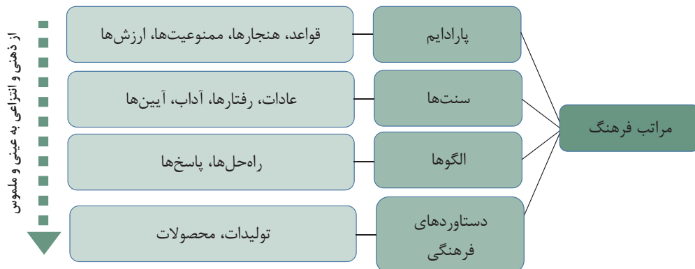
تصویر ۲. مراتب مختلف فرهنگ براساس نظریه پارادایمی کوهن (کوهن، ۱۳۸۴).

در الگو صحبت از راه‌حل است؛ راه‌حلی کلی برای یک سری از مسائل مشابه که به صورت‌های گوناگون در زندگی تکرار می‌شوند. در واقع، الگوها چکیده و عصاره تجربیاتی‌اند که از نسلی به نسلی دیگر، توسط فرهنگ به شکل میراثی گرانبها انتقال می‌یابند (الکساندر، ۱۳۸۶: ۱۲۶). البته الگوها فقط به مسائلی که در گذشته مصادیقی داشته‌اند، منحصر نمی‌شوند. گاهی مسائلی دیده می‌شود که در گذشته نظیری نداشته‌اند و الگوهای جدیدی را نیز می‌طلبند. بنابراین پس از طرح این مسائل، تلاش‌هایی برای پاسخ‌گویی به آن‌ها صورت می‌گیرد و راه‌حل‌های موفق نیز پیدا می‌شود. این راه‌حل‌های موفق می‌توانند در قالب یک الگو تدوین گردند (زرین‌مهر، ۱۳۸۳: ۸۷) و در طول زمان با پیدا کردن جایگاه خویش در منظومه فرهنگ، معانی چندگانه یافته و همان‌طور که بیان شد، می‌توانند با افزودن الگوهای رفتاری و عملی دیگر و تئوری‌ها و ابزارهای مخصوص به گرد خویش، قابلیت تبدیل شدن به سنت را یابند یا به عنوان عیار و معیار اندازه‌گیری ارزش‌ها و شناخت در مرتبه پارادایم جای گیرند. در بسیاری موارد نیز در جامعه اختراع و ابداعی صورت می‌گیرد که به مرور جزئی از سرمایه فرهنگی می‌گردد. بسیاری از الگوها این‌چنین به وجود می‌آیند. گاهی الگویی از جوامع دیگر به عاریت گرفته می‌شود. در واقع، آنچه داد و ستد فرهنگی نامیده می‌شود علاوه بر محصولات، شامل الگوها نیز می‌گردد که البته این داد و ستدها به نوبه خود می‌توانند بر مراتب بالاتر فرهنگی خصوصاً سنت‌ها تأثیر گذارند.