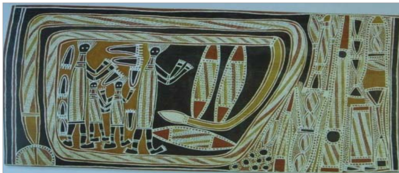
تصویر ۱۰. خواهران واویلاک، پدی داتانگو، نقاشی روی پوست درخت، ۱۹۸۰ (کاروانا، ۱۹۹۷: ۳۹)

مهمی است که هنرمند آن را بررسی کرده است. نیم‌دایره پائین، نماد گودال آب مقدس و محلی است که روایت از آنجا شروع می‌شود. در تصاویر دیگر معمولاً گودال آب به صورت یک دایره سیاه در وسط تصویر قرار دارد. در این تصویر همچنین حیوانی در قسمت پائین صفحه نشان داده شده که احتمالاً از جمله حیواناتی است که خواهران شکار کرده‌اند. اشیای دیگر موجود در تصویر احتمالاً اشیای آئینی و مقدس بومیان مانند بول‌رور ۴۶ هاست که در مراسم آئینی از آن‌ها استفاده می‌شود. در آثار بومیان معمولاً چندین نقطه دید وجود دارد اما نقطه دید غالب معمولاً از زاویه بالا است. این آثار، پرسپکتیو هوایی خود را از طرح‌های زمینی، نقاشی‌های بدنی و اشیای مورد استفاده در مراسم آئینی می‌گیرند.