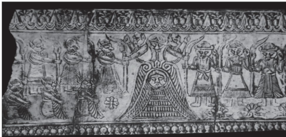
تصویر ۱. لوح زروان، سده‌های هفتم و هشتم میلادی، مفرغ، موزه سین سیناتی (هینلز، ۱۳۸۳، ۷۳)

تصاویری که بر وجود زروان و آئین او اشاره دارند، مربوط به چند لوح و تیردان قرن‌های هفتم و هشتم قبل از میلاد است که در منطقه لرستان کشف شده‌اند. اغلب این اشیای مفرغی از درون گورهای فردی یا جمعی کشف شده‌اند و بر این اساس، بیشتر در مراسم و آئین‌های مذهبی و تدفین استفاده می‌شده‌اند. در بیشتر منابعی که لوح مفرغی زروان را بررسی کرده‌اند، نوشته‌اند که زروان در مرکز قرار دارد و در دو طرف او دوره‌های مختلف زندگی او ترسیم شده‌است. سمت چپ پائین اشاره به خردسالی، سمت چپ بالا اشاره به بلوغ و در سمت راست، پیری او به نمایش درآمده است. درحالی که در هر دوره، شاخه‌ای از برسم در دست دارد (هینلز، ۱۳۸۳: ۲۰۸)، (تصویر ۱). اما این نظر، بررسی کامل‌تری را می‌طلبد؛ براساس روایت زروان، او موجودی دو جنسی است که در مرکز تصویر قرار دارد. در این تصویر او در بالا با سر مردانه و دارای ریش و در پائین با چهره‌ای زنانه دیده می‌شود. تصویر زروان، زمان کرانه‌مند را نشان می‌دهد