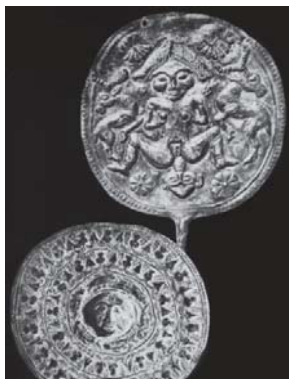
تصویر ۵. میله با صفحه مدور، سدهای هفتم و هشتم میلادی، مجموعه خصوصی نیویورک (گیرشمن، ۱۳۷۱: ۵۱)

از دیگر آثاری که مربوط به مفرغ‌های لرستان بوده و اسطورهٔ آفرینش را نشان می‌دهد، سنجاقی است که زنی را در حال زایمان نشان می‌دهد (تصویر ۵). قدمت این شیء فلزی نیز هم‌زمان با لوح زروان است. در کتاب "شناخت هویت زن ایرانی" آمده است: «تصویر زن بر روی سنجاق، بانو خدای مادر اقوام بومی آسیاست و از آسیای صغیر تا شوش مورد پرستش بوده است. این ایزدبانو در حال زایمان به تصویر درآمده است و پستان‌هایش را به حالت دوشیدن در دست دارد که احتمال می‌رود ایزدبانوی گیریشه ۲۲ باشد. آئین پرستش این ایزدبانو نانایه (ننه) تا زمان پارت‌ها ادامه داشته است. اما ظن و گمان رومن گیرشمن