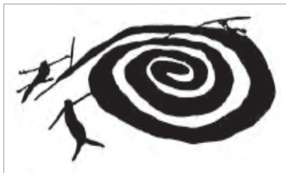
تصویر ۸. دو زن و مارچنبره زده، کنده کاری صخره‌ای، پیل‌بارا، استرالیا (Wright, 1968: 99)

نقاشان بومی، آفریننده ادبیات تصویری به شمار می‌روند. این نقاشان اساطیر پیچیده‌ای را که بیانگر زندگی معنوی ملت‌هایشان (عصر رؤیایها) است، روی پوست درخت به تصویر می‌کشند. علائم تصویری به کار برده شده، با منظور نقاشی‌ها چنان مطابقت دارند که نقاشان طبق یک نظم مقرر قبلی به آن‌ها شکل نمی‌دهند بلکه آزادانه در تابلوی نقاشی ترکیب‌شان می‌کنند. در تصویر ۹، از علائم نمادین برای ارائه داستان استفاده شده است. در اینجا در قسمت پائین، وسط صفحه، تصویر گودال آبی دیده می‌شود که کنار آن، درخت اوکالیپتوس روئیده است. یکی از خواهران مار مقدس را بیدار می‌کند و او از گودال آب خارج می‌شود (وسط تصویر) و برای بلعیدن دو خواهر و فرزندان‌شان، دور آن‌ها حلقه می‌زند. در سمت راست تصویر دو خواهر بازم دیده می‌شوند (کوپکا، ۱۳۶۱: ۹). براساس اسطوره خواهران و اوپلاک، مار پس از بلعیدن خواهران و فرود آمدن به زمین، محلی را برای انجام مراسم آئینی به وجود آورد که زمین آئینی سه گوشه در کناره‌های تصویر، به آن اشاره می‌نماید. فضای پر و خالی در تصویر مسئله