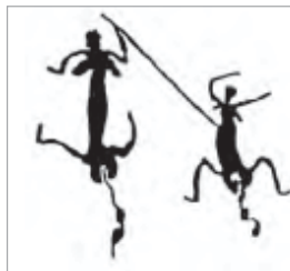
تصویر ۶ و ۷- دو زن در حال رقص، کنده کاری صخره‌ای، پیل‌بارا، استرالیا (Wright, 1968: 99)

برای تریبل ۴۴ مار اشاره به قدرت مارپیچی شکل کیهان و جهان هستی دارد (Triebels, 1958: 130). از نظر وارنر، مار دارای معانی ضد و نقیض فراوان بوده و در آسمان، بالاترین مکان و همچنین در زیرزمین، عمیق‌ترین نقطه گودال‌های آب جا دارد. بنابر دیدگاه وی، گرچه این مار احتمالاً یک افعی مذکر است اما دارای ویژگی‌های زنانه و مردانه و به عبارتی