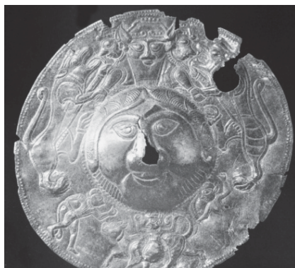
تصویر ۴. قسمت وسط سپر، سدهای هفتم و هشتم میلادی، مجموعه خصوصی شهر بال در سوئیس (گیرشمن، ۱۳۷۱: ۶۹)