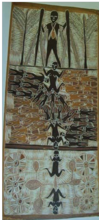
تصویر ۱۲. اسطوره آفرینش، خواهران دگنگ گاول، نقاشی روی پوست درخت اوکالیپتوس، ۱۹۹۵ (مورفی، ۱۹۹۸: ۷۴)

و در آنجا اردو زدند. آن‌ها دو ابزار حفاری داشتند که هنگام راه رفتن به آن‌ها کمک می‌کرد. خواهران با عصاهایشان چاه آبی حفر کردند و سپس آن‌ها را کنار چاه آب کاشتند که پس از مدتی تبدیل به درخت شد. همان‌طور که در تصویر ۱۲ دیده می‌شود، برادر در قسمت بالای تصویر با عصای حفاری ایستاده و در اطرافش درختانی روئیده‌اند. در قسمت وسط تصویر قدرت زنان در متولد کردن انسان‌ها تصویر شده است که شباهت آشکاری با تصویر ۵، الهه اشی دارد. زنان همچنین با این عمل خود حاصل‌خیزی، نعمت و فراوانی را به زمین و ساکنانش هدیه می‌دهند. در سومین بخش، عمل زایش زنان به صورت نمادین دیده می‌شود (Morphy, 1998: 74). «بنا به نظر برند» و وارنر خواهران واویلاک و خواهران دگنگ گاول بهم مربوط بوده و احتمالاً یکی هستند» (Berndt, 1951: 12-13; Warner, 1957: 399).