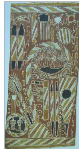
تصویر ۹. خواهران واویلاک، نقاشی روی پوست درخت، ۱۹۶۳ (کاروانا، ۱۹۹۷: ۴۴)

پس از مرگ داتانگو در سال ۱۹۳۳ م.، جیوادا ۴۸ اجازه تصاویر کشیدن مراسم آئینی خواهران را به دست آورد