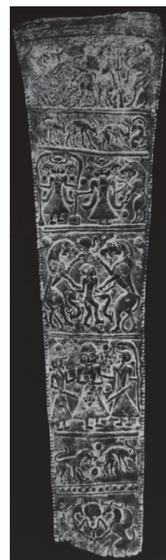
تصویر ۳. تیردان، مفرغ، سدهای هفتم و هشتم میلادی، بنیاد راجرز (گیرشمن، ۱۳۷۱: ۲۲)