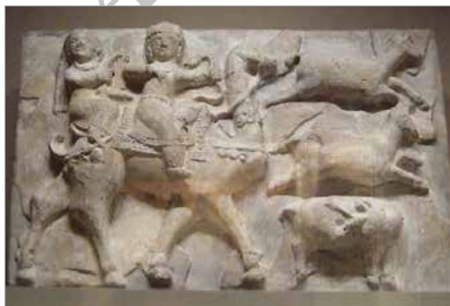
تصویر ۴. گچ‌بری بازسازی شده کاخ ساسانی چال ترخان ری (URL 4)

تشابهات تصویرهای شکار بهرام و کنیزک با توصیفات شاهنامه، در تعدادی از مَهرهای به دست آمده از دوره ساسانی نیز تکرار شده است. از سه مَهر منتسب به دوره ساسانی که