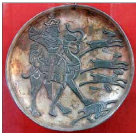
تصویر ۳. ظرف سیمین شماره ۳، موزه آرمیتاژ (URL 3)