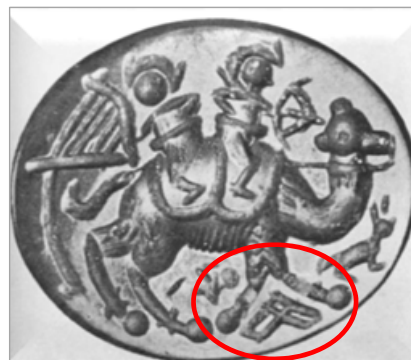
تصویر ۵. مهر منتسب به دوره ساسانی، مجموعه فیلیس اکرمین (Ettinghausen, 1979:pl.IVa)