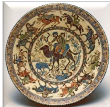
تصویر ۱۴. ظرف مینایی، سده‌های ششم و هفتم ه.ق.، موزه متروپولیتن (URL 10)