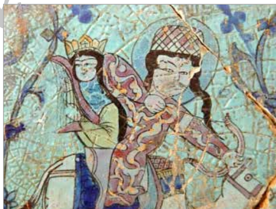
تصویر ۱۶. کاشی تزئینی، کاخ قبادآباد (URL 12)

نقاشان در خلق آثار هنری نوعاً از صحنه‌های برگرفته از اشعار کهن پارسی مدد می‌جستند (ر.ک. یارشاطر، ۱۳۶۸: ۵۴-۵۶). از نمونه نگاره‌هایی که داستان بهرام و کنیزک را نشان می‌دهد، از شاهنامه کبیر، ۴۳ یکی از معروف‌ترین نسخ شاهنامه فردوسی است که در زمان سلطان ابوسعید ایلخانی، در تبریز کتابت و نقش شده است (تصویر ۱۹). در تاریخ‌گذاری این نسخه میان پژوهشگران اختلاف است اما بیشتر محققان این نسخه را متعلق به سال‌های ۷۳۰ تا ۷۳۵ ه.ق. می‌دانند (رهنورد، ۱۳۸۸: ۲۲-۲۴). صحنه، براساس ابیات فردوسی و به‌صورت نسبتاً جامع و با جزئیات قابل قبول آمده است. بهرام و آزاده هر دو با لباس و تاج مغولی ترسیم شده‌اند. این نخستین بار است که بدون پرداختن به ابتدای داستان و همراهی آزاده با بهرام، تنها به فرجام و پیکر فروافتاده آزاده