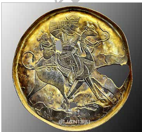
تصویر ۲. ظرف سیمین شماره ۲، موزه آرمیتاژ (URL 2)

هنرمندان همواره برای تزئین آثارشان متوجه ذوق مصرف‌کنندگان بوده‌اند. از آنجاکه بهرام‌گور نه تنها در نظر اشراف بلکه در نظر عامه مردم نیز پادشاهی دادگر، تیراندازی دلیر و سیاست‌مداری تیزبین بوده است؛ داستان‌های مربوط به او با شاخ و برگ فراوان نقل می‌شده و به دست هنرمندان بر اشیای گوناگون نقش می‌بسته است. در این میان، داستان شکار وی و کنیزک بارها از دوره ساسانی تا امروز، بر روی مَهرها، اشیای سفالین، ظروف فلزی، بافته‌ها، کاشی‌ها و نگاره‌ها نقش شده است، آنچنان که مؤلف "مجم‌التواریخ و القصص" در سده ششم ه.ق. در این باره آورده است: «حدیث شکارگاه و کنیزک و تیرانداختن بر آهو آنک بر صورت‌ها نگارند» ۱۳ (مجم‌التواریخ و القصص، ۱۳۱۸: ۷۰).