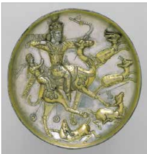
تصویر ۱. ظرف سیمین شماره ۱، موزه متروپولیتن (URL 1)

شیوه بازنمایی صحنه و سوار بر شتر بودن بهرام و آزاده برخلاف روایت نظامی، کاملاً منطبق بر روایت فردوسی است. همچنین آراسته‌بودن آن به دیبا (فردوسی، ۱۳۷۵: ۲۷۴). در شاهنامه اگرچه به هنر چنگ‌نوازی آزاده اشاره شده، برخلاف هفت‌پیکر، سخنی از چنگ‌نواختن آزاده هنگام شکار به‌میان نیامده است. این نکته نیز با تصاویر این ظروف مطابقت دارد. علاوه‌براین، در هر سه ظرف، چهار آهو ترسیم شده است؛ دو آهو نقش بر زمین و دو آهوی دیگر - که بر هر سه ظرف در مرکز توجه ترسیم شده است - یکی با تیر هر دو شاخ از دست‌داده و دیگری با اصابت دو تیر بر سر نقش شده است.