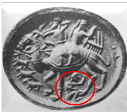
تصویر ۶. مهر منتسب به دوره ساسانی، موزه استاتلیش در کسل (Ettinghausen, 1979:pl.IIIa)

با وجود ابتدایی بودن نقوش مهرها، خطوط اصلی داستان به‌روشنی پیدا است. در هر دو مهری که تصویرشان در دست است، کنیزک چنگی در دست و پشت به شاه و تقریباً با جثه‌ای هم‌اندازه با او تصویر شده است. برخی از بخش‌های تصویر شده نه تنها بیش از نقوش ظروف به اشعار فردوسی شباهت دارد بلکه نقششان تنها به بازنمایی بخشی از این داستان محدود نمی‌شود. برای نمونه، برخلاف تصاویر ظروف که تنها بر همراهی کنیزک با شاه تأکید دارند، بر روی مهرها کنیزک به‌صورت مشخص نوازنده موسیقی است. شاه کمان به دست روبه جانورانی نشانه رفته که از پیش شتر در حال فرارند. به دلیل روشن نبودن خطوط بدن جانوران، تشخیص نوع یا تعداد دقیق آنها امکان‌پذیر نیست. با وجود این، به راحتی می‌توان پیکر انسانی را که در نقش هر دو مهر، زیر پای شتر قرار گرفته، تشخیص داد. شیوه ترسیم این فرد که بی‌گمان همان کنیزک است، نشان از تأکید بر عاقبت داستان و به‌زیرافکندن او دارد. عاقبتی که در شاهنامه آمده و در هفت‌گنبد چنین نیست.