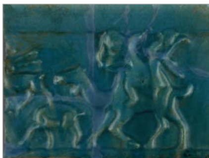
تصویر ۱۸. کاشی تک‌رنگ، موزه لوور (URL 14)