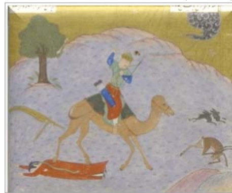
تصویر ۲۲. برگ از شاهنامه، سال ۸۶۴ ه.ق.، مکتب شیراز دوره تیموری (URL 16)