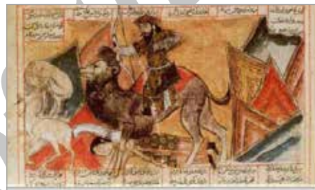
تصویر ۲۰. شاهنامه آل‌اینجو، شیراز، سال ۷۳۱ ه.ق.، توپقاپی‌سرای (اژند، ۱۳۸۹: تصویر ۱۸۰)

تاکنون پیش از دوره ایلخانی، نگاره‌ای که بر کاغذ بیانگر داستان شکار بهرام و کنیزک باشد، به دست نیامده است. با توجه به گسترش نگارگری در این دوره و رواج استفاده از آثار ادبی و حماسی ایران، شاهد تصویرگری داستان بهرام‌گور و آزاده می‌توان بود. اما بررسی‌ها نشان می‌دهد بر نگاره‌های یادشده بدون اشاره به خط اصلی و نخستین داستان، تنها