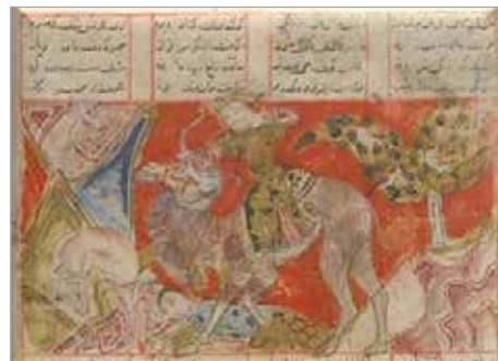
تصویر ۲۱. برگ از شاهنامه فردوسی، احتمالاً ۷۵۴ ه.ق.، شیراز (URL 10)