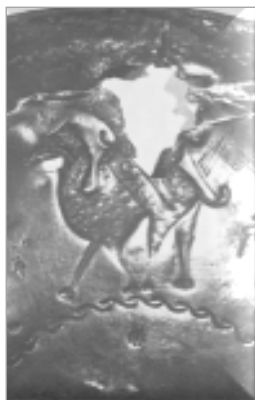
تصویر ۷. ظرف فلزی، اواخر سده دوم و اوایل سده سوم ه.ق (Ettinghausen, 1979: pl.IXb)

مضامین و نقوش نیز صادق بود چنان که افزون بر به کارگیری شیوه‌های تزئینی کهن، شیوه‌های نوینی پدید آمد. نقوش و مضامین در هر قالب تزئینی که به اجرا درمی‌آمدند، متناسب با کاربری ظرف و با تبعیت از شکل و فرم آن و حتی بازار فروش و سلیقه متقاضیان صورت می‌گرفت. از این رو، محصول نهایی ترکیبی متناسب از شکل، نقش و کاربرد را به نمایش می‌گذاشت. در کنار نقوش هندسی، گیاهی و کتیبه‌ای؛ نقوش جانوری و انسانی و اساطیری نیز در این دوره کاربرد زیادی یافت. گرابار ۳۲ باور دارد که آراسته‌بودن ظروف سفالین دوره سلجوقی به تصاویر انسانی و جانوری را باید از برجسته‌ترین ویژگی‌های سفال این دوره دانست (گرابار، ۱۳۸۰: ۶۰۷). گرچه استفاده از این نقوش و تصاویر در دوره‌های پیش‌تر نیز رواج داشته، از نظر کمیت محدود بوده است. بر همین اساس، شاید بتوان بهره‌گیری از نقوش جانوری و انسانی را یادآوری و بازنمایی سنت و شیوه ساسانی دانست. پوپ ۳۳ از تأثیرپذیری نقوش و شیوه ارائه آن از هنر ساسانی در این دوره سخن می‌گوید و معتقد است که با وجود تازه‌بودن اجرا، روح ساسانی در ارائه نقوش کاملاً قابل مشاهده است (Pope, 1939, Vol.IV: 1526-1529).