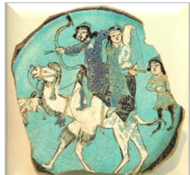
تصویر ۱۳. ظرف سفالین با فناوری مینایی، کاشان یا ری، سده‌های ششم و هفتم ه.ق. (URL 9)