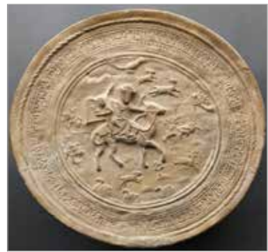
تصویر ۱۰. سفال قالب‌زده، بدون لعاب، احتمالاً سده‌های پنجم تا هفتم ه.ق. (URL 6)