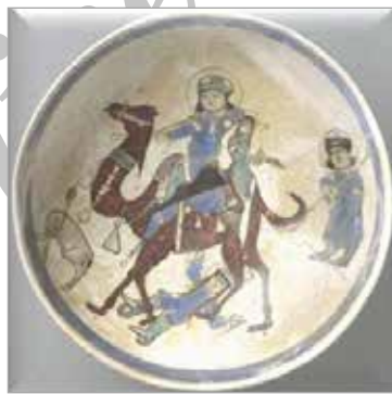
تصویر ۱۱. ظرف مینایی، سده‌های ششم و هفتم ه.ق.، موزه بروکلین (URL 7)