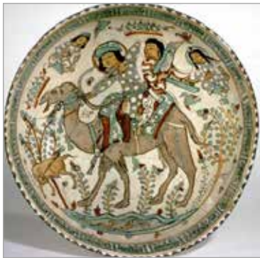
تصویر ۱۲. ظرف مینایی، سده‌های ششم و هفتم ه.ق.، کاشان، موزه متروپولیتن (URL 8)

عظیم‌تر از آزاده، ترسیم شده‌است (تصویر ۱۶). بهرام‌گور بر زمینه‌ای فیروزه‌ای با شرباشی ۴۱ بر سر و هیبتی عظیم‌تر از آزاده، ترسیم شده است. این کاشی در سال ۶۳۳ ه.ق. ساخته شده و براساس شکل و زوایای آن احتمالاً بخشی از یک قاب کاشی بزرگ‌تر به شکل چندضلعی بوده چراکه نمونه‌های بسیاری از این‌گونه قاب‌ها با مضامین تزئینی متفاوت از کاخ‌های سلاطین سلجوقی روم در قونیه به‌دست آمده است. کاشی و ظروف بسیاری با فناوری مینایی در دوره سلجوقیان روم و با تأثیر از فناوری مینایی دوره سلجوقیان ایران ساخته شده اما از نظر کیفیت، در رده نازل‌تری از اشیای مینایی ایرانی قرار دارند. این قطعه را نیز از این قاعده مستثنی نمی‌توان دانست. بی‌شک این کاشی‌ها در کارگاه‌های محلی ساخته شده‌اند اما با قوانین تصویرگری ظروف مینایی ایرانی و با تأثیرپذیری مستقیم از مکتب نگارگری سلجوقیان، نقش شده‌اند. چهره‌های گرد ترکی، چشمان باریک و کشیده، ابروهای کشیده به‌هم پیوسته، نیم‌تاج برای آزاده و هاله گرد سر بهرام از نمونه‌های این تأثیرات است. نکته جالب توجه آنکه داستان بهرام‌گور و آزاده از داستان‌های بومی آسیای صغیر نیست؛ استفاده از این مضمون به دلیل قرب فرهنگی ایران و آسیای صغیر در این دوره و تبعیت سلاطین