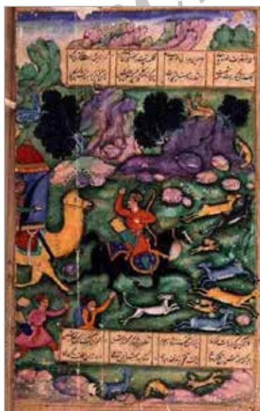
تصویر ۲۳. برگ از شاهنامه، سده دوازدهم ه.ق.، مکتب مغولان هند (URL 17)

ملازمان حاضر در صحنه در حال گریزاندن حیوانات اند که شمار بسیاری از آنها در تصویر به چشم می‌خورد و شکار به صورت طبیعی در حال انجام یافتن است. بهرام و کنیزک و ملازمان لباسی هندی بر تن دارند که نشانه تأثیر فرهنگ هندی بر این داستان ایرانی است. پس از دوره صفوی و حمایت شاه صفوی از همایون و کمک در برگرداندن سلطنت به وی، دربار هند همچنان ارتباط خود را با دربار شاهان ایران حفظ کرد و همواره استقبالگر هنرمندان، ادیبان و صنعتگران ایرانی بود. این امر موجب تأثیرات عمیق فرهنگ ایرانی بر فرهنگ هند دوره مغولان گردید تا جایی که زبان پارسی زبان رایج دربار هند شد و بسیاری از شعرای هندی به زبان پارسی شعر سرودند. بخشی از این تأثیرات را می‌توان در نگارگری این دوره از طریق استفاده از بن‌مایه‌های فرهنگی و ادبی ایران همچون این برگ از نگاره شاهد بود. ۲۲