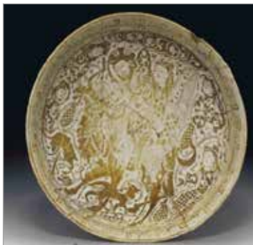
تصویر ۱۵. ظرف سفالین زرین‌فام با داستان بهرام‌گور و آزاده (URL 11)