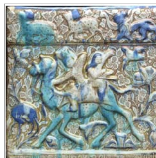
تصویر ۱۷. کاشی زرین‌فام، به‌دست‌آمده از تخت‌سلیمان، موزه ویکتوریا البرت (URL 13)