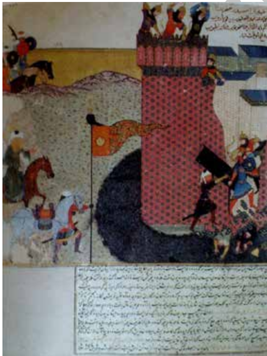
تصویر ۲. فتح خیبر، کلیات تاریخی حافظ آبرو، تیموری، هرات (شایسته فر، ۱۳۸۴: ۳۲)

همان‌طور که اشاره شد، واقعه فتح خیبر را اهل سنت نیز روایت کرده‌اند؛ ولی در روایتی که شیعیان ارائه داده‌اند، بر جنبه‌های فوق انسانی و اعجاز‌گونه عمل حضرت علی تأکید بسیار می‌شود. به طوری که یکی از فقهای شیعه پس از شرح ماجرا می‌نویسد: «و از مواردی است [واقعه خیبر] که خداوند متعال او را به نیرو و قدرت ممتاز گرداند و خرق فرمود و آن را نشانه و معجزه قرارداد» (شیخ مفید، ۱۳۸۸: ۲۸۹). برخلاف این طرز تلقی، در نگاره مذکور به هیچ‌نماد و نشانه‌ای که بر جنبه فوق انسانی و معجزه گونه پیروزی حضرت علی تأکید کند، بر نمی‌خوریم. اساساً غلبه بُعد روایی نگاره بر جنبه نمادین آن آشکار است و تنها روایت تاریخی واقعه، مصور شده که در راستای محتوای تاریخی کتاب و دیدگاه اهل سنت است. در نوشته گوشه تصویر نیز، پس از نام حضرت علی به جای علیه‌السلام از اصطلاح رضی‌الله‌عنه استفاده شده که بیشتر