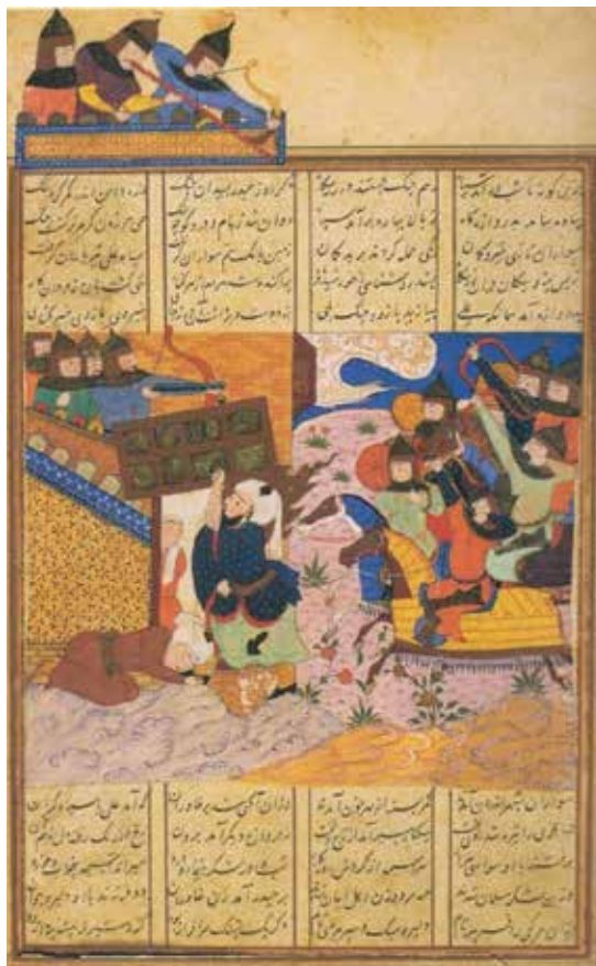
تصویر ۳. خاوران نامه، فتح خیبر، دوره ترکمن (انوری، ۱۳۸۱: ۶۱)

می‌دهد. موقعیت فضایی و اندازه شمایل حضرت در کادر تصویر نیز، سبب تأکید بر ایشان شده است؛ مانند نگاره پیشین، با پوششی معمولی و بدون زره جنگی ترسیم شده، با این تفاوت که در این نگاره، شمشیر ندارد که رشادت و بی‌باکی و روحیه پهلوانی شان را بیشتر منعکس می‌نماید. همچنین، نگارگر برای نشان دادن قدرت و توانایی جسمانی حضرت، او را فربه‌تر از دیگران کشیده و در مقایسه با نگاره نسخه کلیات تاریخی، قدرت، صلابت و استحکام در پیکر حضرت هویدا است. اگر چه می‌دانیم که از خصوصیات نگارگری این دوره، ترسیم انسان‌های درشت‌اندام، نیرومند و دارای سر بزرگ است (پاکباز، ۱۳۷۹)؛ با این حال، در این نگاره، پیکر حضرت علی از پیکر سایر شخصیت‌ها، کاملاً متمایز است. در بخشی از نگاره، بام قلعه در خارج از کادر اصلی قرار داده شده که نشان دهنده نفوذناپذیری قلعه است و اهمیت مبارزه قهرمانانه و پهلوانانه حضرت علی را بیشتر به نمایش می‌گذارد. به هر حال، نگارگر، بر قدرت و توانایی پهلوانانه و قهرمانانه حضرت به‌مانند انسانی شجاع و نترس و فاتح تأکید کرده است. باینکه نگارگر، شعله‌های آتش را در اطراف سر حضرت قرار داده و با گذاشتن نقوش تزئینی بر روی