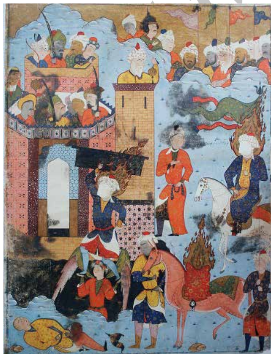
تصویر ۴. فتح خیبر، فالنامه، کتابخانه چستر بییتی دوبلین، ۴۵×۵۹،۵ سانتی‌متر (farhad,2010:121)

نشانه قابل تأمل دیگری که گفتمان شیعی از واقعه خیبر بازمی‌نمایند، تصویر فرشته‌ای است که پاهای حضرت علی بر دستان او قرار گرفته و در میان نگاره‌های فتح خیبر، بی‌نظیر است. هنرمند، با این نشانه تصویری، بر پیوند حضرت با آسمان و تکیه او بر نیروهای فرازمینی و الهی تأکید می‌نماید و درست، به همین دلیل است که این نگاره از سایر نگاره‌های فتح خیبر متمایز می‌گردد. پاهای حضرت علی بر روی دستان فرشته‌ای قرار گرفته که نشانه‌ای از قوت ربانی و نصرت سبحانی اوست. همان گونه که در روایت شیعی فتح خیبر آمده، پیامبر در روز واقعه به علی فرمود: «پرچم را بگیر و برو که جبرئیل به همراه توست» (شیخ مفید، ۱۳۸۸: ۱۱۲). خود حضرت نیز