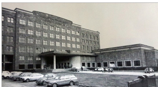
تصویر ۳. دانشکده زبان و تاریخ و جغرافی (Batur, 2005: 87)

در دهه ۱۹۵۰ م. در ترکیه با پایان بحران پس از جنگ، مفهوم غرب برای ترک‌ها از اروپا به آمریکا تغییر یافت. زمینه‌ساز این پدیده، کمک‌های مالی و نظامی و مستشاری آمریکا در