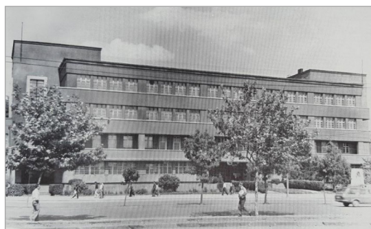
تصویر ۲. انستیتوی دختران عصمت اینونو (Batur, 2005: 83)

در سال‌های پایانی دهه بیست، مهم‌ترین پروژه‌ای که در ترکیه به خارجیان واگذار شد، طرح جامع آنکارا بود. برنده این