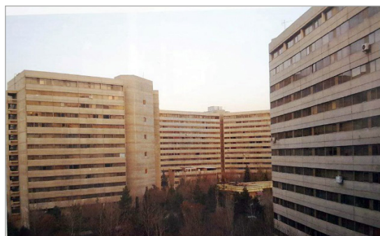
تصویر ۸. شهرک اکباتان تهران (قبادیان، ۱۳۹۲: ۲۵۱)

علت دیگر حضور معماران خارجی در ایران، دعوت از معماران مشهور کشورها و تأسیس شرکت‌هایشان در ایران به واسطه آشنایی معماران ایرانی تحصیل کرده در خارج با آنها بود. مهم‌ترین اثر به‌جامانده از معماران خارجی در این جریان، هتل هیلتون با طراحی راگلان اسکوایر ۵۸ به همراه جمعی از معماران ایرانی است. این بناها به سبک‌های مدنظر معماران بنا و بدون توجه به سنت‌های معماری ایرانی طراحی شده بود. مواجهه با بحران کمبود مسکن در شهرهای بزرگ در دهه ۱۳۲۰ ه.ش. (۱۹۴۰ م.) و ۱۳۳۰ ه.ش. (۱۹۵۰ م.)، با حضور شرکت‌های عمدتاً آمریکایی در طرح‌های انبوه‌سازی مسکن به شیوه مدرنیسم بین‌الملل همراه بود. بهترین نمونه این جریان در ایران، شهرک اکباتان (تصویر ۸) تهران است. در نقد این