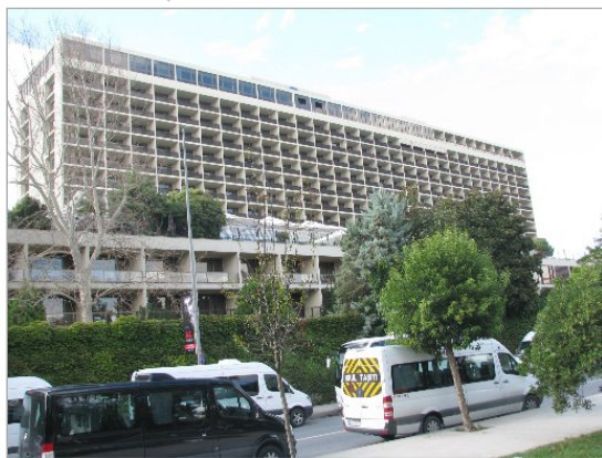
تصویر ۴. هتل هیلتون استانبول (نگارندگان، ۱۳۹۳)