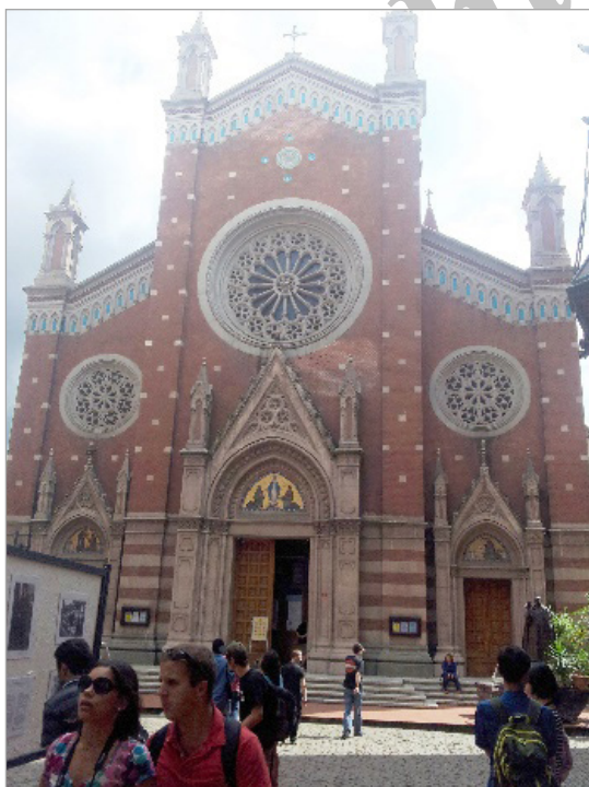
تصویر ۱. کلیسای سنت آنتوان اثر گولیو مونگری (نگارندگان، ۱۳۹۳)

جانشین اگلی در دانشکده هنرهای زیبا و مدیریت دفتر معماری وزارت آموزش در آنکارا برونو تائوت بود. «رهبر جریان اکسپرسیونیسم در سال‌های دهه ۱۹۱۰ م. و برنامه خانه‌سازی اجتماعی بین سال‌های ۱۹۲۴ تا ۱۹۳۳ م.، آلمان را در سال ۱۹۳۳ م. ترک کرد و پس از آنکه سه سال را در