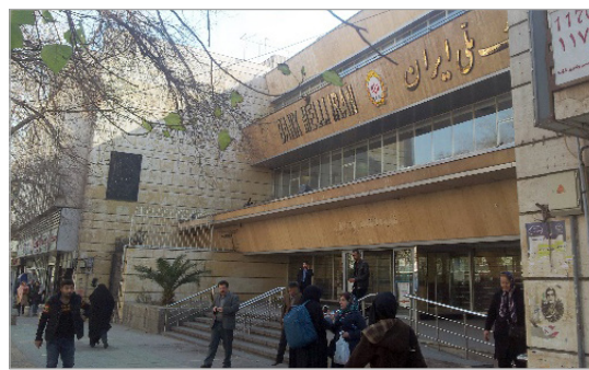
تصویر ۷. بانک ملی ایران شعبه دانشگاه تهران (نگارندگان، ۱۳۹۴)