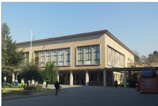
تصویر ۶. دانشکده هنرهای زیبای دانشگاه تهران

خروج معماران خارجی از ایران در سال‌های پس از جنگ جهانی دوم با حضور جایگزین معماران فارغ‌التحصیل دانشکده هنرهای زیبا مانند هوشنگ سیحون یا معماران ایرانی فارغ‌التحصیل خارج، مانند عبدالعزیز فرمانفرمایان، محسن فروغی، وارطان هوانسیان و کریم طاهرزاده بهزاد همراه بود که اغلب، فارغ‌التحصیل مدرسه بوزار فرانسه بودند. اولین طرح جامع شهر تهران با همکاری اولین مهندسان مشاور