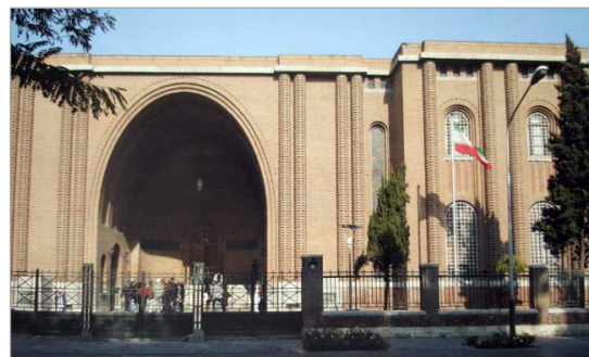
تصویر ۵. سردر ورودی موزه ایران باستان با الهام از طاق کسری (قبادیان، ۱۳۹۲: ۱۹۲)