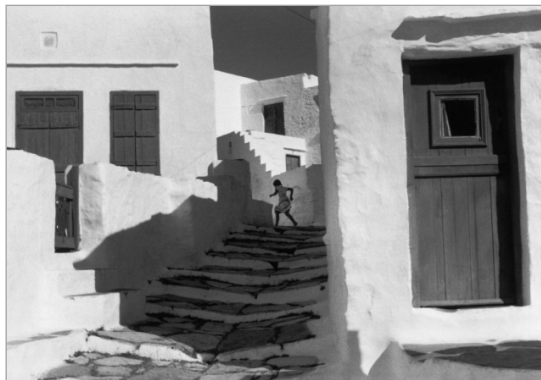
تصویر ۶. کارتیه برسون، یونان، ۱۹۶۱ (URL:4)