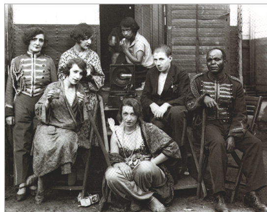
تصویر ۱. آگوست ساندر، دوره‌گردها، ۱۹۲۶. (URL: 1)