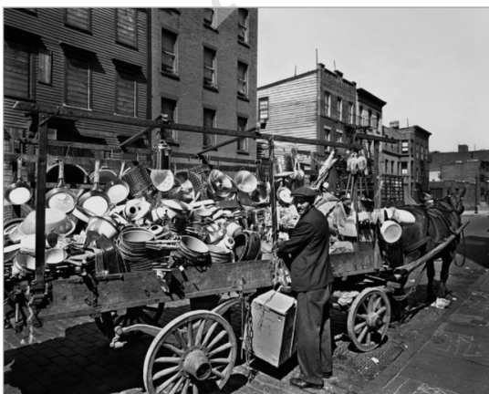
تصویر ۲. برنیس ابوت، فروشگاه سیار، نیویورک، ۱۹۳۶. (URL: 2)

در همین رابطه و از سویی دیگر، عکس‌ها با یکی دیگر از خصوصیات نثر همانند هستند؛ نثر، زبان مورد استفاده در علم است، یعنی برای توصیف و توضیح موضوعی به کار می‌رود و می‌توان مسأله صدق و کذب آن را سنجید؛ مسأله‌ای که در عکاسی نیز قابل طرح است. اگر چه «همه عکس‌ها به‌نوعی توصیفی هستند؛ یعنی اطلاعاتی توصیفی بصری را توأم با جزئیات و وضوح بیشتر یا کمتر، درباره صورت بیرونی اشخاص و اشیاء عرضه می‌دارند» (برت، ۱۳۷۹: ۸۷)، اما در برخی مواقع، عکاس نقش خود را در بازنمایی و ثبت صحنه پیش‌رویش به‌حداقل می‌رساند تا عکس او به‌عنوان یک سند