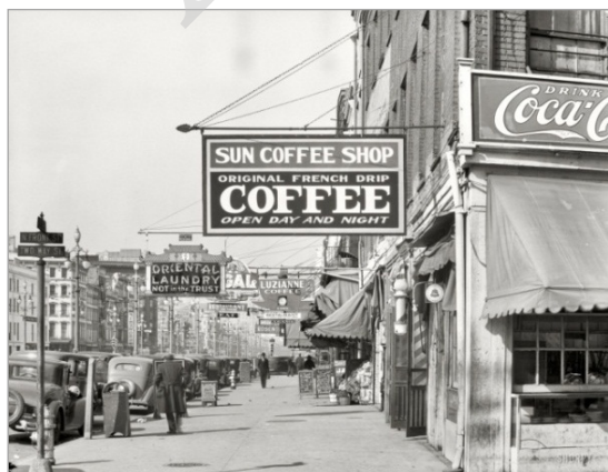
تصویر ۴. واکر اوانز، کافی‌شاپ، ۱۹۳۵ (URL:3)

«نظم در لغت به‌معنی به‌هم پیوستن و در رشته کشیدن دانه‌های جواهر و در اصطلاح، سخنی است که دارای وزن و قافیه باشد» (همایی، ۱۳۶۳: ۵). هم‌چنین، «کلام عادی منظوم، نظم نام دارد» (شمیسا، ۱۳۷۲: ۱۰۰). برای نمونه، به‌جای