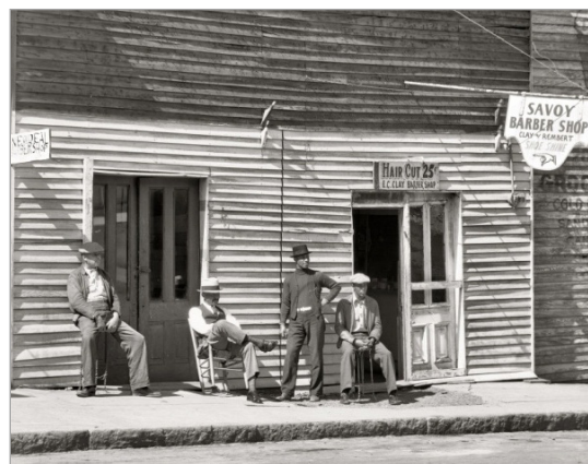
تصویر ۳. واکر اوانز، خیابان، ۱۹۳۵ (URL:3)