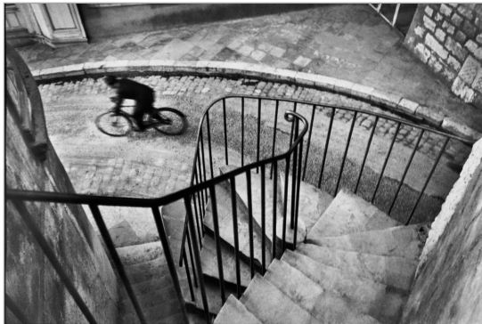
تصویر ۵. کارتیه برسون، فرانسه، ۱۹۳۲ (URL:4)