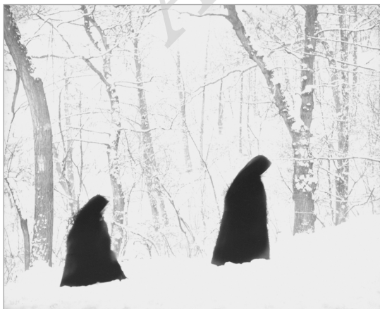
تصویر ۱۰. رابرت هاووز، راه‌های پایین، ۱۹۵۴ (هاووز، ۱۳۸۱: ۱۵)