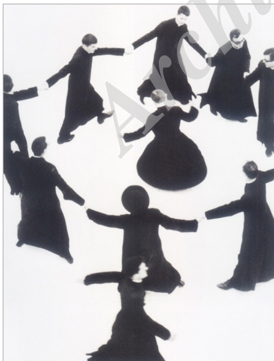
تصویر ۷. جاکومتی، راهبه‌ها، ۱۹۷۰ (URL:5)

عادی و گزارش‌گونه بپردازد، با قاب‌گذاری بر عناصر از زاویه‌ای غیرمعمول و ترکیب آنها در لحظه‌ای خاص و به‌شکلی جدید، نامتعارف و جسورانه، صورت عکس یعنی نحوه هم‌نشینی و رابطه درونی عناصر عکس را برجسته ساخته است (تصاویر ۵ و ۶ و ۷). از این بابت، اگر در عکس‌های نشرمانند، با مسأله ثبت ساده وقایع و لحظه‌های معمول سروکار داریم، در عکس‌های نظم‌مانند، با ترکیب عناصر واقعی به‌شکلی موزون و جذاب و جدید و غیرمتعارف مواجه می‌شویم؛ ترکیبی که حس زیبایی‌شناسانه ما را برمی‌انگیزاند. در این نوع عکس‌ها، نحوه نگاه عکاس به موضوع اهمیت بیشتری دارد تا خود موضوعی که ثبت شده است. از این جهت، تفاوت عکس‌های شبیه‌نثر با عکس‌های شبیه‌نظم را می‌توان تفاوت میان گرفتن تصویر با ساختن تصویر دانست. برخلاف عکس‌های نثرگونه، در اینجا چگونگی ترکیب تک‌تک عناصر با یکدیگر برای عکاس اولویت داشته و عناصر دنیای بیرونی، بهانه‌ای برای مکاشفه بصری و زیبایی‌شناسی او بوده‌اند. بنابراین، عکس‌های نظم‌گونه را می‌توان در تطابق با این دیدگاه برسون درباره عمل عکاسانه دانست: «عکس گرفتن به معنای یافتن ساختار جهان، غرق‌شدن در لذت ناب فرم و آشکارساختن این مسأله است که در سرتاسر این هاویه نظمی برقرار است» (سونتاگ، ۱۳۹۰: ۱۱۹ و ۱۲۰).