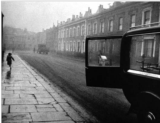
تصویر ۸. رابرت فرانک، لندن، ۱۹۵۳ (کو، ۱۳۷۹: ۳۳۳)